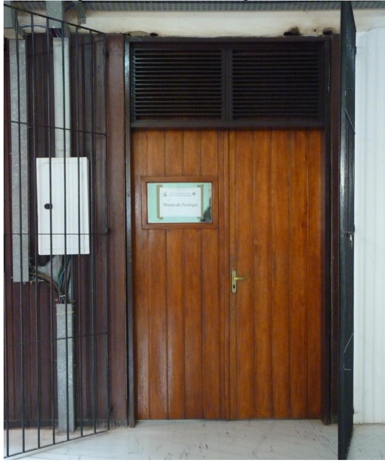
Figura 4 – Museu de Zoologia – Entrada