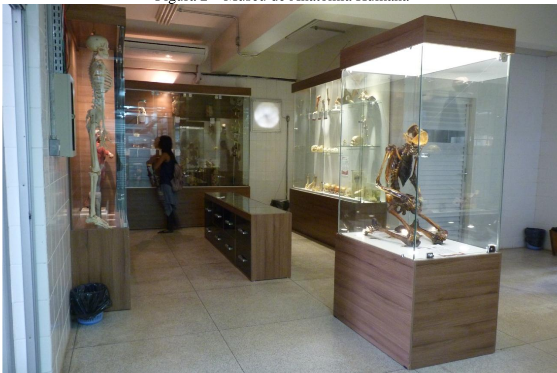
Figura 2 – Museu de Anatomia Humana