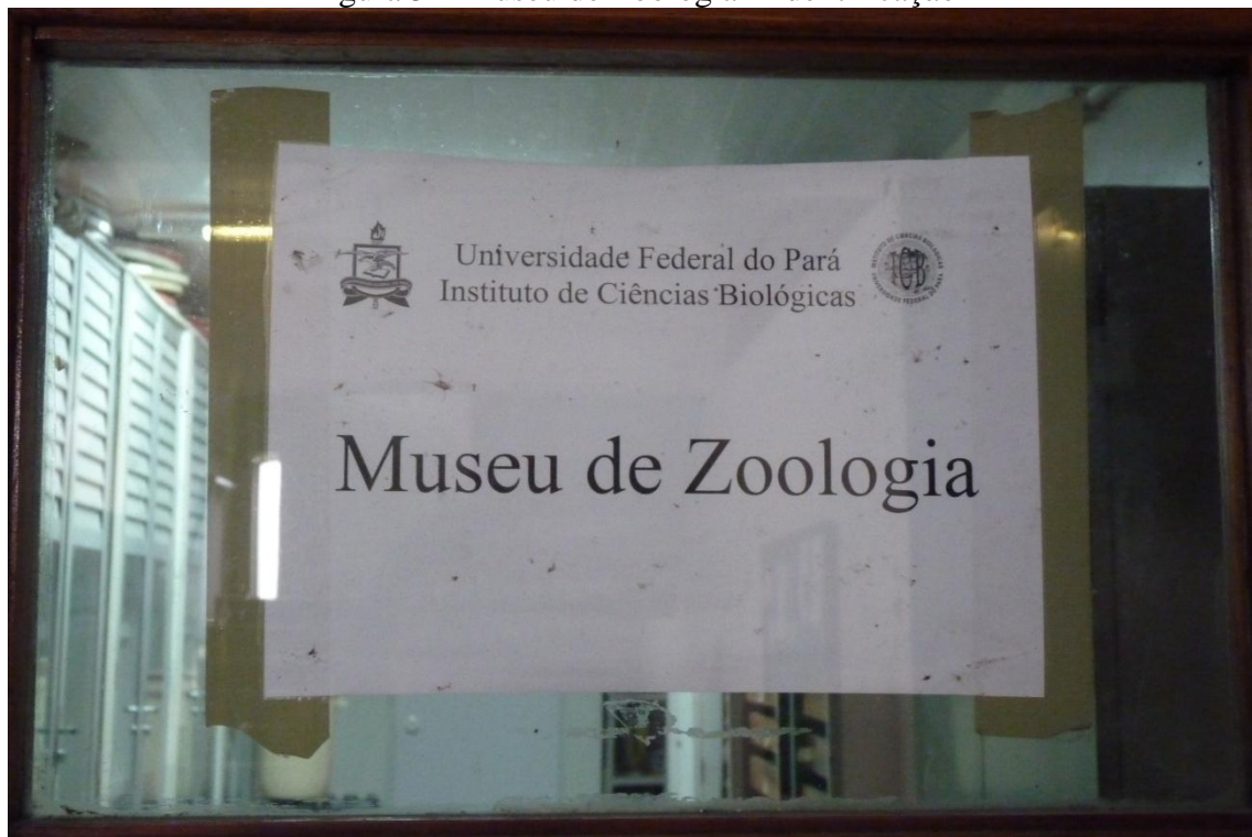
Figura 5 – Museu de Zoologia – Identificação