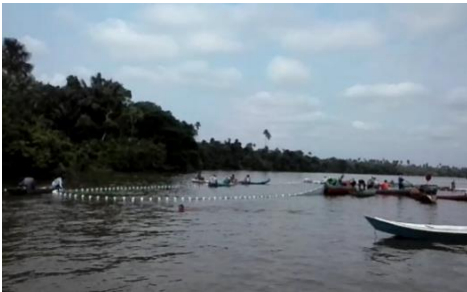
Figura 7: Momento em que o borqueio está sendo realizado.

É importante destacar que dentro do acordo foram estabelecidas duas comissões que representariam o grupo de baixo e grupo de cima do rio, mas a responsabilidade de fiscalizar se estenderia a todos os moradores e as punições pelo descumprimento das normas valeriam tanto para os pescadores de fora quanto aos da própria comunidade. Por exemplo, os donos das redes de puçá não poderiam realizar borqueios (ver Figura 7) para capturar abaixo de três basquetas 12 de mapará (ver Figura 8), se caso realizassem o borqueio e capturassem menos que três basquetas teriam que entregar todo o pescado que pegara para a comunidade. Não se permitia que os mesmos borqueassem mais de duas vezes sem peixe e, caso ocorresse, ficariam suspensos de pescar dentro do rio por uma semana.