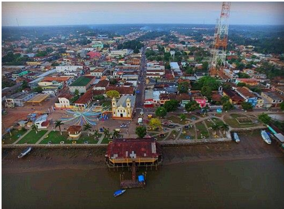
Figura 1: Visão panorâmica da Cidade de Igarapé-Miri.

O termo "Igarapé-Miri" é uma referência ao rio homônimo que banha a cidade (Figura 1). Traduzido do tupi "Igarapé-Miri" significa "Caminho de Canoa Pequena", através da junção dos termos ygara (canoa), pé (caminho) e mirim (pequeno) (LOBATO, 1985).