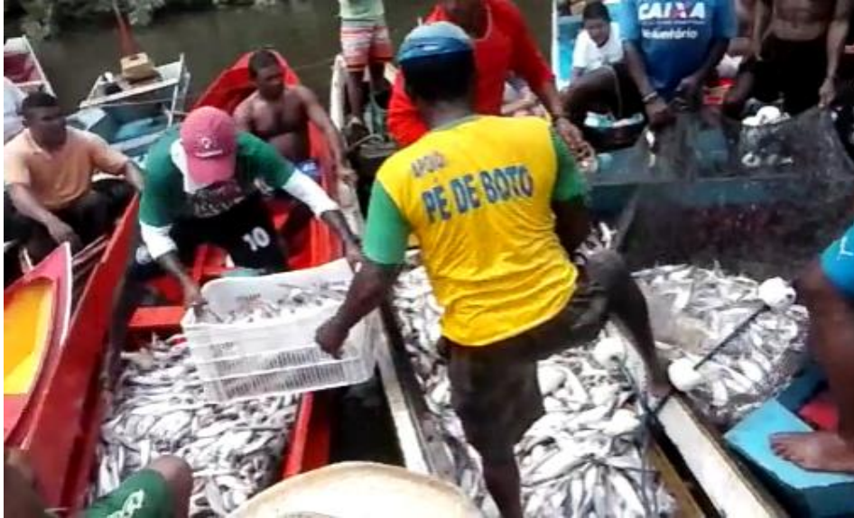
Figura 8: Pescadores medindo o mapará na basqueta que será destinado a comunidade.

As regras do acordo, descritas a cima, serviam como um meio de controlar os baques de água 13 com a ausência da captura do pescado, o que prejudica bastante a produção, uma vez que a cada borqueio os peixes que não ficam presos na rede, se dispersam, e acabam fugindo para outros locais e até mesmo para fora do rio. Segundo Santos (2011), no caso dos acordos de pesca, as relações sociais de confiança e de identidade cultural e territorial entre as famílias e os produtores ribeirinhos facilitaram a transcendência de motivações e estratégias de ordem individual, estimulando a adoção de regras de comum acordo no sentido de regulamentar o uso dos escassos recursos pesqueiros enfatizando que: