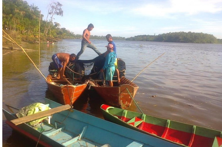
Figura 6: Redes de borqueio, apetrecho utilizado pelos pescadores

situação de desacordo pela falta de controle da pesca na comunidade, então surgiu entre os comunitários a proposta de se criar acordos de pesca.