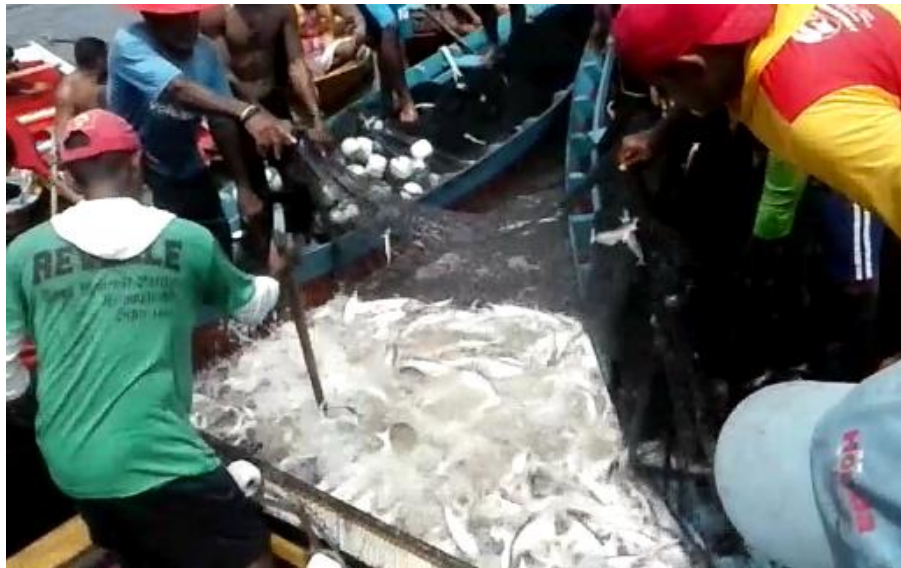
Figura 5- Pescadores posicionados para a retirada do peixe da rede.

No momento em os pescadores puxam os cabos as redes se fecham então, o taleiro entra no meio do borqueio com sua tala para verificar se os peixes estão presos na rede, após essa análise os homens do casco precisam fazer bastante força, puxando rapidamente as redes para apertar os peixes. Nesse processo, quando os peixes (mapará) começam a aparecer na superfície da água os pescadores pressionam a rede e posicionam os cascos para retirar os peixes (ver Figura 5) que, será calculada a quantidade em paneiros ou basquetas antes de ser dividido entre os donos das redes e a comunidade local.