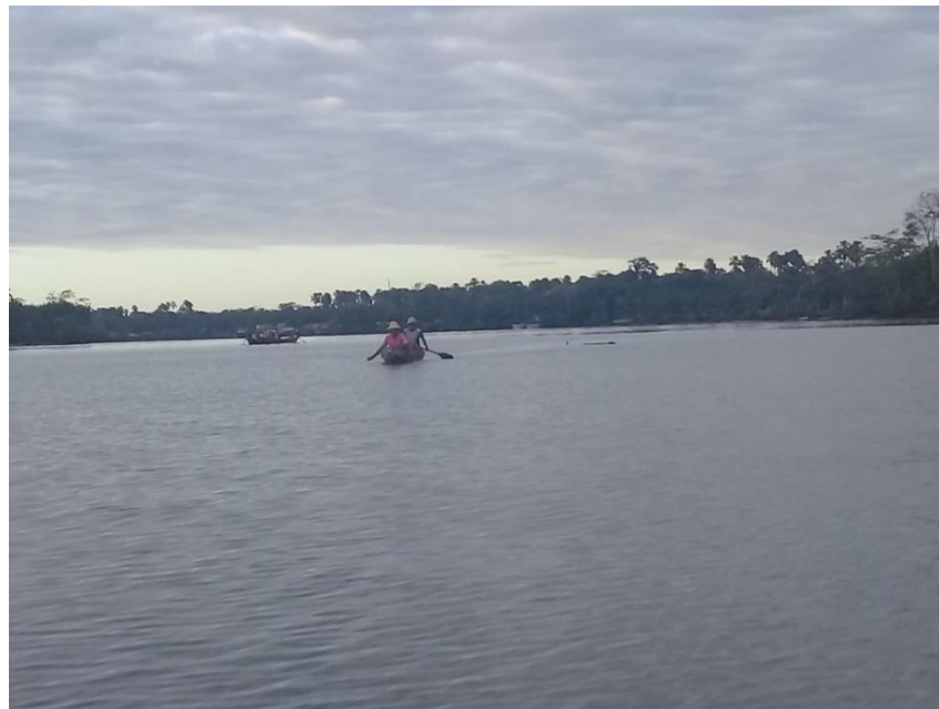
Figura 4: Taleiro sondando o cardume de mapará.

É importante ressaltar a importância do taleiro na pesca do mapará (ver Figura 4), pescador responsável em identificar os cardumes de peixe a partir de sua experiência adquiridas ao longo de sua vida na pesca ou repassados por alguém que lhe antecedeu no trabalho.