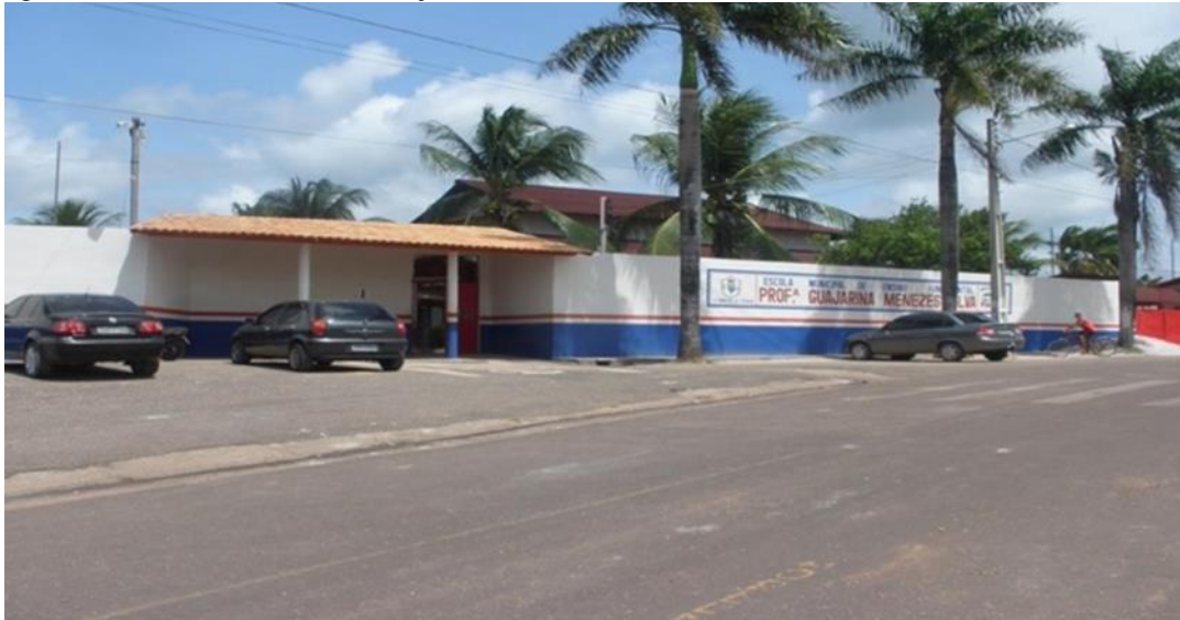
Figura 2 - área externa da escola Gujarina Menezes Silva