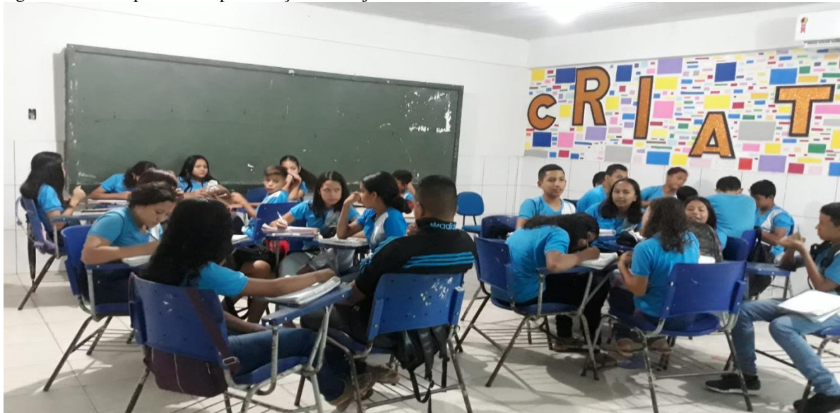
Figura 5- Aula expositiva e apresentação do Projeto.