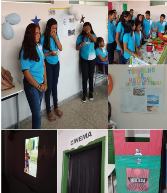
Figura 3- Registros da exposição dos trabalhos