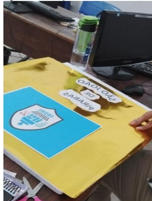
Figura 4- Construção dos trabalhos