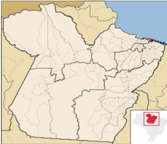
Figura 1- Localização de São João de Pirabas no Estado do Pará