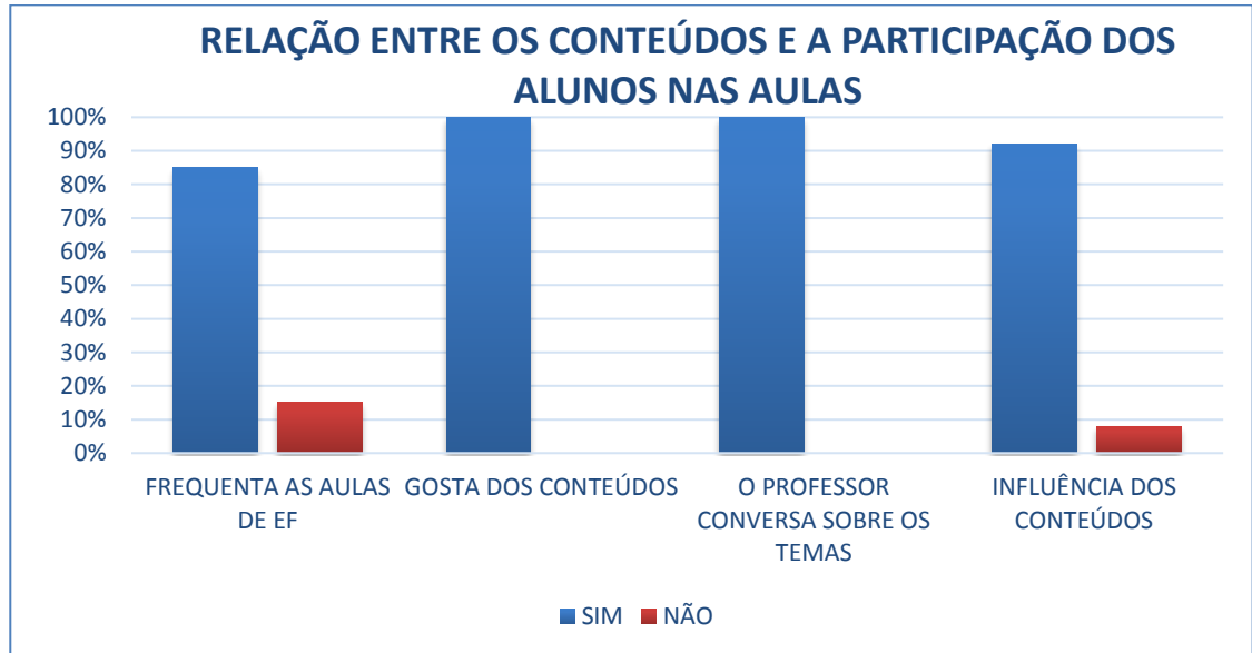
Figura 1- Relação entre os conteúdos e a participação dos alunos nas aulas.

Na figura 1, podemos observar de que maneira os alunos se relacionam com os conteúdos da EF e a participação deles nas aulas da disciplina.