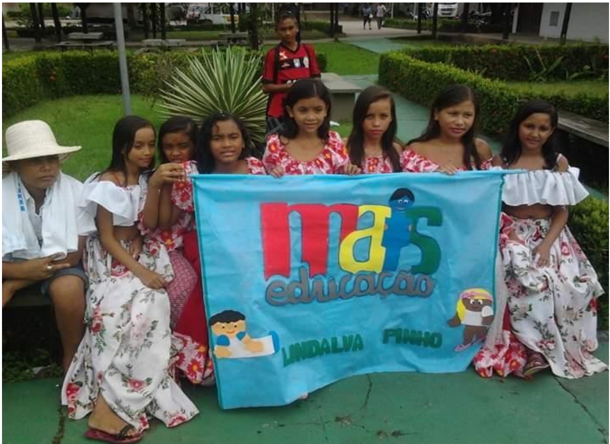
Figura 2 - Alunos atendidos pelo programa Mais Educação.

Uns dos programas executados na escola foi o Programa Mais Educação, criado no governo Lula, pela Portaria Interministerial número 17/2007 e regulamentado pelo Decreto 7.083/10, constitui-se como estratégia do Ministério da Educação para indução da construção da agenda de educação integral nas redes estaduais e municipais de ensino que amplia a jornada escolar nas escolas públicas. Para no mínimo sete horas diária, por meio de atividades optativas nos macrocampos: acompanhamento pedagógico; educação ambiental; esporte e lazer; direitos humanos em educação; cultura e artes; cultura digital; promoção de saúde; comunicação e uso de mídias; investigação no campo das ciências da natureza e educação econômica.