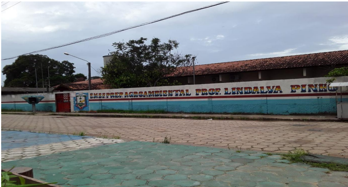
Figura 1- Fachada da escola Municipal de Ensino Fundamental Profª Lindalva Pinho.

A Escola Municipal de Ensino Fundamental Preparatório Agro-Ambiental Professora Lindalva Pinho, está localizada na Avenida Floriano Peixoto, S/N Bairro Cafezal, Zona Urbana em Currálinho. Mantida pela prefeitura Municipal de Currálinho, pelos programas federais e administrada pela Secretaria Municipal de Educação. Foi por meio da resolução nº221/10/08/2012 que se deu a autorização para o Funcionamento do Ensino Fundamental de primeiro ao nono Ano e da Educação de Jovens e Adultos, primeira e quarta etapas.