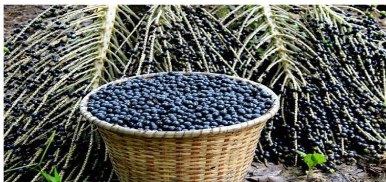
Imagem 8- A fruta do açaí após ser retirado da árvore