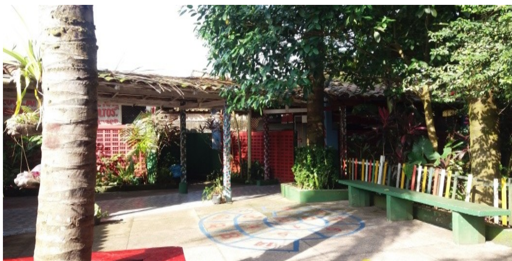
Imagem 2 -Pátio da escola

1-Formar cidadãos conscientes do seu ser e do seu fazer; Contribuindo para a construção de uma sociedade inclusiva, mais justa e igualitária; 2-Assumir o processo de educação transformadora, libertadora, segundo os princípios de (La Salle e Paulo Freire); 3-promover a educação cristã com respeito à diversidade religiosa; 4-Proporcionar um ensino que oriente o educando a se integrar no meio social como agente de transformação e colaboração; 5-Educar para a vida com justiça a partir dos princípios éticos; 6-Realizar ações(projeto escola da família) que minimizem a distância entre as famílias e os segmentos escolares; 7-Sensibilizar a comunidade escolar sobre a importância da inclusão social; Incluir todos aqueles que se sentem excluídos do sistema educativo, respeitando as leis que regem a educação inclusiva; 8-Promover a articulação da escola em busca de parcerias que viabilizem a concretização das ações propostas pelos segmentos escolares; 9-Garantir formação pedagógica e administrativa continuada para funcionários da escola; 10-Promover atividade de cunho cultural, esportivo e recreativos a partir de elaboração de projetos educativos; 11-Garantir uma aprendizagem significativa e de qualidade, visando à formação integral do educando(PPP da Escola CEPAL, 2018).