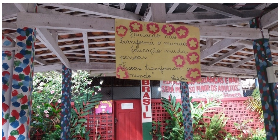
Imagem 5- Faixa com o lema Da escola ao fundo sala de aula.

desenvolvendo uma prática que envolvia meninos e meninas na atividade física, a fim de trabalhar as relações de gênero em grupo, e nessa dinâmica a professora organizou um menino ao lado de uma menina, em seguida, eles cantaram batendo palmas enquanto os alunos teriam que deixar o lenço atrás do outro e sair correndo em volta do círculo para tentar alcançar o aluno que deixou o lenço. Avaliando essa atividade, a professora relatou que os meninos estavam colocando o lenço apenas atrás dos meninos e as meninas apenas atrás das meninas, o que ela concluiu como uma dificuldade nas relações entre os gêneros, e, portanto, a professora conversou com eles sobre as relações sociais em grupo. Em síntese, a dinâmica da atividade era promover afetividade e o encontro dos pares no combate à violência e o feminicídio que tem crescido assustadoramente no Brasil nos últimos anos. A atividade também promoveu a inclusão de uma cadeirante que assistia alegremente junto à sua cuidadora toda ação realizada pelos alunos.