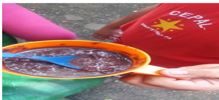
Imagem 7- Mingau de açaí na merenda do CEPAL.

A merenda preferida dos alunos é o açaí, fruto regional que é enviado pela SEMEC, é chega na escola muitas vezes na moto dos fornecedores que ganham a licitação para entregar esse açaí na escola, quando o açaí chega na escola, ele é colocado na geladeira da copa, enquanto aguarda o arroz ser fervido, em seguida, esse açaí é adicionado ao arroz já fervido e se transforma no “mingau de açaí”, conhecido e querido na região, sendo comercializado na feira de Abaetetuba e, em diversos pontos públicos da cidade. O mingau de açaí faz parte da cultura alimentar do paraense, sendo apreciado também nas ilhas e ramais do município. Ainda na década de 1999, quando o município de Abaetetuba era conhecido como a cidade das bicicletas, já era possível perceber a presença de vendedores do mingau de açaí em suas bicicletas pela feira da cidade. Na imagem 6, vemos uma aluna durante o recreio com seu copo de mingau de açaí.