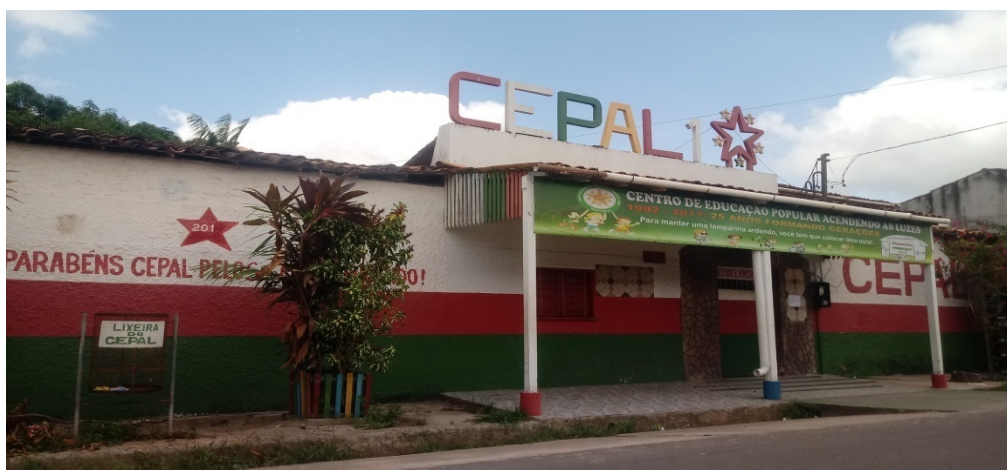
Imagem 1-O CEPAL