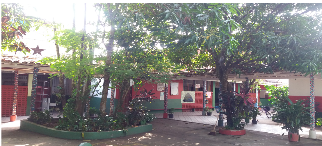
Imagem 3 -Pátio da escola em um outro ângulo

onde toda criança gostaria de estar, de correr de brincar e até sentar no jacaré para merendar, uma escola que encanta ao mesmo tempo que lança um convite ao natural, à infância vivida de fato pela alegria de aprender. No inverno as mangas caem e isso alegra as crianças. Apesar de todas essas plantas que enfeitam a escola, os funcionários tem um cuidado muito especial com a limpeza e higienização do espaço em um todo, as plantas são molhadas ao final da tarde e cuidadas para que não haja acúmulo de doenças, a escola promove ainda algumas ações em grupo, como atividades de ciências e geografia, onde as crianças levam plantas para enfeitar a escola, ou ajudam a molhar as plantinhas, e desde cedo aprendem a cuidar do meio ambiente. A escola exerce seu papel social quando; exerce ações que beneficiam a comunidade como a entrega de cestas básicas para as famílias carentes no entorno da escola e em seu caráter ecológico quando busca repassar a importância da preservação do meio ambiente. Do primeiro ao quinto ano as questões ambientais, de fato, são trabalhadas na escola.