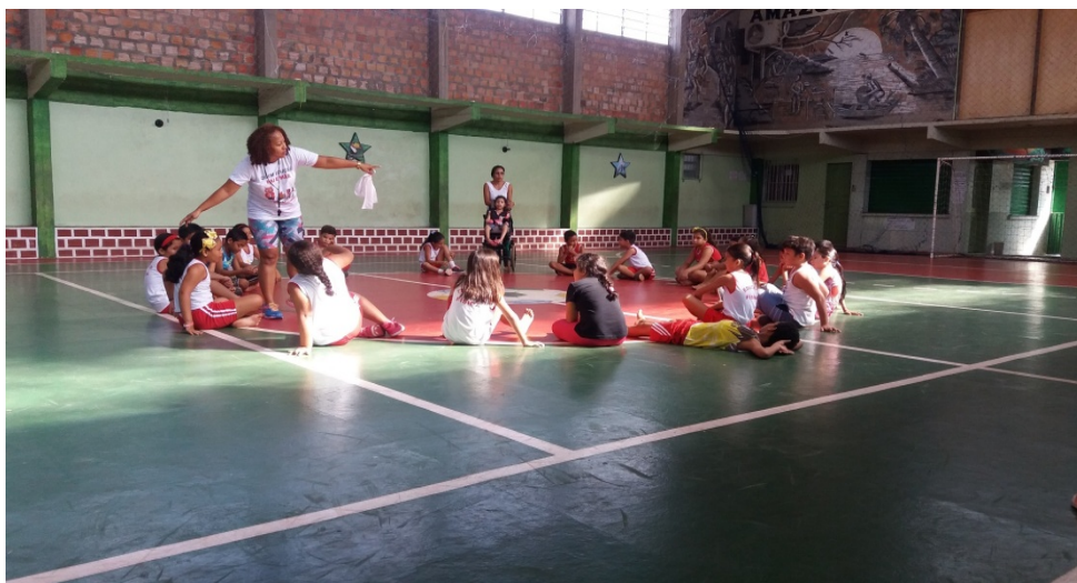
Imagem 4-Quadra poliesportiva do CEPAL

um legado na história, como por exemplo, a sala do segundo ano se chama Amazônia ,temos outras salas por nome Brasil, a sala Ferranti, a sala Pará, uma das paredes da sala Amazônia tem um desenho onde aparecem vitórias-régias.A escola transmite os aspectos históricos e das lendas locais nos desenhos da cobra-grande, entre outros, e ainda possui uma característica diferenciada na forma de Educar o humano. Na entrada da escola tem um espelho grande, sobre o espelho, um dos proprietários do prédio da escola falou que esse espelho é para as crianças se olharem e refletindo se perguntarem a si mesmas quem sou , na construção da identidade, e ao olharem para as demais crianças também se deparem com as diferenças, mas que haja uma aceitação do outro. No teto da escola tem algumas lâmpadas velhas penduradas, além das que estão funcionando, essas lâmpadas, segundo um dos proprietários do prédio da escola possuem um significado e procura transmitir a mensagem que as coisas, assim como as pessoas não perder o valor quando param de ‘funcionar’,ou seja, alguém que perdeu um braço ou uma perna não perde seu valor e não se torna menos humano. A escola passa uma mensagem bastante significativa e se propoe a incluir as pessoas com deficiência. (DIÁRIO DE CAMPO, 2018).