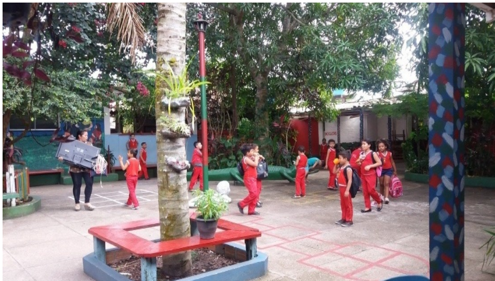
Imagem 6- Alunos no pátio durante o recreio e uma professora carregando a televisão.

corporal também se entrelaça com a linguagem oral, porém é na fala desses alunos que operam uma série de exigências normativas.