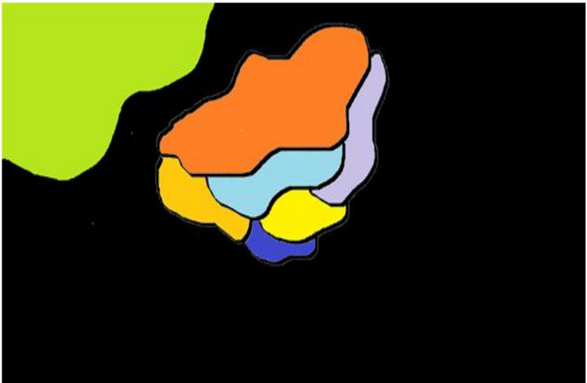
Figura 3 - Estatística conclusiva dos resultados analisados

A consciência, a cidadania, a sensibilização, o formal e o não formal da EA funcionaram como órgãos operacionais ou células, para a sistematização do tema Educação Ambiental. E para representar isso, em uma amostra autoral, em séculos, resenhei uma estatística pessoal em forma de desenho/imagem: