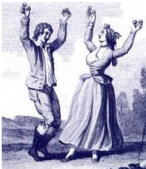
Figura 7: Dança portuguesa

Dos portugueses existe o castanholar dos dedos marcando o timo intenso, o jogo de braços em movimentos constantes no auto da cabeça, a graciosidade nos movimentos mesmo rápidos. A cortesia ao iniciar a dança quando o cavalheiro tira a dama para dançar e ela aceita ou não.