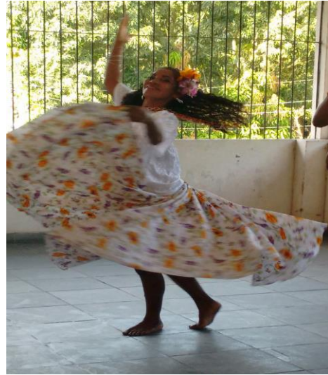
Figura 11: Dançarina jogando a saia