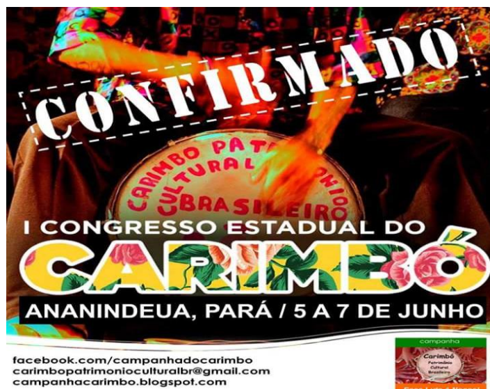
Figura 19: I Congresso Estadual do Carimbó

O I Congresso Estadual de Carimbó aconteceu nos dias 5, 6 e 7 de Junho de 2015, em Belém (PA), na cidade de Ananindeua, no Centro de cultura e formação cristã (Seminário Pio X), na BR 316, Km 6. Região Metropolitana de Belém. Com o objetivo de servir de Fórum deliberativo para a apresentação e encaminhamento das propostas de ações de salvaguarda do carimbó, foram convidados dezenas de mestres e lideranças carimbozeira para o congresso. Por falta de recursos financeiros, matérias para alimentos entre outros produtos o Congresso teve que ser adiado, pois estava previsto inicialmente para acontecer nos dias 15 a 17 de maio. O evento foi organizado desde o final de 2014 pela comissão organizadora da Campanha do carimbó e também com uma mobilização das comunidades carimbozeiras.