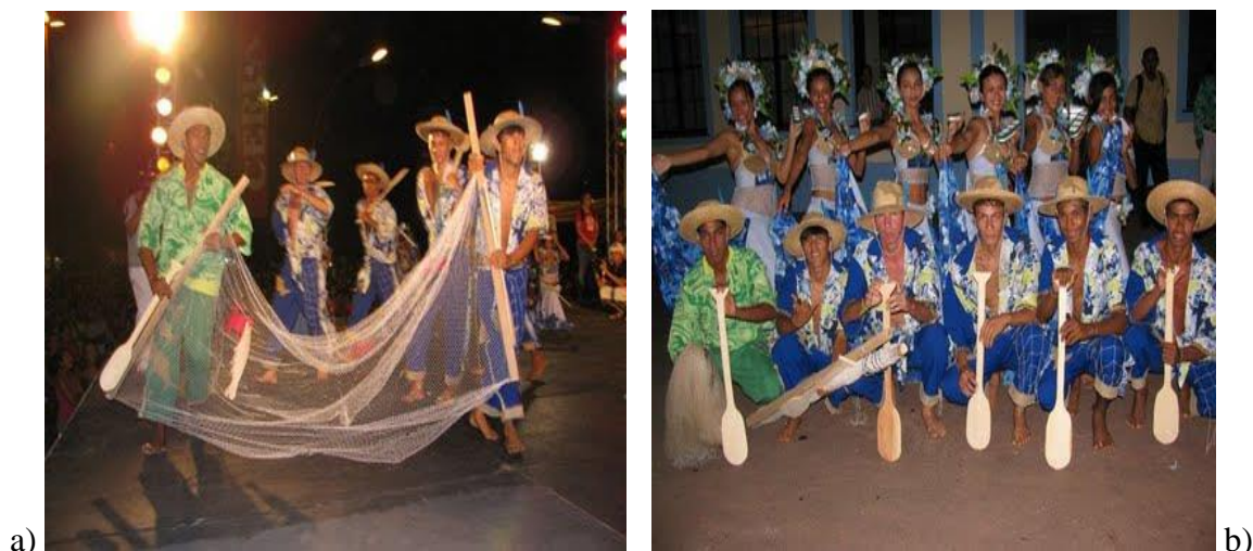
Figura 12: Elementos do cotidiano utilizados na coreografia do carimbó