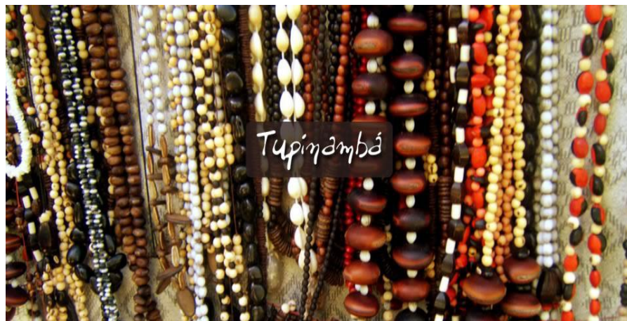
Figura 15: Colares de sementes, uma herança ameríndia.

Nos índios Tupinambás esses conhecimentos de fabricação de artesanatos ainda são passados de geração em geração que hoje em pleno século XXI se mantem firme em algumas tribos, as práticas tradicionais de artes e artesanatos valorização nossa cultura nativa.