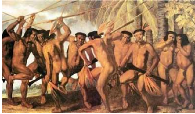
Figura 2: Ritual de caça dos ameríndio