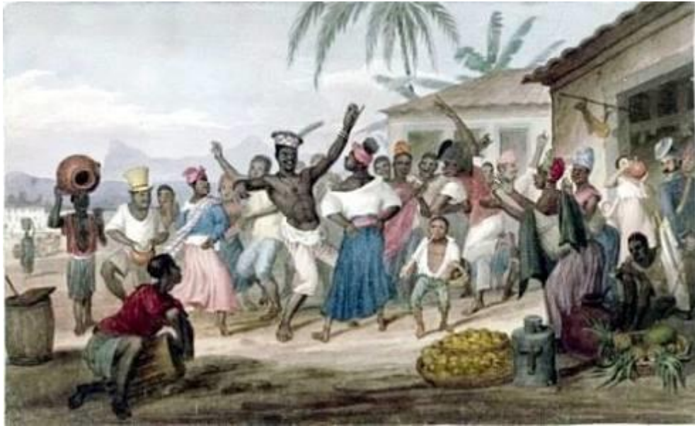
Figura 5: Festejo de negros.