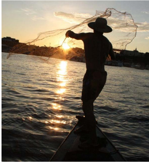
Figura 10: Pescador lançando a rede