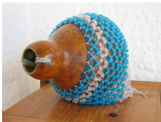
Figura 4: Afoxé 2011.

O tambor é difícil de apontar uma origem, pois desde os primórdios da história do homem, os tambores já acompanhavam o ser humano, serviam como forma de comunicação. Assim como as outras matrizes, os ameríndios também possuem os tambores, e o curimbó acabou originando o nome da dança.