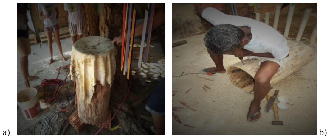
Figura 1: Mestre Lucas 5 , fabricando um Curimbó em uma oficina. 2015 Fonte: Neide Prestes. 2015.

Os próprios mestres, músicos e dançarinos fabricam seus tambores, instrumentos usados. Uma pratica passada de geração em geração.