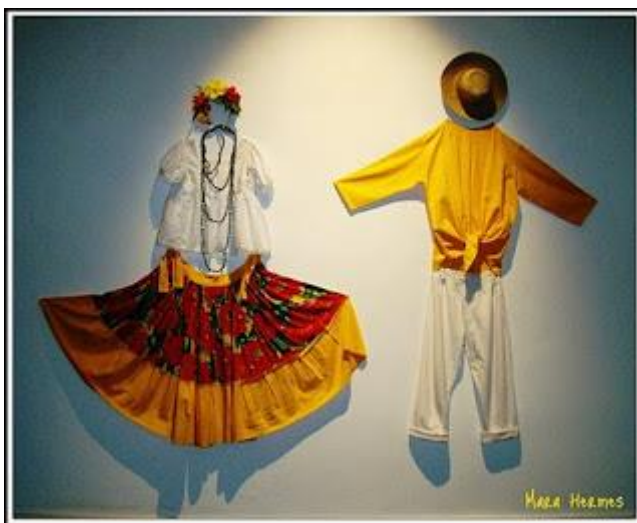
Figura 9: Vestuário da dança do carimbó.

integrar a vestimenta das dançarinas, de cor única, mostrando os ombros e o pescoço, dando assim um ar de sedução.