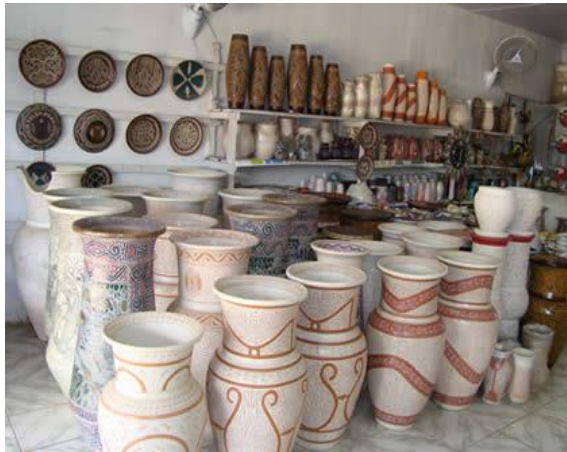
Figura 13: Vasos de cerâmica de Icoaraci