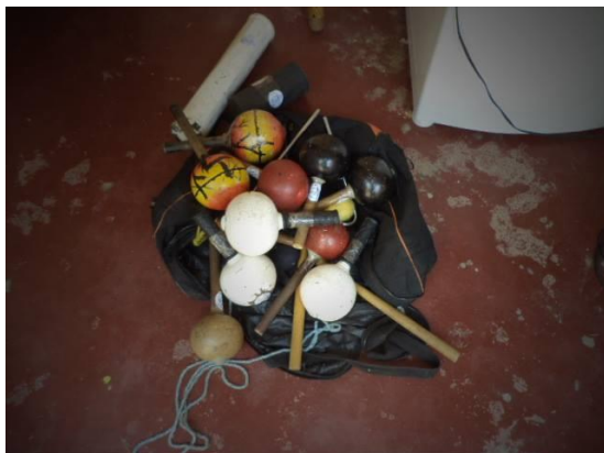
Figura 3: Maracá 2014.