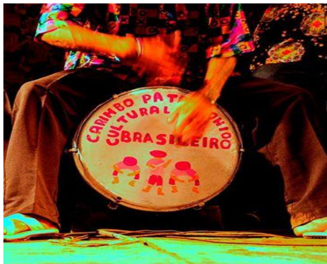
Figura 18: Campanha do carimbó.