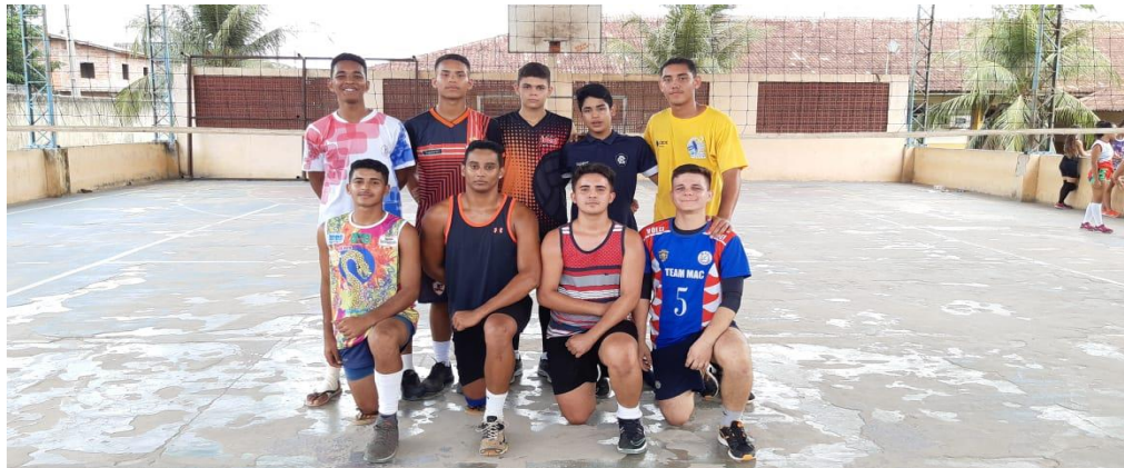
Figura 7 – Quadra Poliesportiva da Escola.

A estrutura física da Instituição Escolar, gira em torno de 6 salas de aula, 1 sala da direção escolar, 1 sala da coordenação pedagógica, 1 sala da secretária escolar, 1 sala de arquivos escolares, 1 sala dos Professores(as), 1 Cozinha, 1 Espaço de Lazer, 1 Sala de Leitura, 1 Laboratório Multidisciplinar, 1 Laboratório de Informática, 1 Auditório, 1 Sala do AEE, 1 Quadra Poliesportiva, 1 Almojarifado, entre outros. Vale ressaltar que a Escola Manoel Antônio de Castro, no contexto do Ensino Médio, é umas das duas escolas apenas oferecendo esse ensino na sede do município de Igarapé-Miri. Por conta disso, a escola apresenta uma estrutura “média” se comparada a sua relevância para a educação no município.