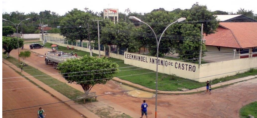
Figura 6 – EEEM Manoel Antônio de Castro (MAC)

A Escola Estadual Manoel Antônio de Castro encontra-se localizada em um dos bairros centrais do referido município, onde se podem encontrar inúmeros prédios públicos nas proximidades. A instituição escolar fica localizada na Avenida Sesquicentenário, nº 25, no Bairro Cidade Nova. A Escola já existe desde o ano 2000, no município, mas só teve suas instalações próprias estabelecidas em dezembro de 2006. O local de construção do prédio Escolar foi desapropriado pelo Governo do Estado, e o projeto de elaboração e execução da obra, veio do Projeto Alvorada do Governo Federal, com parceria do Governo do Estado.