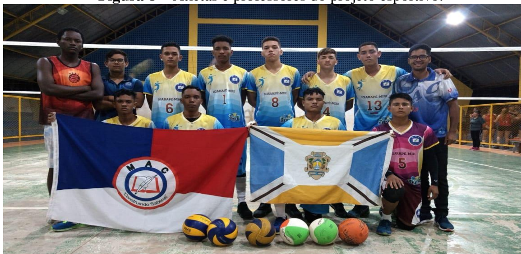
Figura 8 – Atletas e professores do projeto esportivo.

Como o projeto era externo às atividades escolares, existia uma parceria com a Escola MAC, na qual disponibilizava sua estrutura física como: quadra, materiais esportivos e uniformes. Em contrapartida, os responsáveis do projeto acabavam disponibilizando a sua dedicação ao projeto, e o tempo no treinamento da equipe. O projeto era realizado de forma inteiramente voluntária pelos “professores/treinadores”, com o apoio do professor de Educação Física dessa instituição.