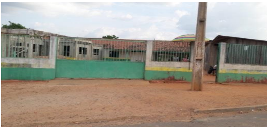
Figura 3: Escola José Andrade Silva, Vila Belo Monte, Anapu, Pará