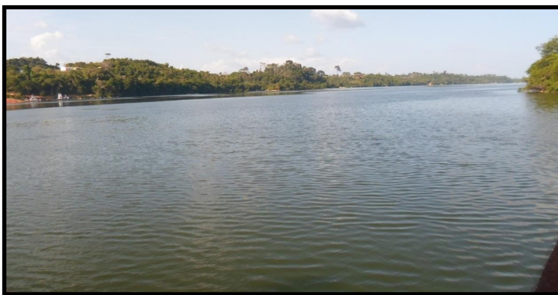
Figura 2: Rio Xingu em frente à Vila Belo Monte

Dentro da vila de Belo Monte passa o Rio Xingu. Esse rio é utilizado pelas comunidades ribeirinhas, pelos agricultores nas lavouras, para matar a sede dos animais, para a pesca artesanal e comercial, lazer nas praias, utilidade doméstica, como por exemplo, lavagem de roupas, vasilhas e outros fins (Figura 2).