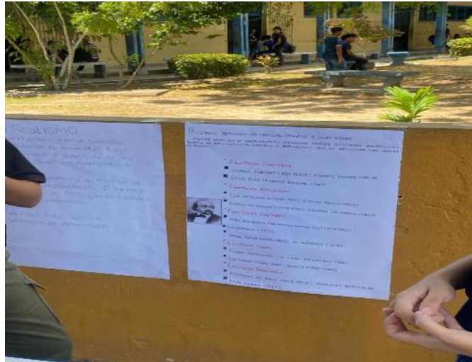
Figura 01 – Projeto Literário promovido por turma do 3º ano do Ensino Médio Integral