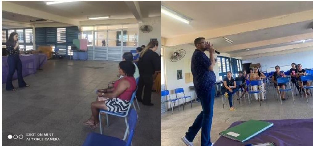
Figura 4 – Diálogo com pais participantes da atividade pedagógica e reunião