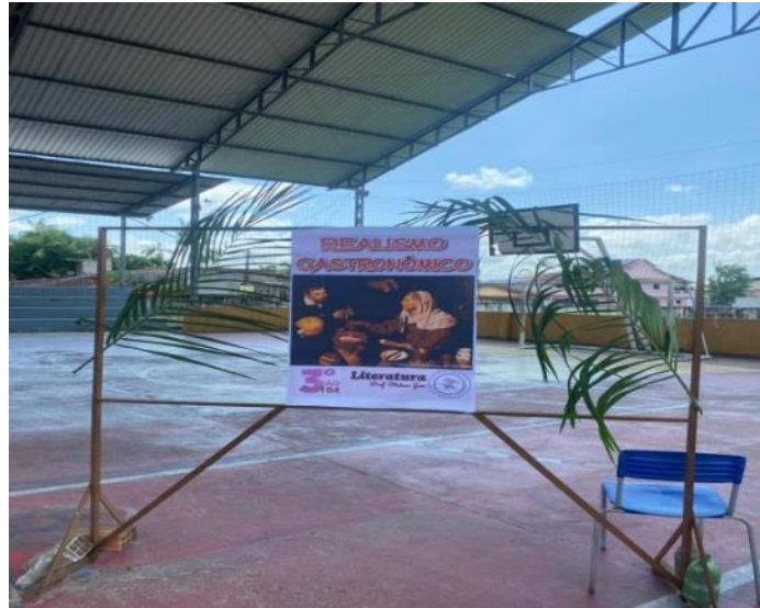
Figura 2 – Circuito Gastronômico