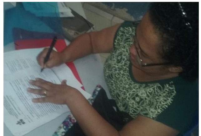
Figura 4: Professora da turma.