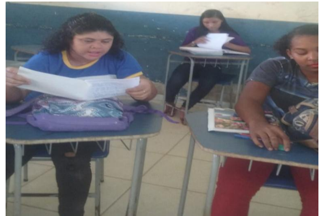
Figura 2: Atividade com os alunos