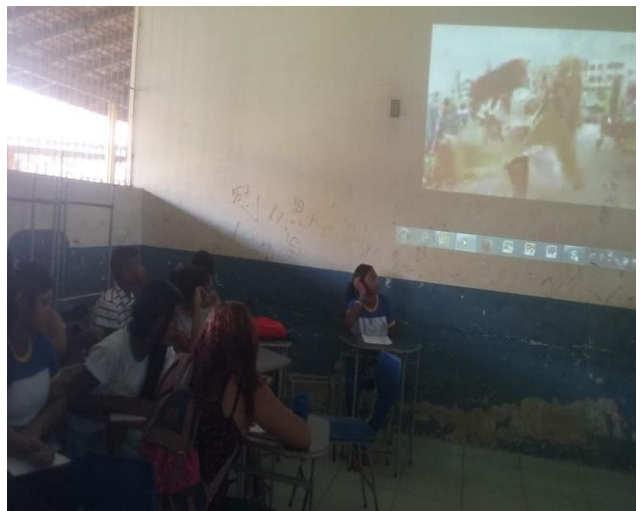
Figura 5 e 6: Aulas Expositivas realizadas durante o período do projeto, Fonte: GONÇALVES, 2018.