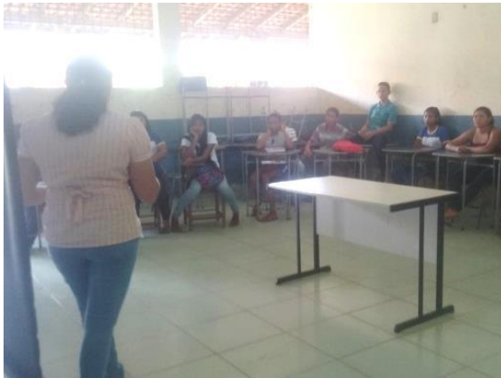
Figura 1: Projeto do 7º ano. Fonte: GONCALVES, 2018.