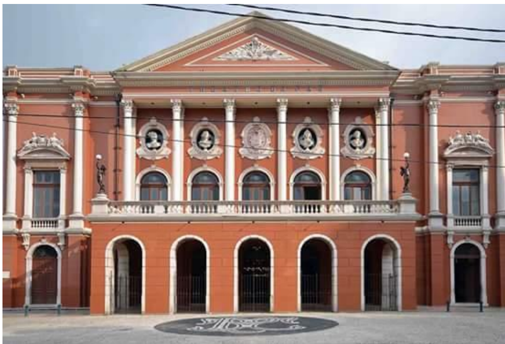
Imagem 9 - Theatro da Paz

O Theatro da Paz foi inaugurado durante a primeira temporada de arte, no dia 15 de fevereiro de 1878, pela Companhia teatral do ator brasileiro Vicente Pontes de Oliveira. Foi o início da divulgação nacional e internacional do Theatro da Paz, considerado um monumento à cultura cênica e musical da época proveniente dos investimentos do Ciclo da Borracha que promoveu no século XIX projetos culturais na região Norte, em especial, nas cidades de Belém e Manaus, trazendo grandes mudanças econômicas, políticas, sociais e culturais. Além disso, importou para a região amazônica os produtos mais sofisticados dos Estados Unidos e Europa.