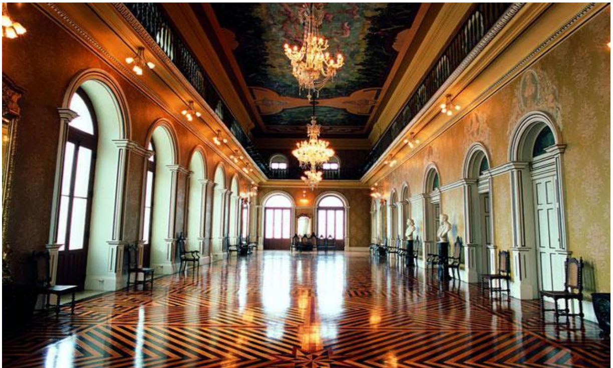
Imagem 12 - Theatro da Paz- Salão Nobre ou Foyer

É importante destacar que um dos espaços mais importantes do Theatro da Paz é o Salão Nobre ou Foyer, pois foi um dos locais mais frequentados pela classe burguesa da época por acontecer recitais, bailes carnavalescos, exposições de obras de arte, abrigar pinturas em estilo neoclássico e barroco, o busto dos renomados compositores da época: Henrique Gurjão e Carlos Gomes, e, além disso, apresentar um mezanino que era utilizado pelos músicos durante os eventos sociais.