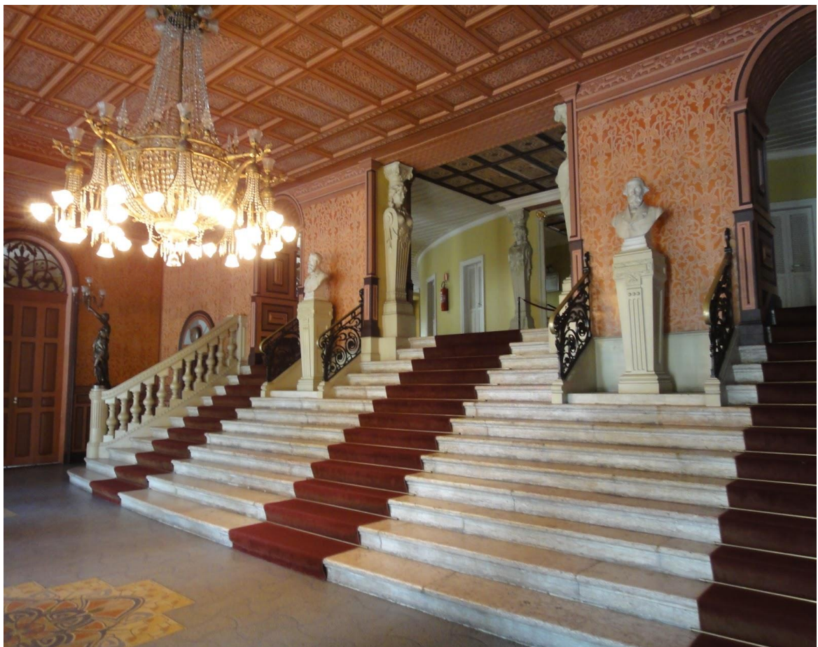
Imagem 10 - Theatro da Paz - Salão de Entrada

A inauguração da nossa primeira casa de espetáculos teve lugar a 15 de fevereiro de 1878, às 8 horas da noite, com o seguinte programa: À chegada do presidente da Província, subiram ao ar muitas girândolas de foguetes e as bandas de música executaram vibrantes marchas. (NOBRE, 1915, p. 171)