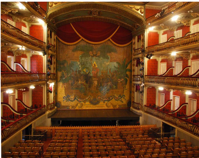
Imagem 11 - Theatro da Paz- Sala de Espetáculos

Em 1880 foi inaugurada a primeira temporada de óperas do Theatro da Paz com a Companhia Lírica Italiana e continuou sendo o local dos principais acontecimentos artísticos e culturais ao abrigar óperas, operetas, dramas, comédias, concertos e recitais. Além disso, de forma especial, também foi palco de cerimônias cívicas somadas às apresentações de festivais beneficentes desenvolvidos pelas Ligas Libertadoras dos Escravos, tornando-se a principal sala de espetáculos de Belém.