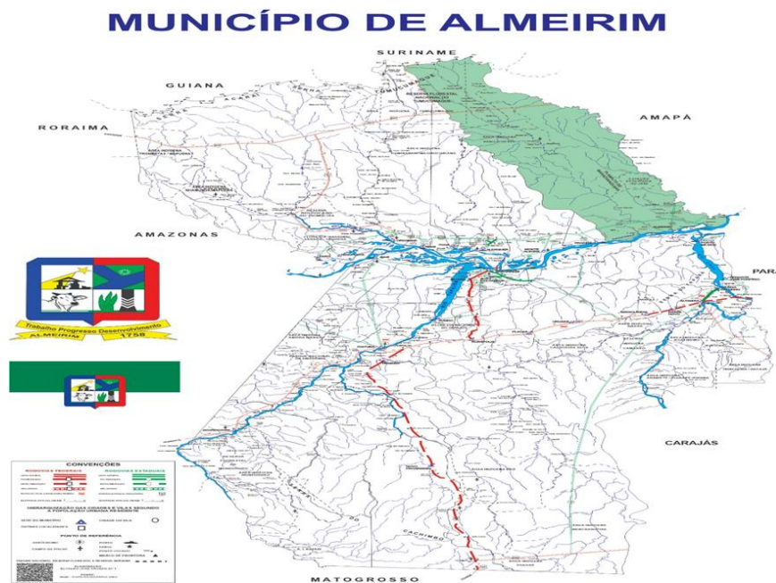
Figura 1 - Mapa do Município de Almeirim