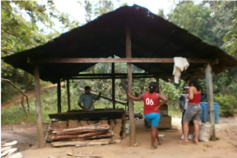
Figura 6 - Casa de Farinha Familiar