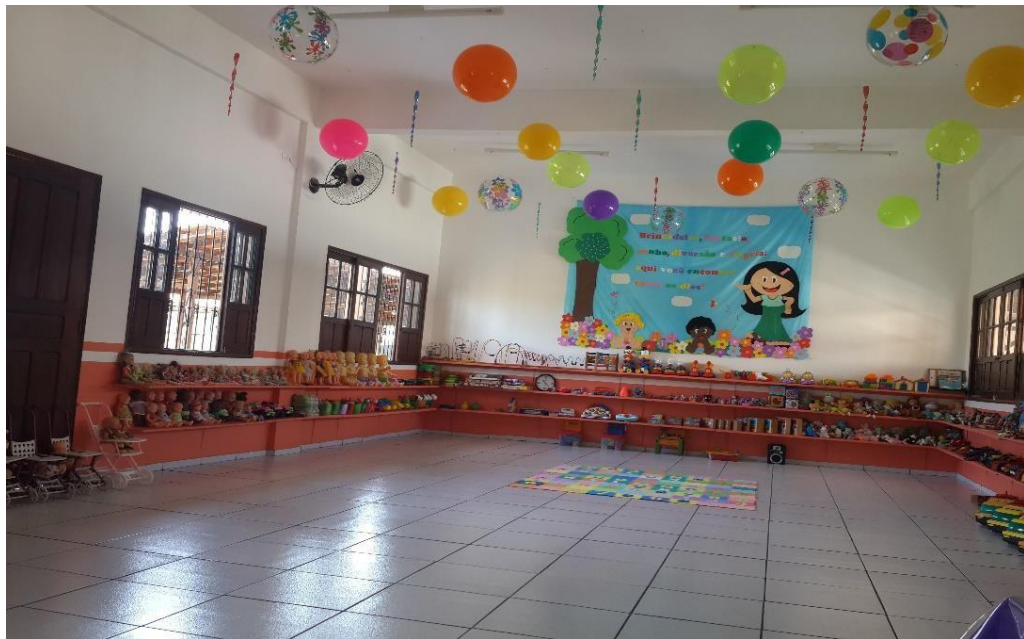
Figura 05: Brinquedoteca da Escola de Educação Infantil Santa Mônica

Ou seja, a Brinquedoteca escolar desenvolve-se na perspectiva de ser uma ferramenta pedagógica e trabalhar com o lúdico, utilizando a brincadeira, o brinquedo e o jogo e assim desenvolver atividades pedagógicas que despertam o interesse da criança e conseqüentemente estimule seu desenvolvimento e aprendizado (CUNHA,2013).