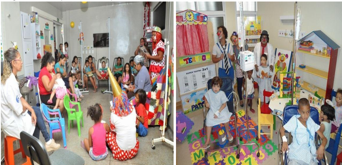
Figura 03: Brinquedoteca hospitalar