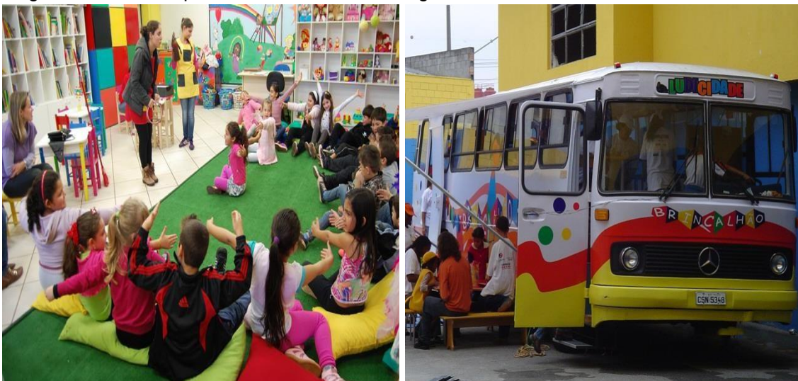
Figura 01 e 02: Brinquedoteca comunitária em lugar fixo e circulando