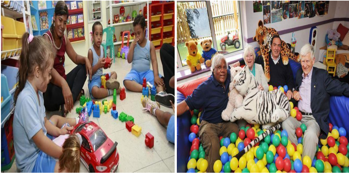
Figura 04: Brinquedoteca especializada terapêutica