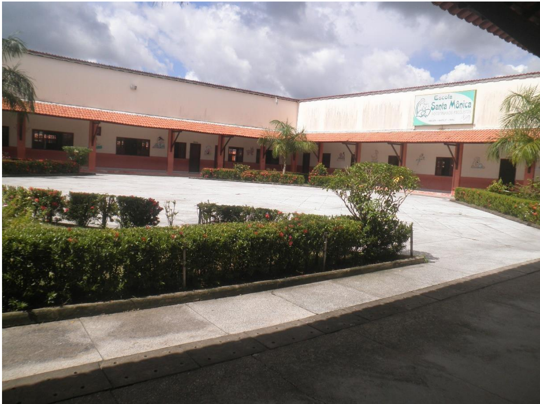
Figura 07: Área da escola de Educação Infantil Santa Mônica

acordo com moradores do Bairro, certa época, a TV Globo exibiu uma minissérie chamada Riacho Doce, que caiu no gosto da população. Por conta do sucesso dessa minissérie os moradores desta área da cidade passaram a chamar parte do igarapé de “Riacho Doce”. Com o tempo todo o bairro ficou conhecido por esse nome.