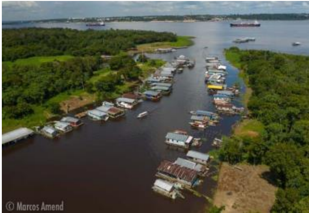
Figura 3. Visão aérea da Comunidade Lago Catalão, Iranduba-AM.