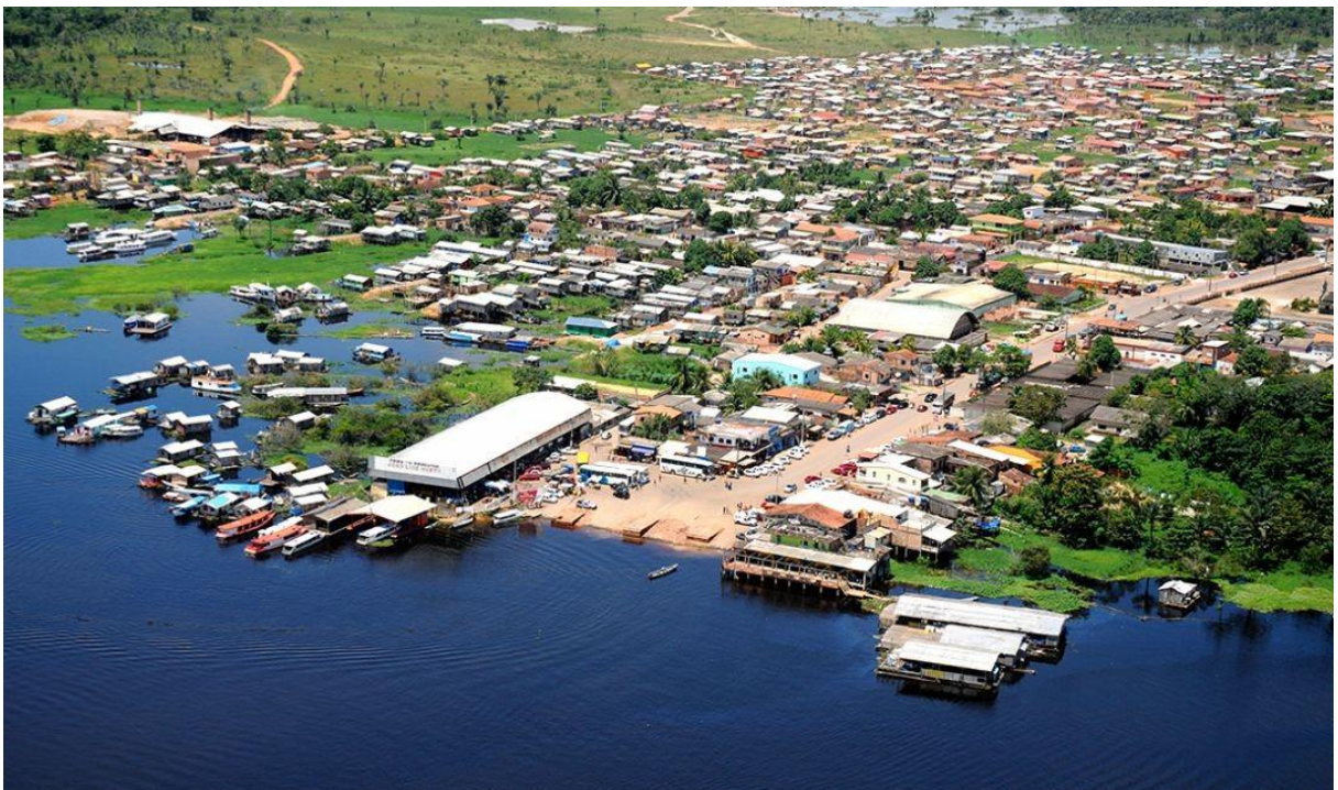
Figura 4. Visão aérea da Sede Municipal, Iranduba-AM.