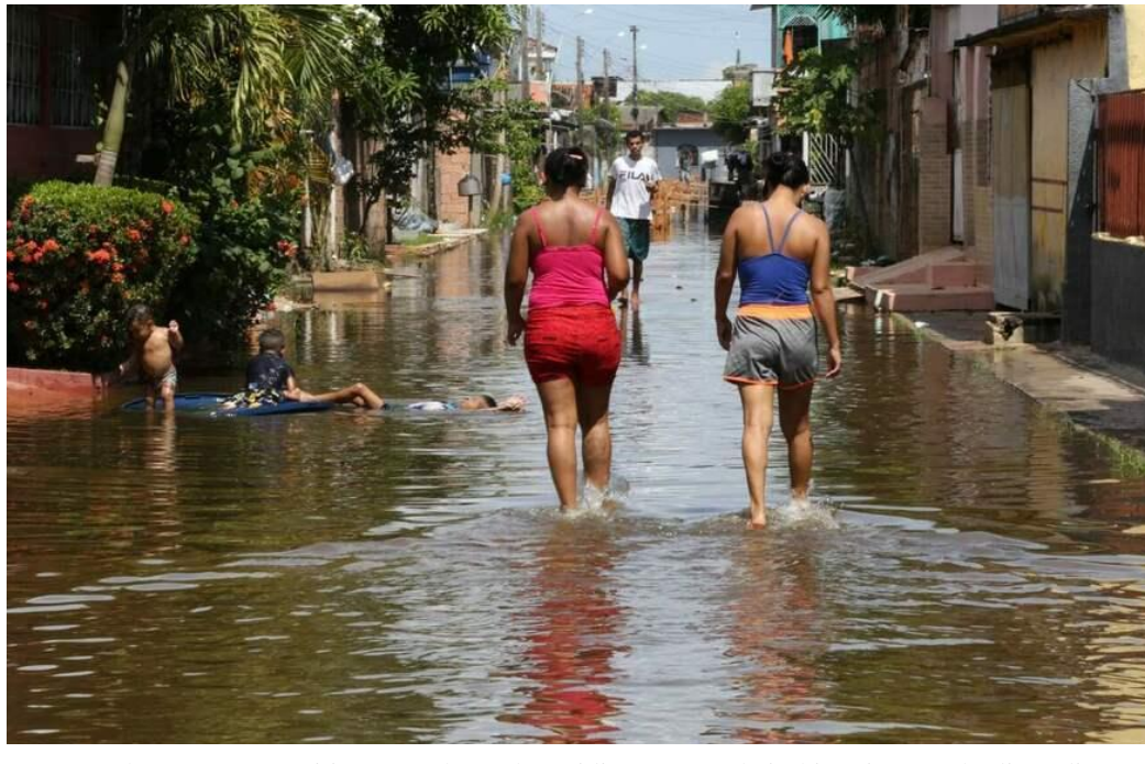
Figura 2. Enchente no Distrito Cacau Pirêra, Iranduba-AM.