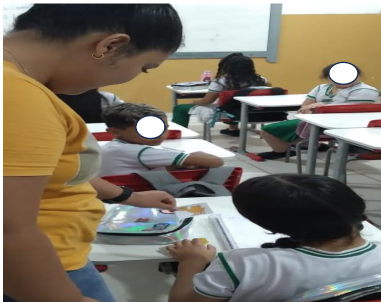
Figura 1 – Atividade do ditado mudo