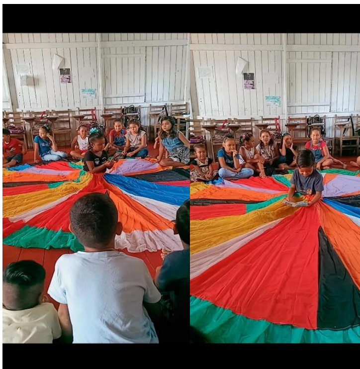
Figura 6 – Futuros leitores lendo sem saber ler antes do futuro chegar.

narrativa. Já com os quase leitores e futuro leitores foi diferente, neste caso eles poderiam usar o livreto para ler as imagens, pois apesar de não lerem palavras, têm uma ampla capacidade de fazer leitura de imagens e criar suas próprias histórias, foi muito divertido e cheio de criatividade esse momento, uma viagem pelo mágico mundo das ideias e dos sonhos.