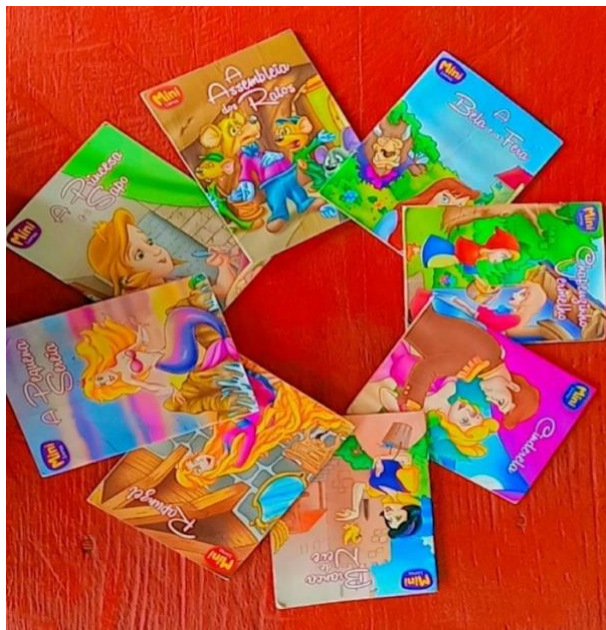
Figura 04: coleções dos contos

Iniciei com os contos clássicos, uma narrativa curta, poucos personagens, número reduzido de ações, que ocorrem em um tempo e espaço, uma coleção de textos adaptados por Cristina Marques que chamou a atenção da maioria no cantinho da leitura, por ser uma coleção de livreto bem ilustrado e interessante de manusear, e poucos deles tinham acesso, alguns chegaram a comentar que já haviam assistido na televisão em forma de desenhos e outros nunca ouviram falar, nem sequer uma das coleções que tínhamos à disposição, e foram conhecendo ali no nosso momento em sala, sendo seu primeiro contato com as coleções literárias.