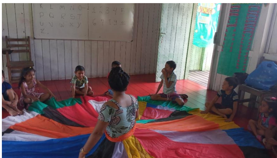
Figura 1 – E o encanto foi tomando conta da imaginação das crianças.

Enquanto seguíamos normalmente em sala de aula, fora dela eu estava finalizando alguns detalhes para dar suporte a este momento em sala, ou seja, para que não fosse lido de qualquer jeito, mas de uma forma vistosa e atrativa, para isto eu estava confeccionando uma espécie de Saia literária, para subsidiar as leituras. Como o nome já diz, era uma saia bem grande colorida feita de material emborrachado, nela estavam variados desenhos relacionados às obras, que já estavam à nossa disposição no cantinho da leitura para ser apreciados por todos, através dos desenhos na borda da saia eles teriam a oportunidade de escolher o que queriam ouvir no momento.