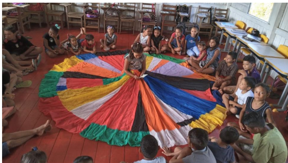
Figura: 3- E o mundo dos sonhos gira na saia literária a colorir o sol da infância.

A saia literária ficava no centro da sala tomando a maior parte de espaço por conta de ser gigantesca, enquanto os alunos a rodeavam sentados na sua borda para ouvir a história do momento, e eu já estava dentro da saia sendo a protagonista do dia, pois cada um ali do menor ao maior em algum momento iria ter a oportunidade de ser protagonista das histórias que seriam contadas.