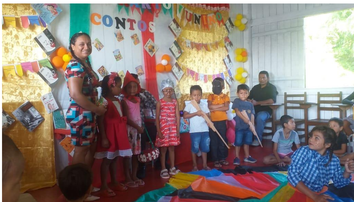
Figura 8 – Chapeuzinho vermelho em cena de teatrinho: na infância, ler é nunca mais esquecer.

Significou muito aquele momento, tanto para mim como professora da turma ao ver a capacidade de evolução rápida que as crianças tiveram, pois segundo eles nunca haviam apresentado algo daquela forma a um público como aquele presente. Também foi