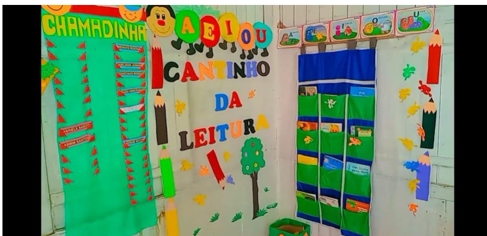
Figura 2 – O cantinho da leitura é um lugar de aconchego, porque para ler é preciso ter sossego.

Todos estes materiais de antemão foram adquiridos com a finalidade de montar um cantinho da leitura na sala, mas também ateliê de artes, para que as crianças pudessem manusear e apreciar as narrativas agora disponíveis.