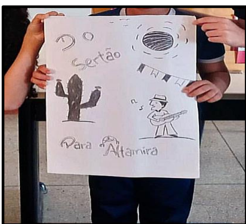
Imagem 1: Do sertão para Altamira