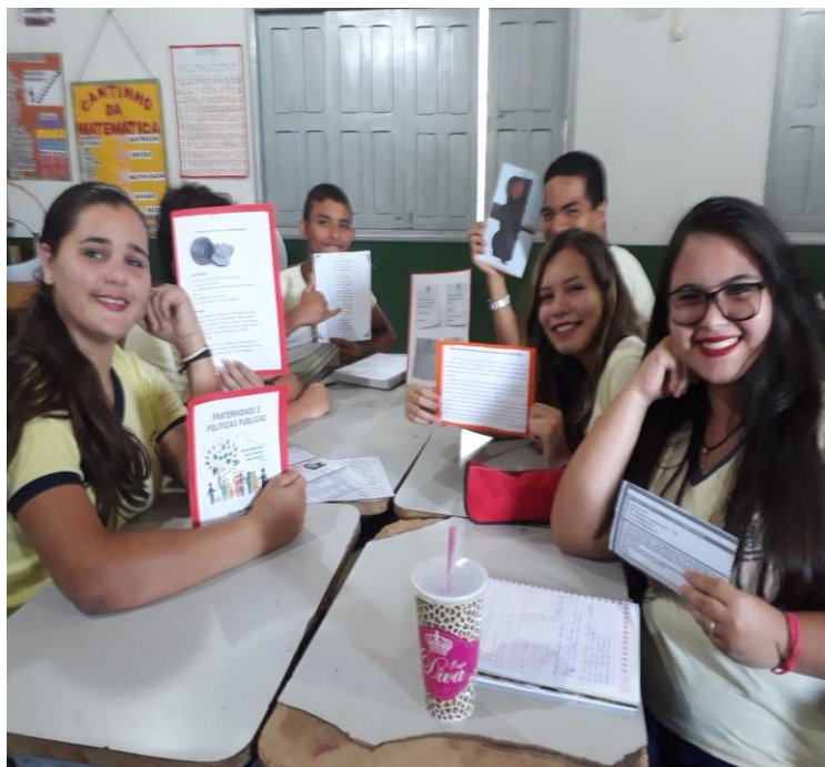
Figura 1 construção de textos literários