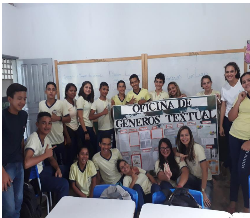
Figura 2 Exposição dos textos no mural