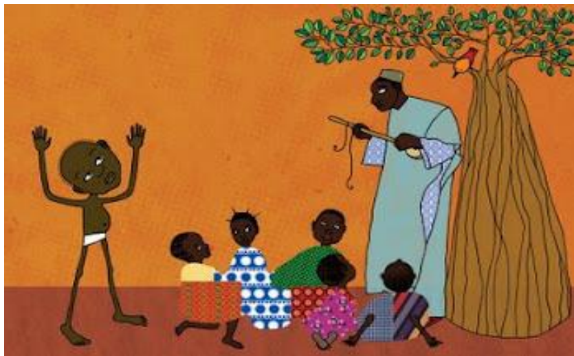
Figura 1 – Imagem de um contador de histórias.

O narrador é um mestre do ofício que conhece seu mister: ele tem o dom do conselho. A ele foi dado abranger uma vida inteira. Seu talento de narrar lhe vem da experiência; sua lição, ele extraiu da própria dor; sua dignidade é a de contá-la até o fim, sem medo (BOSI, 1994, p. 91).