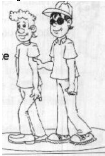
Figura 3 – Guia vidente

Quando durante a caminhada da PcDV com o guia vidente e este precisar avisar que mais a frente a passagem fica estreita e só será possível ir um de cada vez, ele coloca o braço direito para trás, é o sinal para que a PcDV vá imediatamente para trás do seu guia e, assim, seguem até que o espaço se torne livre novamente. Nesse caso, o guia vidente posiciona o braço como estava antes e a PcDV volta para a posição ao lado e um passo atrás.