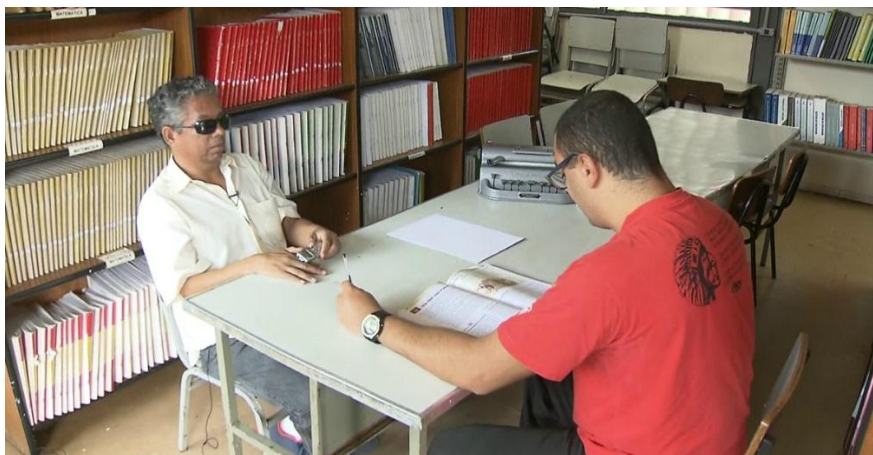
Figura 4 – Leitor

O serviço do leitor inclusivo, que utiliza a sedução de sua voz, para mediar leituras e formar leitores, seria de grande valia que desenvolvesse suas atividades dentro de bibliotecas, salas de leitura, feiras literárias e outros eventos culturais. Sabe-se que este serviço é mais solicitado durante as provas do ENEM, e de outros concursos, pois sendo um direito da PcDV, as instituições responsáveis contratam tais profissionais para esses certames.