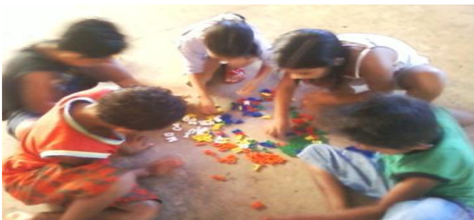
Foto13: Trabalho coletivo

Esse trabalho coletivo estava fundamentado na Tendência Pedagógica Sócio Interacionista quando menciona a possibilidade de novos avanços no campo da Psicologia da Aprendizagem, bem como a revalorização das ideias de psicólogos interacionistas, como Piaget, Vygotsky e Wallon, e a autonomia da escola na construção de sua Proposta Pedagógica, a partir da LDB 9.394/96, exigem uma atualização constante do professor. Através do conhecimento dessas tendências pedagógicas e dos seus pressupostos de aprendizagem, o professor terá condições de avaliar os fundamentos teóricos empregados na sua prática em sala de aula. As fotos a seguir fundamentam estas afirmações.