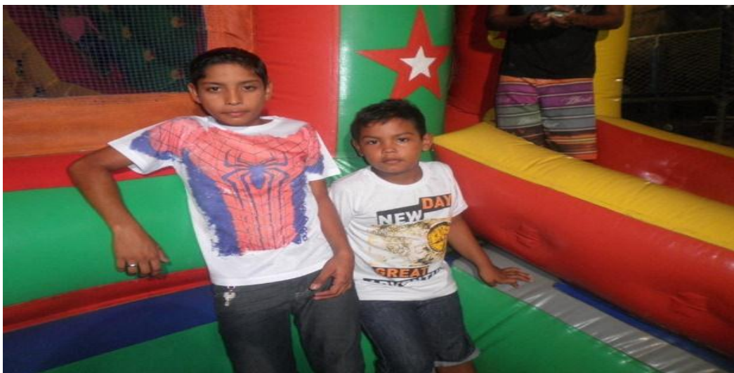
Foto 07- Meus filhos hoje