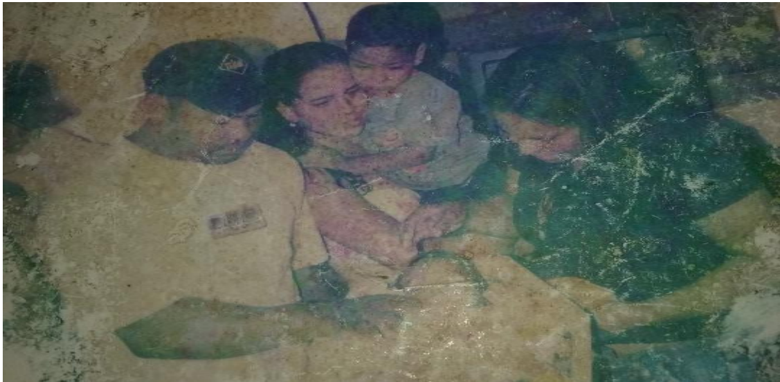
Foto 06- A despedida