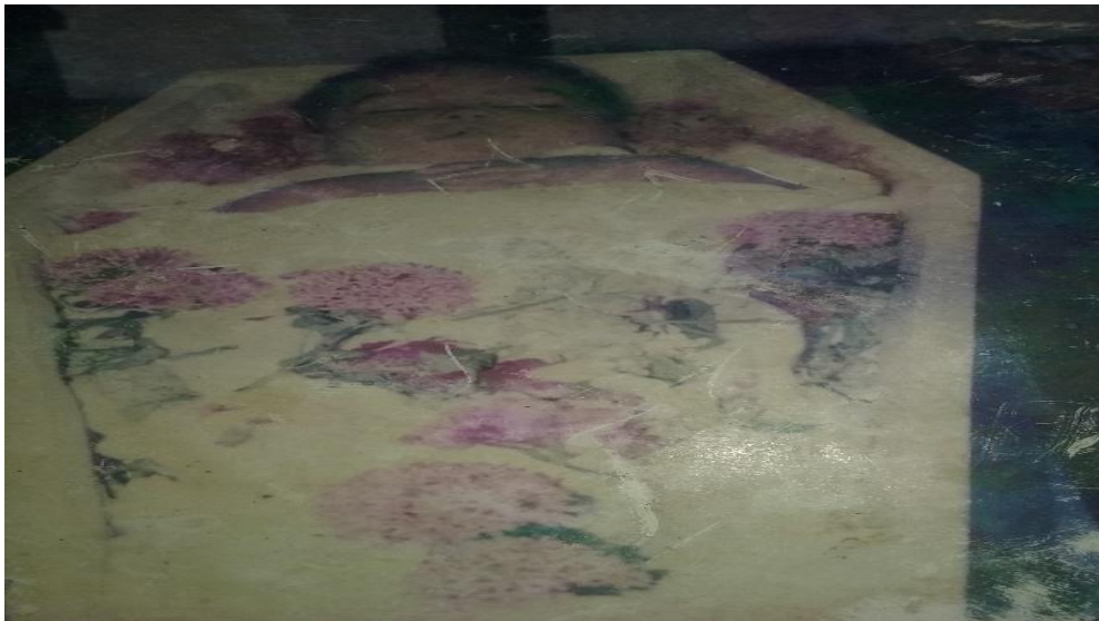
Foto 05- Meu filho morto

A chegada de um táxi com minha mãe e meu filho embrulhado em um lençol me deixou fora de mim, comecei a gritar desesperadamente e abracei meu filho sentindo ele todo gelado e sem cor, comecei a chorar, beijar, abraçar sem solta-lo com uma sensação desesperadora me despedindo com todo amor que uma mãe pode ter por um filho, um pedaço de mim estava indo embora.