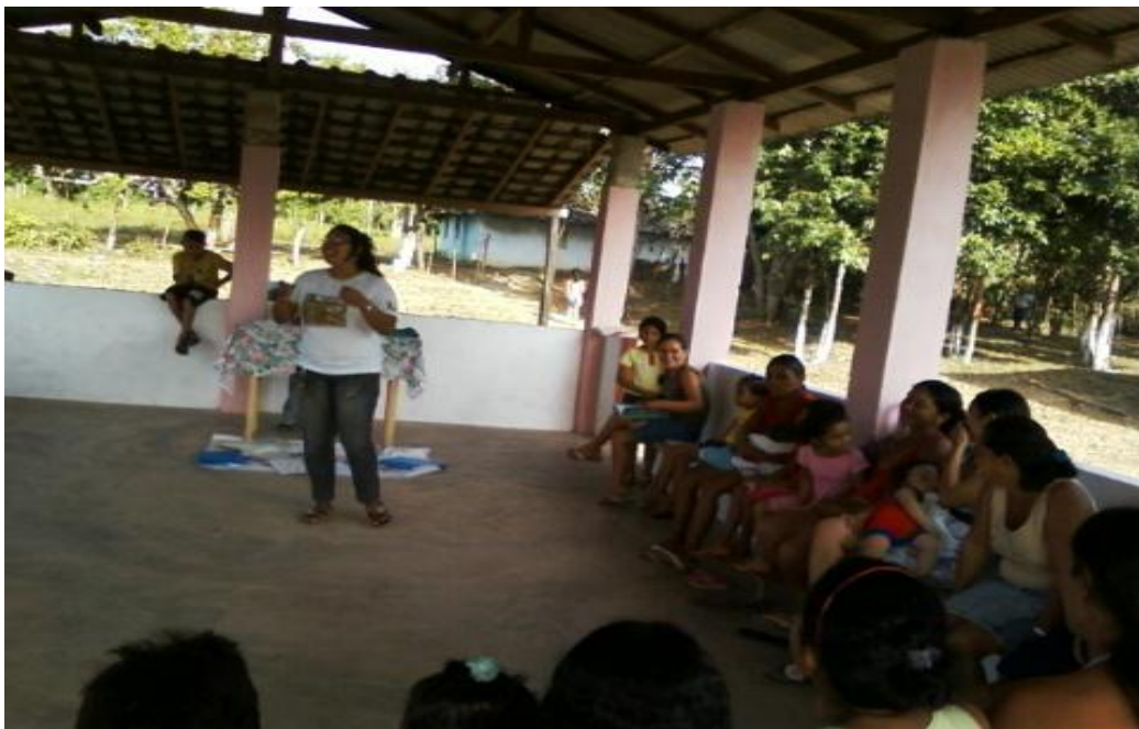
Foto10: Reunião com a comunidade

sabendo que a escola não tinha alunos suficientes para atender duas turmas e logo ficaria sozinha para dar conta de tudo ,resumindo a escola ficou com uma turma de multisserie para atender alunos do primeiro ao quinto ano , eu como responsável da escola ,entrei em desespero, como ia dar conta de tudo, sempre estava inconformada por não dar conta de tudo sozinha, foi então que veio o desafio maior, o município implantou o complexo temático, como a palavra diz, complexo mesmo e o desafio foi maior ainda, pois era algo novo e tudo que é novo é difícil, o complexo nada mais era que trabalhar uma problemática da comunidade através de pesquisas feitas pelos alunos, elencando perguntas e respostas e parti daí elencava-se os conteúdos a serem trabalhados envolvendo as metodologias e culminâncias, me perdi toda, estava eu completamente sozinha em uma escola sendo apenas uma cabeça pensante, com o trabalho de coordenadora, responsável e professora. Meus neurônios queimavam durante toda noite em busca de soluções e organizações para atender a necessidade de meus alunos, pois me colocava como responsável direto pela alfabetização, pelo processo formal de aquisição da leitura e da escrita das crianças no contexto da escolaridade obrigatória e isso me deixava angustiada.