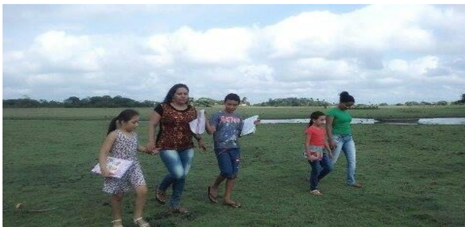
Foto 16: Trabalho pedagógico no campo

Frente a essa realidade, é preciso estar num processo de busca enquanto educador (a), ver crianças crescendo, mudando, aprendendo e evoluindo. Lidamos com gente, com sentimentos, com sonhos, com realizações, com os problemas dos alunos e suas dificuldades, mas sempre buscando desenvolver a autonomia dos alunos e dos professores