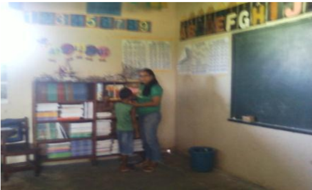
Foto15: Orientação para leitura