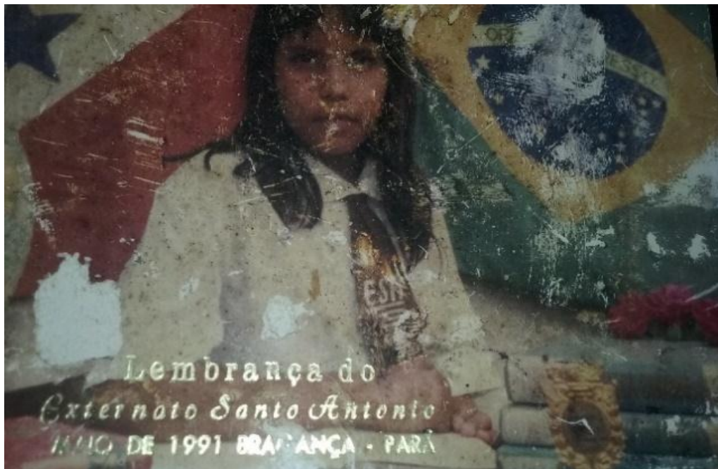
Foto 19: Lembrança da escola Externato Santo Antônio Fonte: Arquivo pessoal - 1991

Lembro –me que quando a professora saia da sala e avisava a todos que ficasse quietos, como poderíamos, na sala tinha um brincalhão que adorava fazer palhaçadas nos divertíamos muito, era só a professora sair que o espetáculo começava mexer com as meninas mais quieta da sala era sua diversão então por causa dele sempre levávamos castigo e a cópia me perseguia pois sempre que acontecia alguma bagunça na sala durante sua ausência, ela mandava copiarmos todos verbos do gerúndio ao infinitivo, fazíamos cópia de tudo, o calo no meu dedo tenho até hoje pois como se não fosse o suficiente minha mãe fazia questão que tivesse um caderno de borrão e ao chegar em casa tinha que copiar toda a aula estudado aquilo era uma tortura para mim- os passava as tardes copiando e não tinha tempo de brincar.