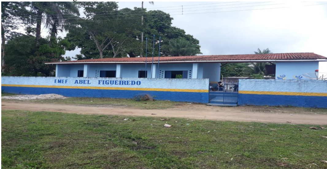
Figura 02- Escola Abel Figueiredo

O prédio da escola foi reformado recentemente, é de alvenaria, com cobertura de telhas de barro, contempla duas salas de aula forradas, iluminação de qualidade, o piso é de lajota, não possui ventiladores, mas dispõem de 4 janelas nas laterais das salas, facilitando a ventilação aos alunos; possui uma cozinha, uma secretaria, dois banheiros, dispõe de um pequeno pátio, e as carteiras são suficientes para atender a demanda de alunos. As fotos abaixo mostram o atual prédio da escola.