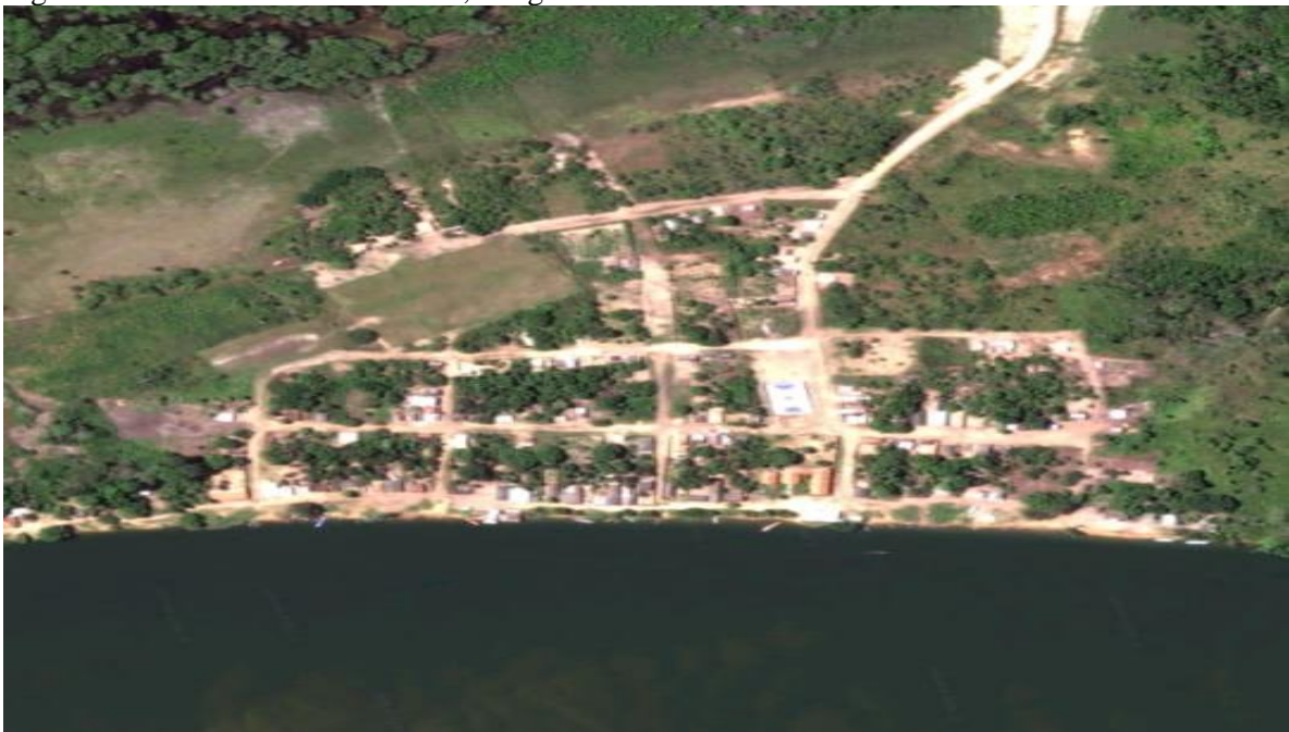
Figura1: Comunidade de Vila Nova, Imagem de satélite