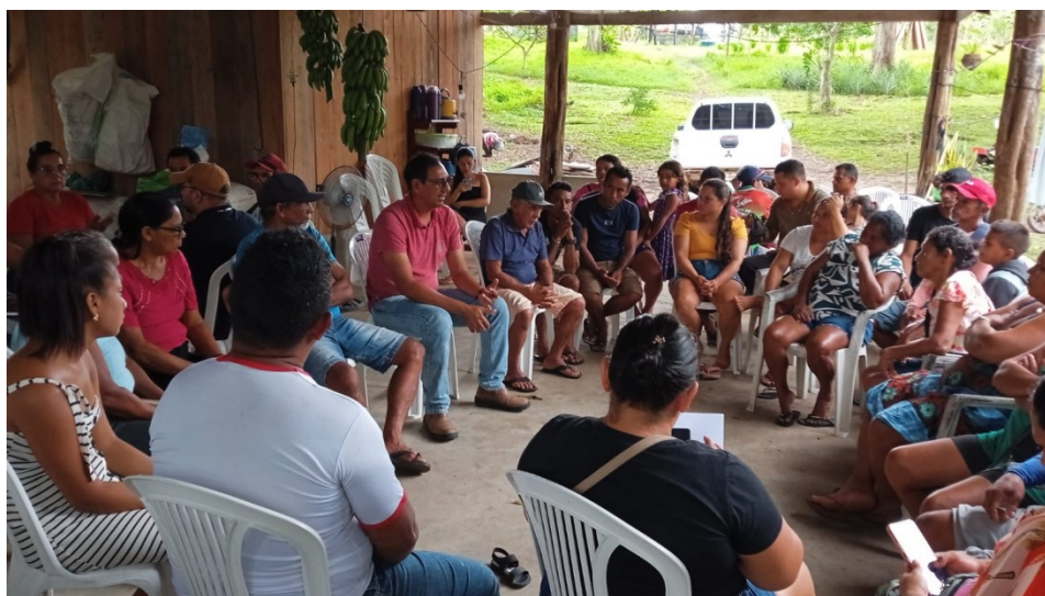
Figura 3. Discussão sobre alternativas produtivas para o Território Quilombola

As organizações têm buscado alternativas produtivas para a diversificação dos sistemas de produção e aumento da renda, fortalecendo as estratégias de resistência (Figura 3). A preocupação é melhorar as condições de vida, e com isso, aumentar a capacidade de resistência do coletivo e de resiliência dos sistemas sócio produtivos, preparando as famílias para lidarem com as adversidades econômicas e produtivas, como as mudanças climáticas, a degradação do meio natural, assim como, ter alternativas para a diversificação dos sistemas agroextrativistas.