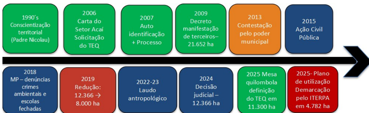
Figura 1. Linha do tempo da criação do TEQ em Porto de Moz.

E com isto, vê-se o alinhamento do ITERPA aos interesses de quem está contrário à definição do TEQ, além de não apresentar proposta para resolver os conflitos fundiários intensificados, e nem se dispõe a restabelecer o direito das comunidades pelas suas terras tradicionalmente ocupadas.