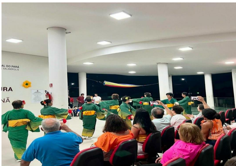
Figura 2 – II Festival Brasil Japão na Casa de Cultura da UFPA, em Salinópolis/PA.