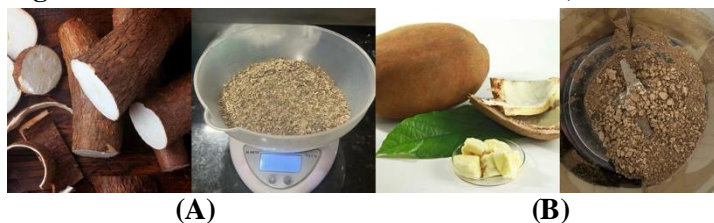
Figura. 1 Aditivos derivados da amazônicas. A) Macaxeira. B) Cupuaçu.

Secagem das Cascas: As cascas foram colocadas em uma área exposta ao sol até que estivessem completamente secas. O tempo de secagem pode variar dependendo das condições climáticas, mas é importante garantir que as cascas estejam completamente livres de umidade.