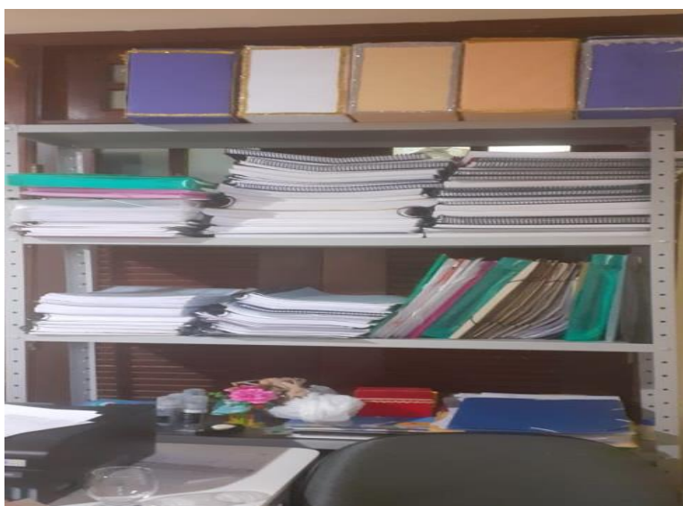
Imagem 2: arquivo da Educação Infantil SEMED (Orientadores Didáticos Pedagógicos).