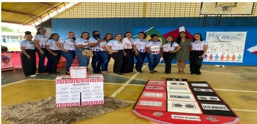
Imagem 1: Registro de formação continuada com foco na cultura local.

Fonte: Imagens do caderno metodológico que da E.I. Formação pedagógica, com foco na cultura local e na ancestralidade do povo marajoara, com professores da E.I 2023).