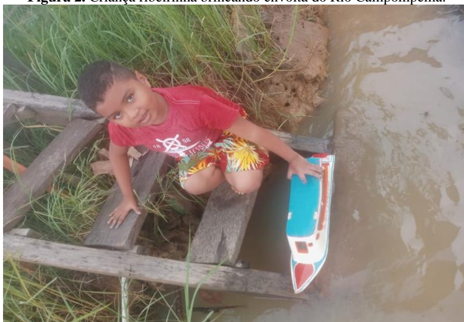
Figura 2. Criança ribeirinha brincando envolta do Rio Campompema.

Algumas crianças desta comunidade, quando estão dentro de casa, brincam de vídeo game, tablete e muitas têm acesso ao celular, o que nas observações realizadas percebemos que elas ficam em inércia ao ter contato com este aparelho. Do mesmo modo, observamos que, durante o dia, suas brincadeiras acontecem sempre envolta do rio, o que comprova que mesmo com os recursos tecnológicos presentes na vida de algumas crianças, elas não se distanciam das brincadeiras tradicionais, como observado na Figura 2.