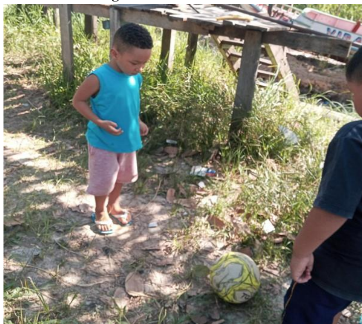
Figura 4. Brincadeira de bola

No primeiro momento da observação no campo, identificou-se que as brincadeiras das crianças do campo não são tão diferenciadas das brincadeiras da criança que brinca na cidade do interior, o que a diferencia é o ambiente em que a criança está inserida. Um exemplo é a brincadeira de esconde-esconde, jogo de bola e peteca, brincades que no contexto ribeirinho é mais enriquecido, pois permite o contato direto das crianças com a natureza, conforme nota-se na Figura 4.