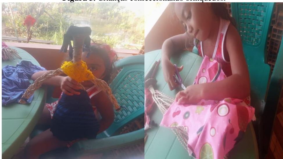
Figura 3. Crianças confeccionando brinquedos.

formas de brincar dentro do ambiente familiar, como constroem brinquedos e brincadeiras com pedaços de madeiras, usam galhos ou folhas de árvore como instrumentos para confecção de brinquedo, estimuladas pelo imaginário infantil, como representado na Figura 3.