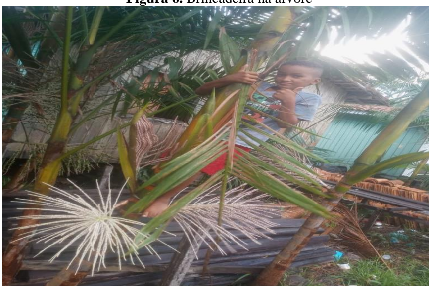
Figura 6. Brincadeira na árvore