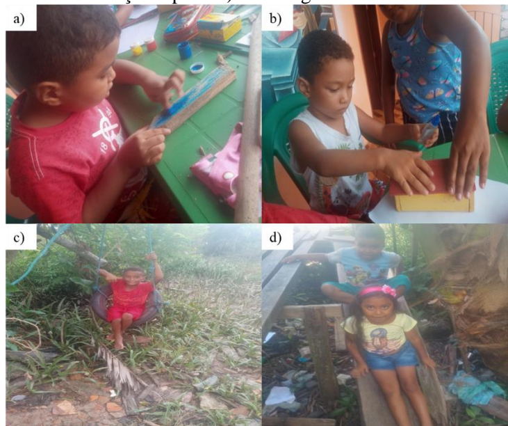
Figura 11. a) Produção de um banquinho de miriti b) Produção de uma casinha de miriti c) Balanço de pneu d) Escorregador de madeira

que na produção de brincadeiras, as crianças usam recursos naturais para fabricação de brinquedos (Figura 11).