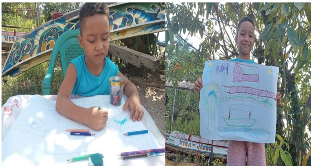
Figura 5. Desenho Livre