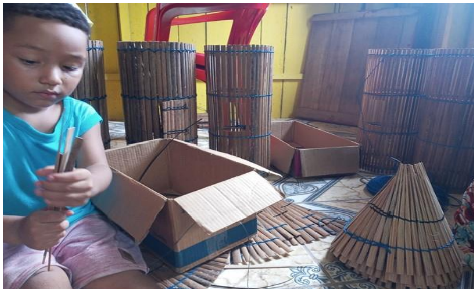
Figura 8. Criança ajudando os pais na construção do matapi.