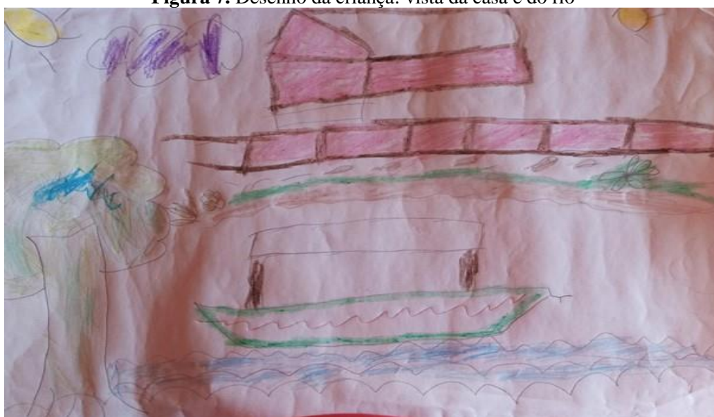
Figura 7. Desenho da criança: vista da casa e do rio

Além disso, para completar a tarefa de desenhar, o menino desenha um terreiro (quintal), com folhas e flores e relata que gosta muito de se sujar com a terra, pegar folhas secas e fazer bolinhas de barro mole, para brincar com seus primos, enfatiza ser “muito divertido” (Cebolinha 4 anos, 2021). Na mesma atividade, o menino desenha o rio e uma canoa dizendo que sua maior alegria é a hora do banho, porque pode brincar de pira - pega na água com seus primos e primas, pois é o momento em que ele coloca o matapi com seu pai para pegar camarão. Para completar, ele desenhava a sua casa, a ponte e o céu, expressando gostar de empinar pipas em cima da rabeta e na ponte (Figura 7).