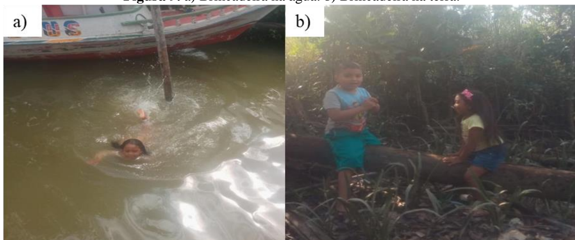
Figura 9. a) Brincadeira na água. b) Brincadeira na terra.

Da mesma importância, o brincar com água vira festa, vira alegria, com divertidos mergulhos, competição de natação e pira d'água. Ressaltando que a criança que mora perto de rios aprende a nadar muito precocemente, dependendo do estímulo, ela aprender a nadar entre 4 a 5 anos de idade. O brincar no ar coloca o corpo da criança em movimento com o empinar de uma pipa e soprar bolhas de sabão. Do mesmo modo, a imaginação também ganha asas com capa de super-herói ao vento. Para Freitas et al. (2021, p. 14), “o imaginário infantil, movido pela tríade terra, água e floresta, desvela uma criança criativa e inventiva, veleando-se dos elementos da natureza, para poder sobreviver as agruras de seu cotidiano”.