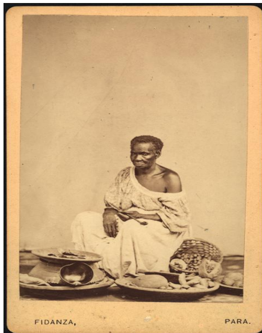
Imagem 6: vendedora de frutas

Vendedora de frutas no Pará. Pará, 1869.