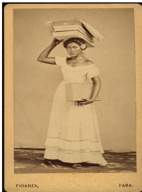
Imagem 7: Com detalhes da cruz e dos pés calçados

Fotografia de Felipe Augusto Fidanza. Pará, 1869-1875. Com detalhes da cruz e do pé calçado. Disponível em: https://brasilianafotografica.bn.gov.br/brasiliانا/handle/20.500.12156.1/4517 acesso em: 07/01/2023