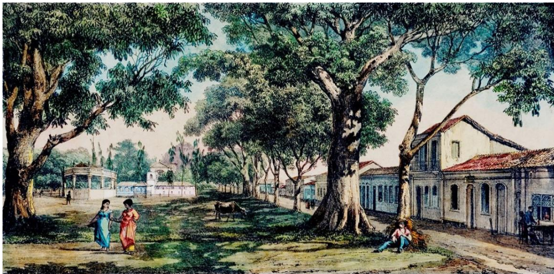
Litografia 3: Largo de Nazaré

Fonte: Giuseppe Leoni Righini, Largo de Nazaré, atual Praça Santuário, litografia. Centro de Memória da Amazônia. Disponível em: https://www.cma.ufpa.br/galeriarighini.html