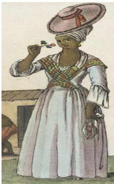
Desenho 1: Mulher euro-africana

Mulher euro-africana. 179. Fonte: Los Angeles County Museum of Art. [Sítio Institucional]. Disponível em: https://collections.lacma.org/node/208521