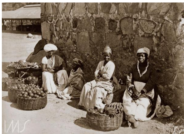
Imagem 3: Quitadeiras

Quitadeiras. Ferrez, Marc. 1875. Instituto Moreira Salles. Disponível em: https://brasilianafotografica.bn.gov.br/brasiliana/handle/20.500.12156.1/2043