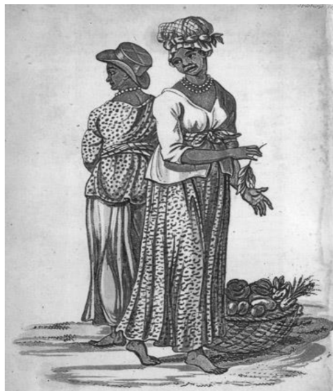
Desenho 2: Mulheres de Serra Leoa

Mulheres de serra Leoa (1805)