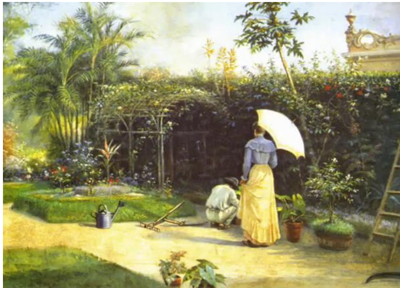
Tela 2: recanto de jardim

Benedito Calixto. Recanto do jardim. 1906. Disponível em: https://mabe.belem.pa.gov.br/acervo/