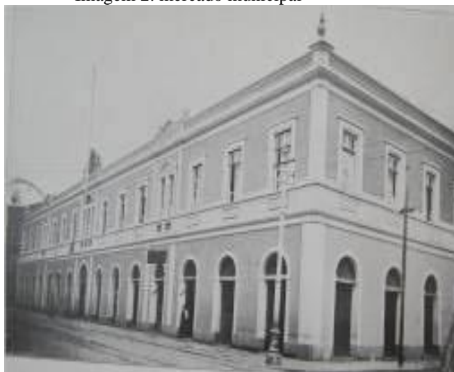
Imagem 2: mercado municipal

Mercado Municipal reformado.