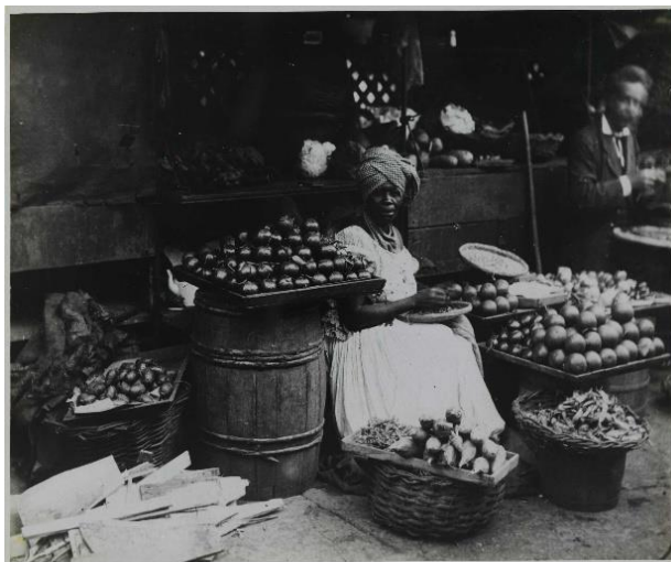
Imagem 4: Vendedora ambulante

Fonte: Vendedora ambulante, 1875. Marc Ferrez. 1843-1923. Biblioteca Nacional Digital.