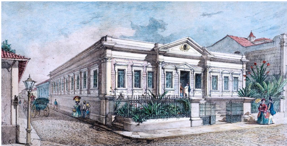
Litografia 2: Banco Comercial

Fonte: Giuseppe Leoni Righini. Banco comercial , litografia. Centro de Memória da Amazônia – UFPA. Acesso em: https://www.cma.ufpa.br/galeriarighini.html