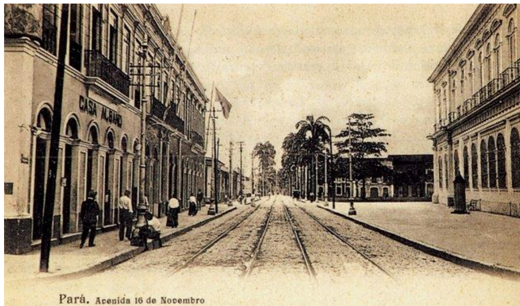
Imagem 1: Avenida 16 de Novembro

Fonte: Avenida 16 de Novembro – lateral do Palácio da Intendência (atual MABE). Disponível em: https://artepapaxibe.wordpress.com/fotos-belem-antiga/