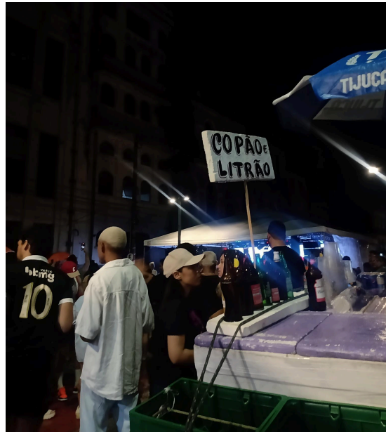
Figura 7 - Divulgação do Copão