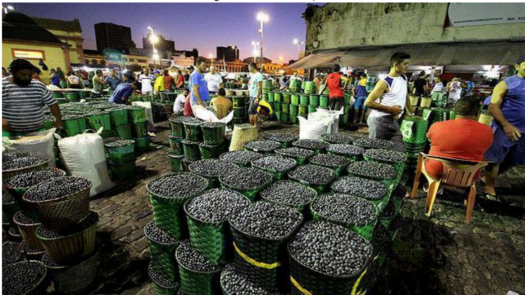
Figura 2 - Feira do açaí

Um aspecto interessante à respeito disso é que ambos os locais estão localizados no mesmo bairro, a 1,1 km de distância, mas o contexto ao seu redor é bastante distinto. Essa diferença, de certa maneira, afeta a forma como as pessoas percebem e recebem essa mudança de local. A Feira do Açaí é um espaço de grande atividade laboral, com o descarregamento do açaí das embarcações, e seu público é, em sua maioria, composto por pessoas de classes sociais mais baixas. Por outro lado, o Boulevard da Gastronomia, situado próximo à estação das docas, é um ponto de intensa movimentação turística e atrai, em geral, visitantes de classes sociais mais elevadas.