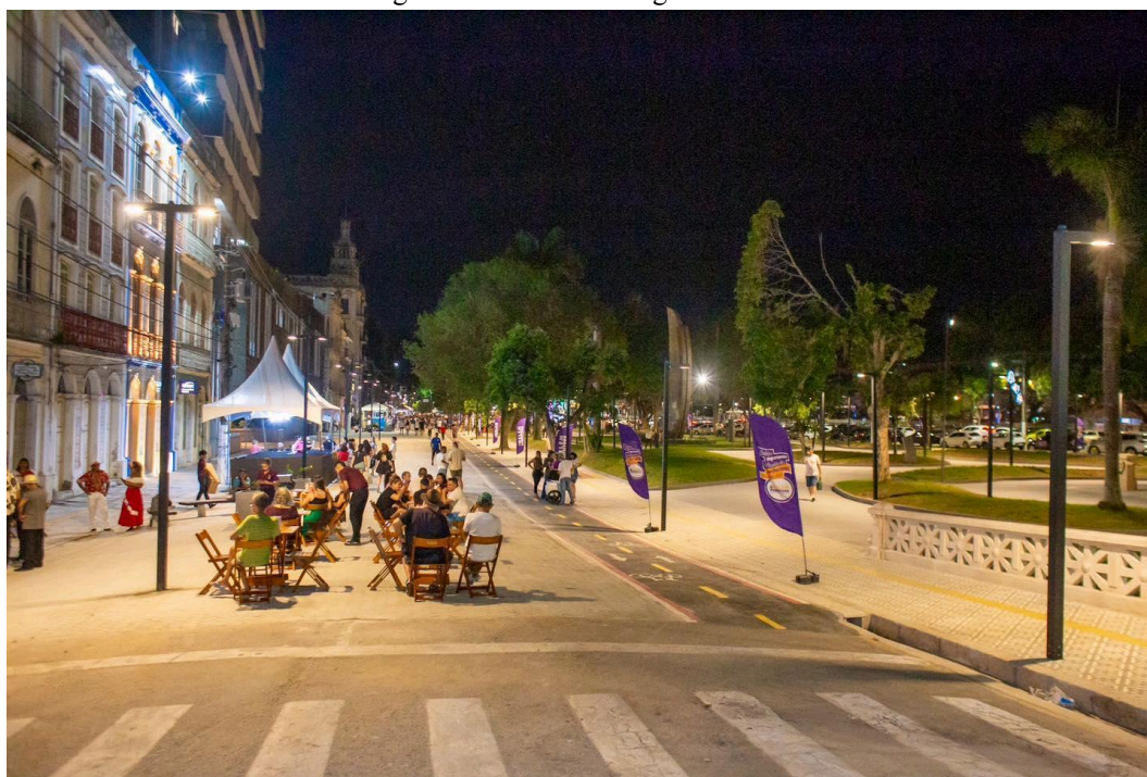
Figura 1 - Boulevard da gastronomia

diferentemente da feira, o Boulevard da Gastronomia é um amplo calçadão repleto de restaurantes e praças ao longo de seu percurso.