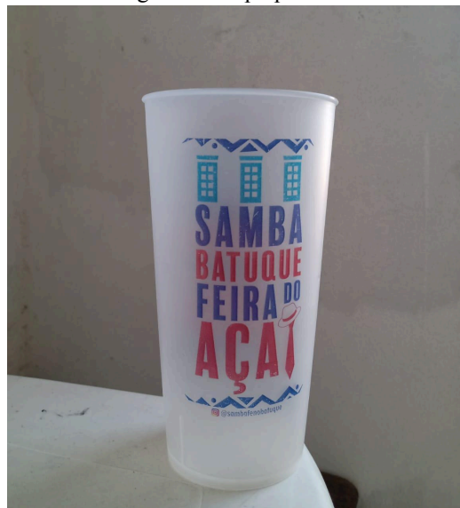
Figura 5 - Copo personalizado

Ao criar esses produtos personalizados, as ambulantes exercem o que Pierre Bourdieu (1974) chama de "capital simbólico", que envolve não apenas a produção material, mas também a construção de uma imagem e de um valor social que vai além da simples transação comercial. A capacidade de gerar identificação e pertencimento por meio de itens como camisas e copos se relaciona diretamente com a formação de uma comunidade cultural, em que o consumo desses itens também carrega um significado simbólico para os frequentadores do samba.