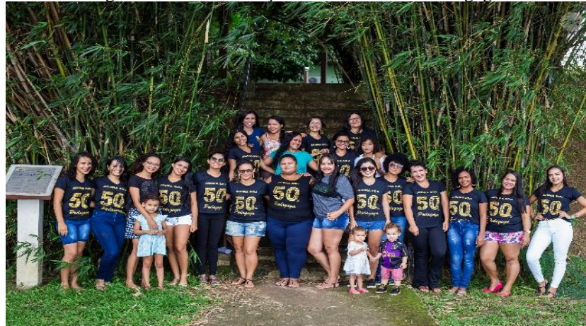
Figura 22 – Comemoração 50% do curso de Pedagogia