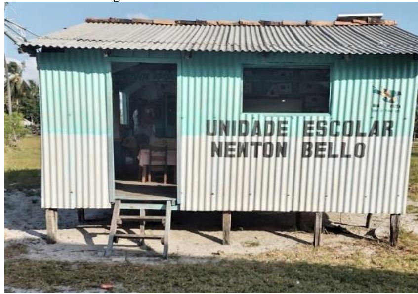
Figura 4 – Unidade Escolar Newton Bello