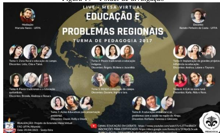
Figura 19 – Folder de divulgação