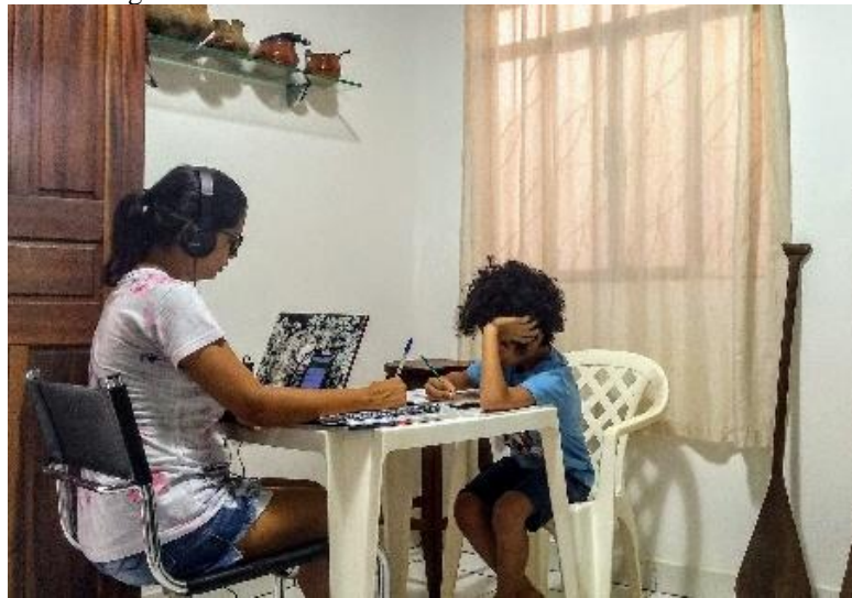
Figura 23 – Eu e meu filho em momentos de aula online

Tive que colocar a futura pedagoga para trabalhar antes de concluir a formação, pois embora as professoras passassem o conteúdo, os pais tinham que orientar os filhos a fazer as atividades, foi um grande aprendizado nesse período.