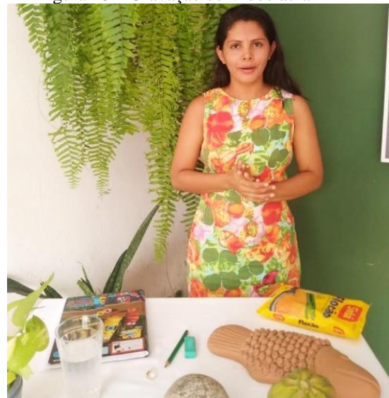
Figura 18 – Gravação de Vídeo aula