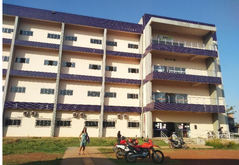
Figura 6 – Prédio multidisciplinar, Campus Universitário de Altamira