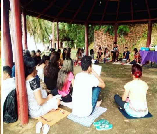
Figura 9 – Disciplina de Introdução a Educação