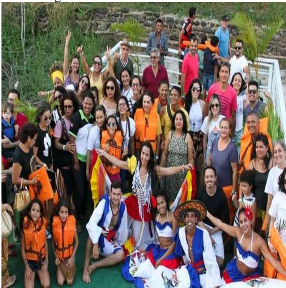
Figura 20 – Evento cultural Sarabalsa

Houve grandes eventos em que participei como comissão organizadora como a Feira Literária Internacional do Xingu (FLIX), as duas temporadas no evento cultural Sarabalsa (Figura 20) e na Feira Vocacional no estande do Curso de Pedagogia, na qual gostava de explicar sobre o curso e a importância do mesmo para a educação, eventos como organização de palestras, ministrar oficinas pedagógicas durante o período do curso foram de grande importância para minha formação.