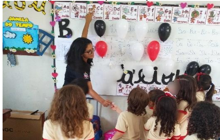
Figura 14 – Intervenção na Educação Infantil