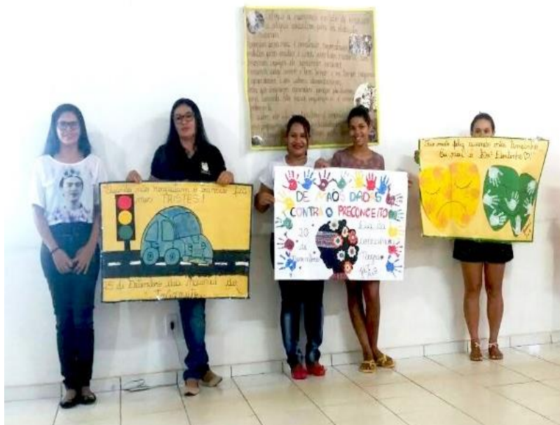
Figura 15 – Didáticas usadas nos cartazes

O professor medeia a relação ativa do aluno com a matéria, inclusive com os conteúdos próprios de sua disciplina, mas considerando o conhecimento, a experiência e o significado que o aluno traz a sala de aula, seu potencial cognitivo, sua capacidade e interesse seu procedimento de pensar seu modo de trabalhar. (LIBÂNEO, 1998, p.29).