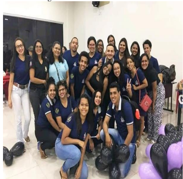
Figura 21 – Amizades construídas