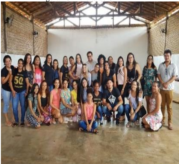
Figura 10 – Visita ao SINTEPP

Nessa disciplina tive a oportunidades de fazer visitas técnicas (Figuras 10 e 11) que visam o encontro do acadêmico com o universo profissional. A realização destas visitas foi de extrema relevância, pois foi possível observar o ambiente real de uma instituição em pleno funcionamento, além de ter sido oportunizado verificar aspectos teóricos e práticos que regem esses contextos.