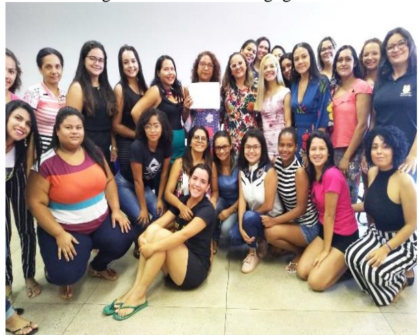
Figura 13 – Turma Pedagogia 2017