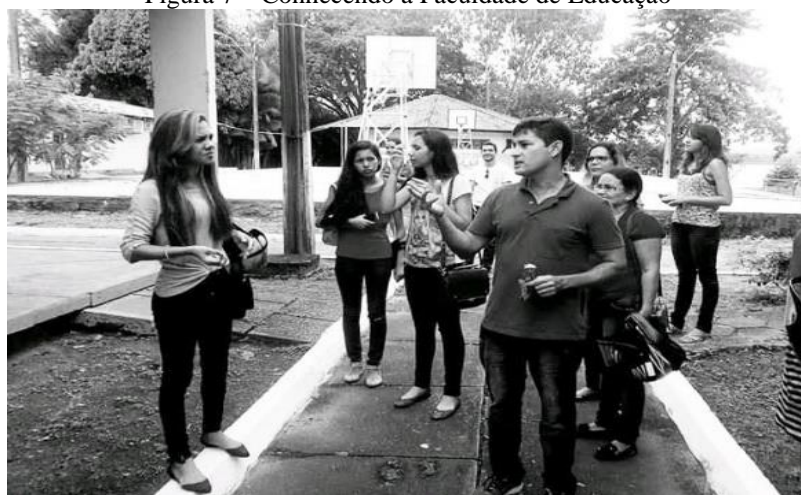
Figura 7 – Conhecendo a Faculdade de Educação

Em fevereiro de 2017, aconteceu a semana de integração dos calouros na universidade. Particpei com muita empolgação em todos os dias. Nessa mesma semana, acompanhados pelo diretor da faculdade, fomos conhecer o Campus I (Figura 7), onde fica localizada a Faculdade de Educação. Esse momento foi muito importante para ir conhecendo as colegas de turmas ali presentes, assim como, para conhecer os espaços da faculdade e da universidade como um todo: salas dos professores, salas de aula, direção, laboratório, espaços de convivência e outros locais que seriam a minha segunda casa por quatro anos.