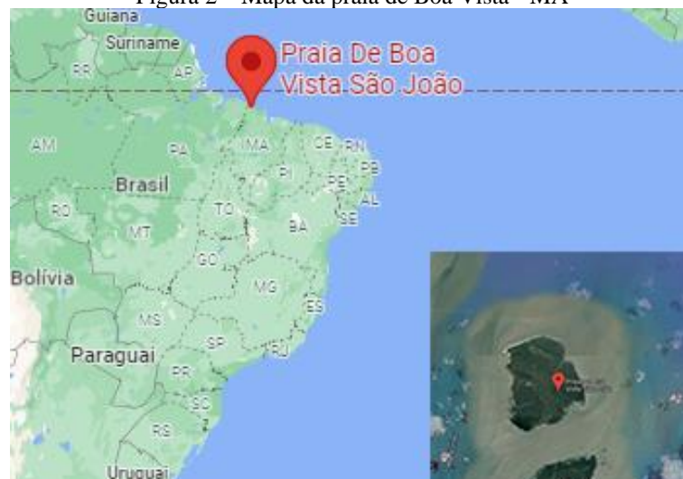
Figura 2 – Mapa da praia de Boa Vista - MA

Talvez eu esteja falando de uma pequena comunidade praiana, no Estado do Maranhão, que daqui a 30 ou 40 anos nem existirá mais, pois, com o passar dos anos, sofreu drásticas mudanças no seu espaço geográfico e na sua biodiversidade. Se observamos bem o mapa (Figura 2), a praia é uma ilha e já há uma grande parte debaixo do mar devido ao assoreamento. Em outras palavras, a praia e a comunidade estão sendo engolidas pelo oceano.