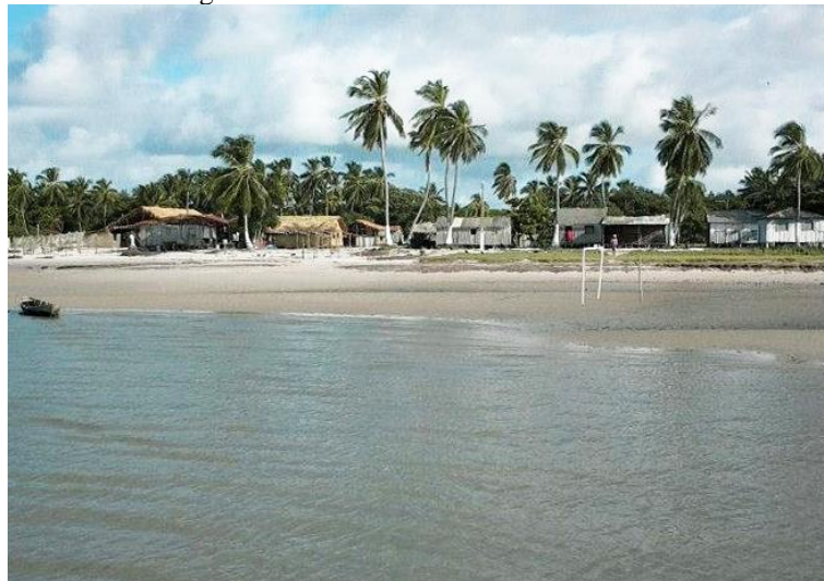
Figura 1 – Povoado Boa vista de São João