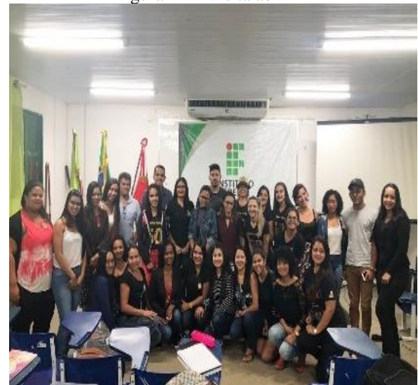
Figura 11 – Visita ao IFPA