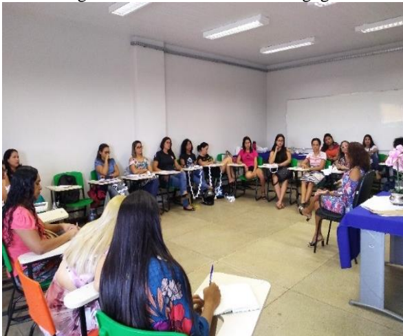
Figura 12 – Entrevista com Pedagogos

A disciplina “Pedagogia em ambientes não escolares” foi uma disciplina muito proveitosa e muito esclarecedora, porque, até então, eu tinha em mente que o pedagogo só poderia atuar na docência e apenas nas séries iniciais do Ensino Fundamental, mas essa disciplina nos mostrou as diversas possibilidades que há nessa profissão. Pudemos verificar isso a partir das entrevistas que realizamos com pedagogos atuantes em várias áreas (figuras 12 e 13), foi possível conhecer o trabalho deles em diferentes espaços.