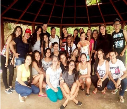
Figura 8 – Disciplina de Introdução a Educação