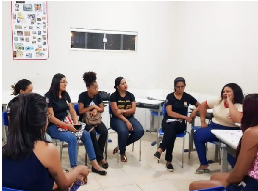
Figura 16 – Roda de Conversa na EJA

No último dia de estágio tivemos um momento de interação com todas as estagiárias e os alunos da EJA (Figura 16), onde relatamos nossas vivências, as dificuldades para continuar estudando (condição financeira, saudades da família e outros) e as alegrias alcançadas com os estudos, esse momento foi enriquecedor pois permitiu a interação da turma do EJA.