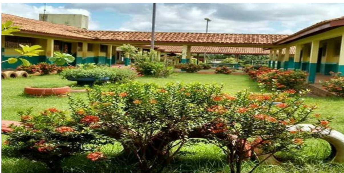
Imagem 1: E.M.E.I.F RUI BARBOSA

A metodologia adotada para o desenvolvimento deste trabalho foi composta por uma combinação de pesquisa bibliográfica e pesquisa de campo, com base nas experiências anteriores vivenciadas nos períodos de tempo-comunidade I, II e III, e no estágio supervisionado, todos desenvolvidos na E.M.E.I.F. Rui Barbosa, situada na Agrovila Jorge Bueno da Silva – KM 70, faixa Medicilândia/Pará.