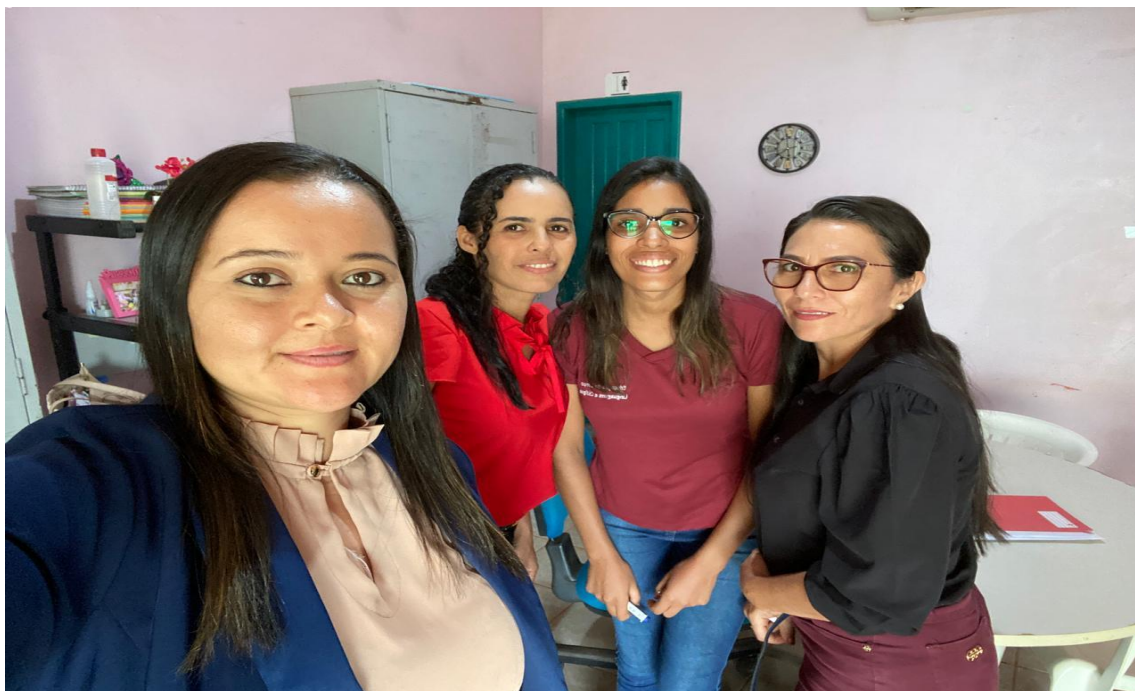
Imagem 6: Conversa com a equipe técnico-pedagógica da escola

Na 4ª Etapa, embora o número de alunos seja maior, os conflitos em sala de aula persistem. Um fator que contribui para esses conflitos é a grande diferença de idade entre os alunos. Alguns eram alunos do turno da manhã e migraram para o turno da noite, enfrentando uma convivência com colegas de faixas etárias distintas. Isso gera um choque de expectativas sobre o que é considerado adequado no ambiente escolar. Enquanto alunos mais velhos, com mais experiências de vida, já possuem uma ideia do funcionamento e organização de uma sala de aula, os adolescentes, que frequentemente estudam à noite para ajudar nas tarefas domésticas ou familiares, enfrentam seus próprios desafios, como conflitos típicos da adolescência e a necessidade de deixar seus ciclos de amizade para se adaptar a novas rotinas e ambientes de ensino.