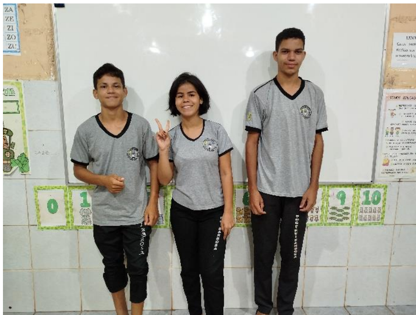
Imagem 9: turma da 3º ETAPA