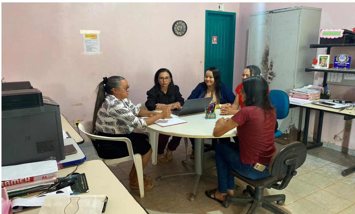
Imagem 5: Conversa com a equipe técnico-pedagógica da escola

Diante dessa realidade, conversei com a equipe técnico-pedagógica da escola, buscando entender seu ponto de vista sobre o alto índice de desistência entre os alunos da EJA. A direção reconheceu os esforços da escola e expressou pesar pelos alunos que desistem, especialmente aqueles que abandonam os estudos devido questões da vida, como gravidez ou sobrecarga de trabalho. Também foi destacado que, em alguns casos, há alunos que iniciam os estudos na EJA porém sem o compromisso real com a aprendizagem. As coordenadoras mencionaram que, apesar das buscas ativas, muitos desses alunos retornam brevemente e desistem em seguida.