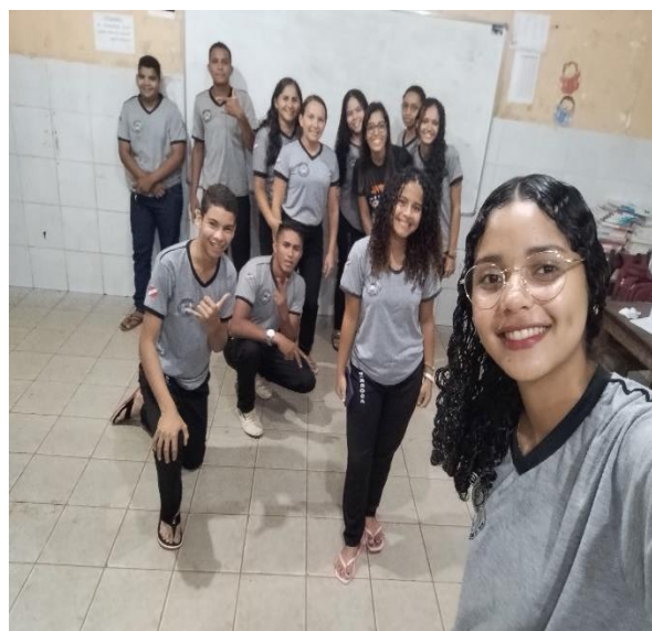
Imagem 8: turma da 4ª ETAPA