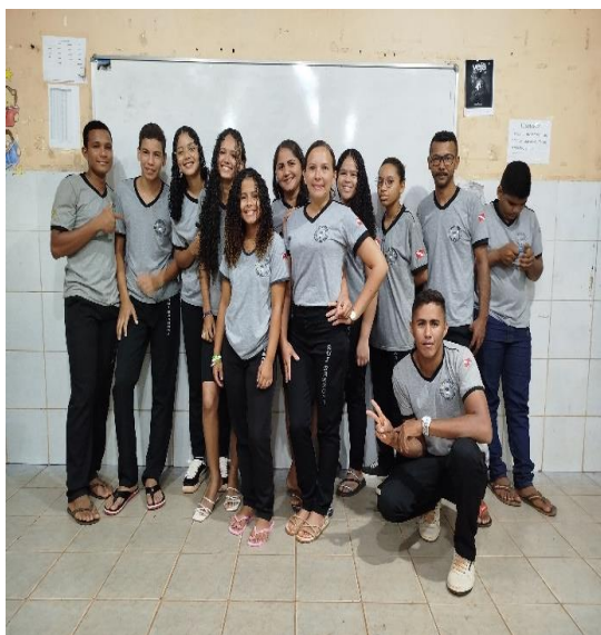
Imagem 7: Turma da 4ª ETAPA