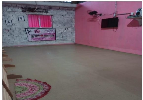
Imagem 05, onde ocorrem as aulas de jazz e hip-hop.