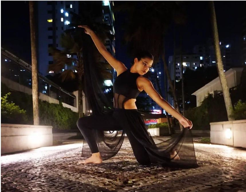
Registrada no Parque da Residência. Dos arquivos pessoais da aluna.