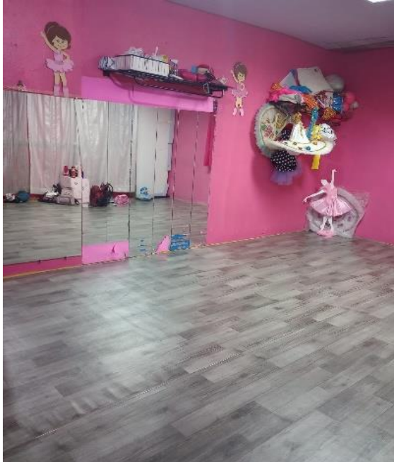
Imagem 02 da sala para ballet fraldinha e baby, ângulo A.

Imagens 02 e 03 - salas de aula das turmas ballet fraldinha e ballet baby.