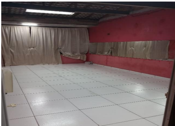
Imagem 04, de uma das salas de aula, usada nos demais gêneros de dança.

Imagens 04 e 05 - das salas de aula utilizada nos demais gêneros de dança.