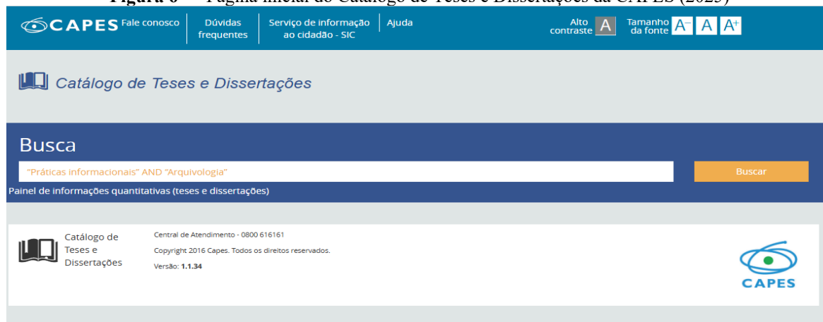
Figura 6 — Página inicial do Catálogo de Teses e Dissertações da CAPES (2025)