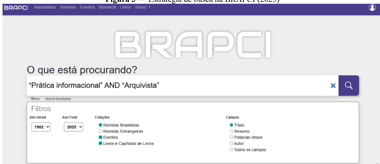
Figura 3 — Estratégia de busca na BRAPCI (2025)