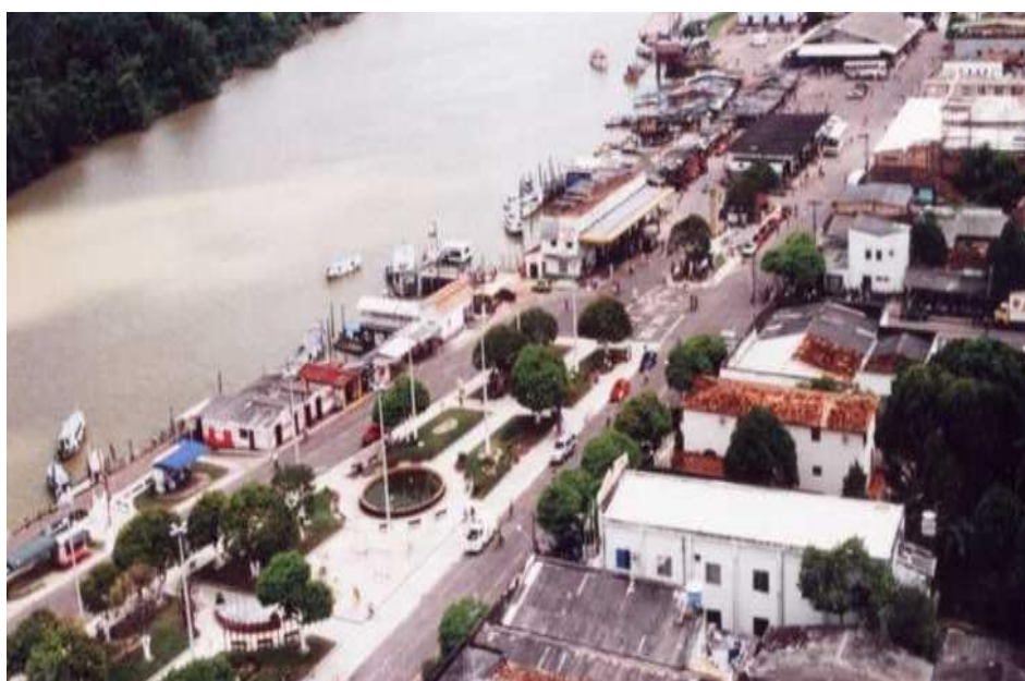
Imagem 1 - Cidade de Barcarena

Fonte: https://www.ferias.tur.br/cidade/4558/barcarena-pa.html