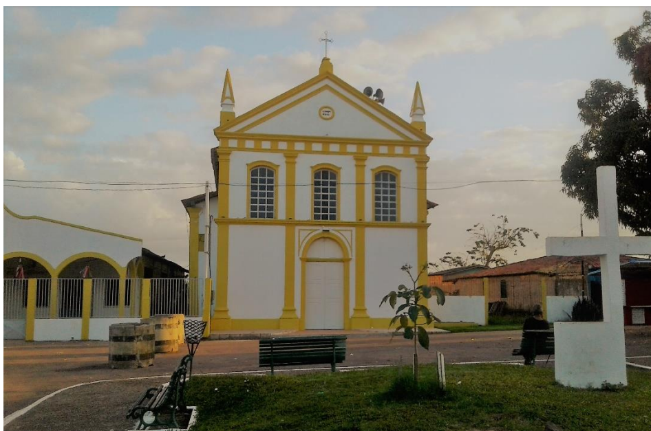
Imagem 2 - Igreja de São João Batista (Vila do Conde)