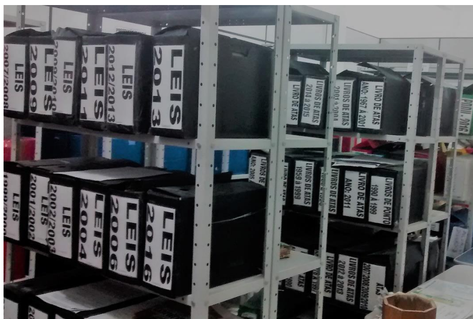
Imagem 5 - Acervo do Arquivo da Câmara Municipal

O arquivo da câmara é dedicado a guarda e tratamento dos documentos administrativos do setor legislativo, gerados pela câmara municipal dos vereadores de Barcarena. A existência do acervo é anterior ao próprio espaço físico, cedido recentemente com o propósito de salvaguardar tais registros, cuja coleção é constituída de documentos que atendam principalmente as demandas da câmara, como leis municipais, decretos, portarias, resoluções; além de documentos de caráter burocrático como ofícios, atas, quem vem desde 1945, telegramas, contas públicas, requerimentos e projetos (Imagem 4).