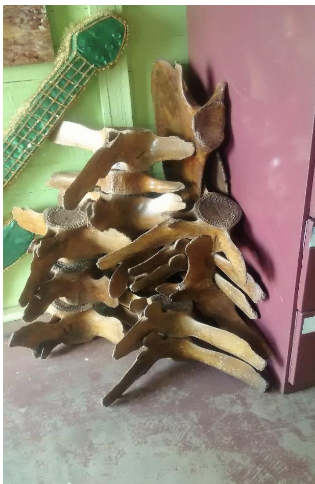
Imagem 6 - Ossos da Baleia de 1974

O pequeno espaço físico fornecido para o funcionamento do Setor de Tombamento e Preservação, também causa limitação no cuidado com os materiais de seu acervo, e propiciam a guarda irregular dos artefatos históricos, que ficam armazenados em armários ou expostos de forma não recomendada.