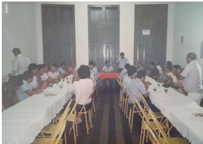
Figura 6: Reunião do Comando Geral no pavimento superior do Casarão, julho de 1989, Acervo Histórico do Centro de Memória do CBMPA.

Visando o processo de tombamento que perdurou até o ano de 2002, foram realizadas intervenções estruturais e internas dentro da edificação para usufruir de sua funcionalidade até a conclusão do processo. Importante citarmos que o período de início do processo, até o seu final, foi marcado pela subordinação do Corpo de Bombeiros à Polícia Militar, desincorporado apenas no ano de 1990. Os comandantes de ambas as instituições militares prezavam pela utilização funcional do espaço, pautando o desenvolvimento das atividades administrativas-técnicas, porém, não deixavam de lado o interesse na exposição da história do espaço, principalmente em visitas escolares direcionadas ao prédio.