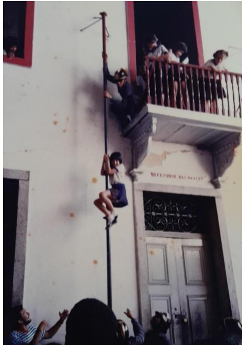
Figura 7: Visita de Grupo Escolar às dependências do Quartel, 1989.

Nota-se a presença de oficiais de alta patente, como o Comandante Geral: Tenente Coronel – Raimundo Nonato da Costa 35 .