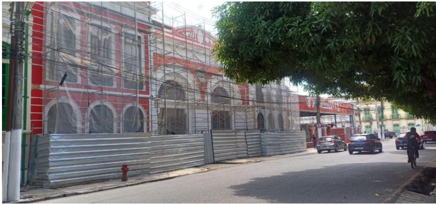
Figura 8: Fachada do Casarão Vermelho em processo de revitalização, 2025.

esforços corroborou para o pleno desenvolvimento das atividades e aumentou a expectativa para a sua inauguração, marcada para o mês de novembro de 2025.