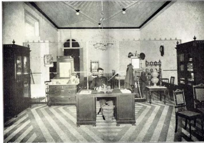
CORPO DE BOMBEIROS Sala e alojamento do oficial de estado

Figura 4: Fotografia da Sala e Alojamento do Oficial do Estado em 24 de fevereiro de 1904, O município de Belém: Relatório Antônio Lemos de 1905 referente ao ano de 1904, Cliché Girard pp. 64-65 – Seção de Obras Raras (CENTUR).