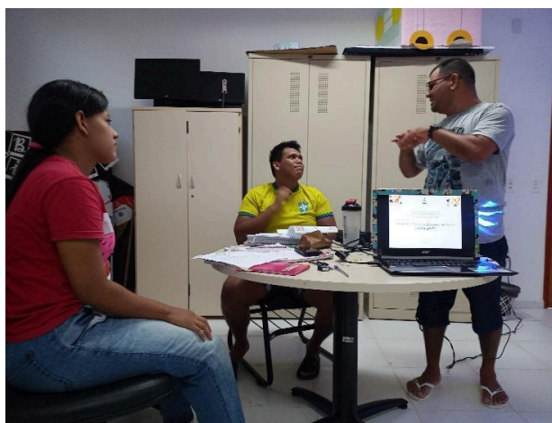
Figura 3: Indivíduos surdos no Laboratório de Inclusão da UFPA

Partindo disso, as discussões e atividades realizadas no laboratório de inclusão foram pensadas de forma a contar com participação de surdos da comunidade, mesmo que apenas o aluno da escola Yolanda Chaves estivesse inserido oficialmente no projeto. Contudo, foi justamente a partir dessas participações que se percebeu como a pessoa surda consegue identificar-se com um semelhante, conforme Strobel (2018) retrata em seus escritos, o que afeta positivamente a compreensão da língua estudada, bem como o processo de ensino e aprendizagem, vejamos na figura 03.