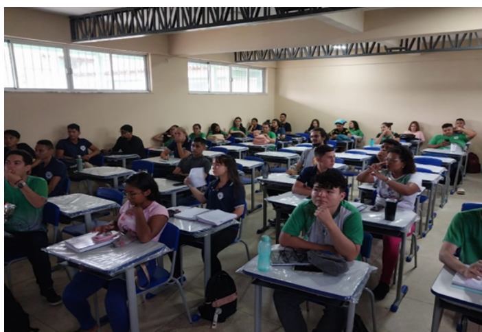
Figura 02. Estudante surdo na sala de aula

Nesse contexto, há a instituição escola que é um dos palcos centrais desta discussão, e também o campo desta pesquisa. A relação do espaço escolar com a Oralismo foi, por muito tempo, de consentimento, uma vez que as escolas adotavam métodos de ensino que forçaram os alunos surdos à oralização, repudiando assim o uso da língua de sinais. Sob essa ótica, foram levantadas reflexões a respeito dos desafios causados pela filosofia oralista tanto no espaço escolar da EEEFM Prof a Yolanda Chaves quanto no Laboratório de Inclusão da UFPA.