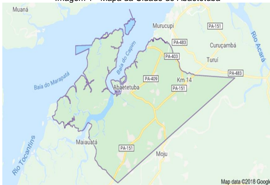
Imagem 1 - Mapa da Cidade de Abaetetuba

Abaetetuba é um município do Estado do Pará que faz parte da Microrregião de Cametá, localizada a uma latitude “01°43'05" sul e longitude “48°52'57" oeste, as margens do Rio Maratauíra (afluente do Rio Tocantins). É a cidade-pólo da Região do Baixo Tocantins. O Município é formado por dois distritos: Abaetetuba (sede) e a Vila de Beja. Segundo o Instituto Brasileiro de Geografia e Estatística (IBGE, 2018) Abaetetuba possui uma população estimada em 156.292 pessoas, com densidade demográfica 87,61 hab/km 2 (IBGE, 2010), tendo uma renda per capita de 7.960,05 R$ (PIB, 2015).