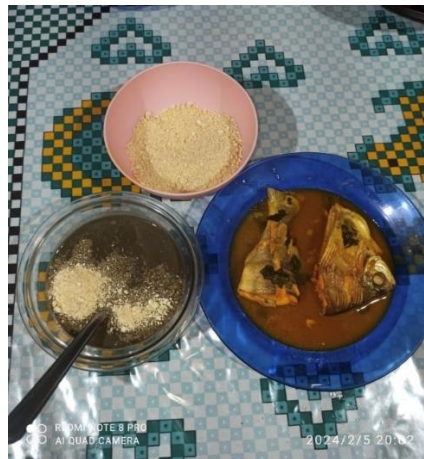
Figura 8 - Foto: VIEIRA, M. T, janeiro de 2024

Em Cametá, o açaí chega de vários lugares e em vários horários, principalmente, nas primeiras horas e no final da tarde. Os “batedores de açaí” como são chamadas as pessoas que compram in natura para vender em vinho, chegam cedo na feira da cidade e vilas para garantir