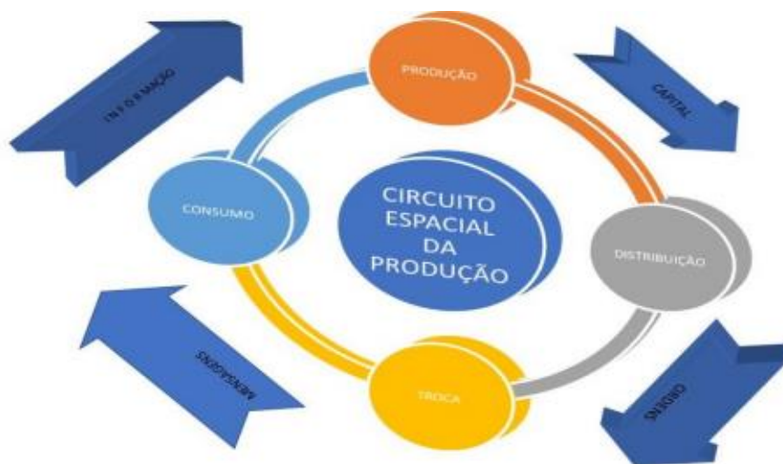
Figura 2 - Representação gráfica do circuito espacial da produção

Os autores trazem uma compreensão do movimento que rompe com a visão estática do território, que também compreende a base material da produção, os fluxos, e a dimensão imaterial, como afirmam Santos e Silveira (2001, p. 144) “capitais, informações, mensagens, ordens. De acordo com o que ilustramos a seguir, na figura 2: