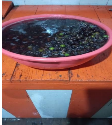
Figura 5 - Recipiente com açaí e água quente no ponto para amolecer o fruto

Para a retirada do vinho do açaí, é necessário adicionar água quente no recipiente com açaí (figura 5), em uma certa temperatura até que o fruto amoleça e fique ao ponto de ser levado a máquina de bater açaí. Esse processo é importante, pois além de amolecer os frutos, garante que a eliminação de várias impurezas que podem estar ali presentes, como por exemplo, o protozoário que causa a doença de chagas (barbeiro). É de suma importância também fazer a higienização da máquina antes de colocar dentro o açaí.