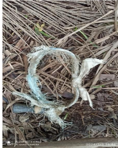
Figura 4 - Peconha