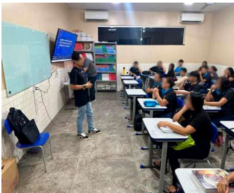
Imagem 1 - Apresentação do tema e o convite à pesquisa.

Retornando para a atividade de Modelagem realizada, aplicamos aos alunos uma atividade de corrida de rua, houve a presença em média de 20 alunos, em sala de aula no dia da nossa apresentação já havíamos conversado sobre a execução da prática da atividade, na Imagem 1.