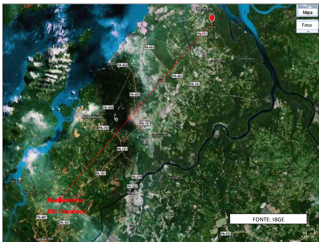
Figura 1: Provável percurso realizado pelos Quilombolas da fazenda Cafezal até o Alto Itacuruçá

De acordo com relatos de antigos moradores esse pequeno grupo de escravos refugiados de uma fazenda perto da província do Grão-Pará, hoje situado município de Barcarena localidade de cafezal buscavam local que lhe passasse segurança. Foi quando aproximadamente nos séculos XVIII à XIX, chegaram a nascente do rio Itacuruçá, que apresentava beleza natural e obstáculos territoriais, pois, o rio oferece curvas sinuosas e barrancos de pedras no seu leito, dificultando o acesso em sua nascente. Isso tudo não foram motivos para os senhores dono de escravos desistirem na tentativa de recapturar os negros fugitivos.