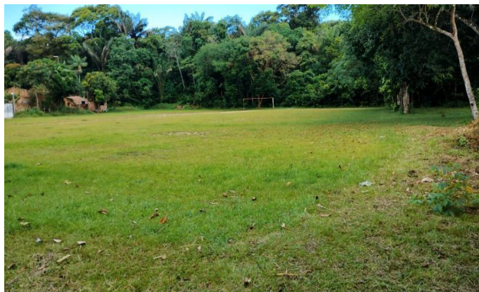
Foto 9 - Campo da família Cardoso