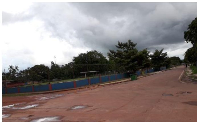
Foto 8 - Campo de Futebol Municipal

Além das igrejas, a Vila conta com espaços de lazer como a Praça de São Miguel, a Praça Osni Barros no centro da Vila, quadra poliesportiva, campo de futebol e casa de shows. Abaixo, imagens 8 e 9, respectivamente, temos a foto do campo de futebol municipal e do campo da família Cardoso.