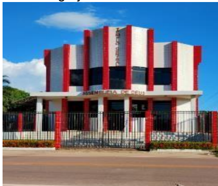
Foto 5 – Igreja Assembleia de Deus