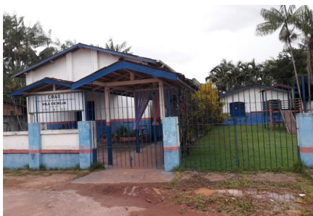
Foto 3 – Prédio que abriga o centro de referência a Assistência Social

A saúde é atendida pela Unidade Básica de Saúde (UBS), tendo no seu atendimento a aplicação de vacinas, consultas médicas (no horário da manhã e da tarde) e à noite o atendimento de emergência e primeiros socorros é feito por um enfermeiro, já os casos mais complexos são encaminhados para a cidade de Abaetetuba. O CRAS (Centro de Referência a Assistência Social), localizado onde era a antiga igreja assembleia de Deus (FOTO 3), que nos últimos anos se mobiliza apenas em campanhas específicas, ficando assim o atendimento mais para o cadastro dos programas do Governo Federal.