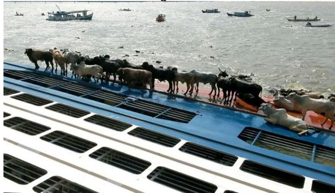
Foto 14 - Naufrágio do Navio Haidar.

Fonte: https://bancariospa.org.br/ces-para-lancamocao-de-repudio-apos-acidente-de-navio-que-afundou-em-vila-do-conde/ 19 .