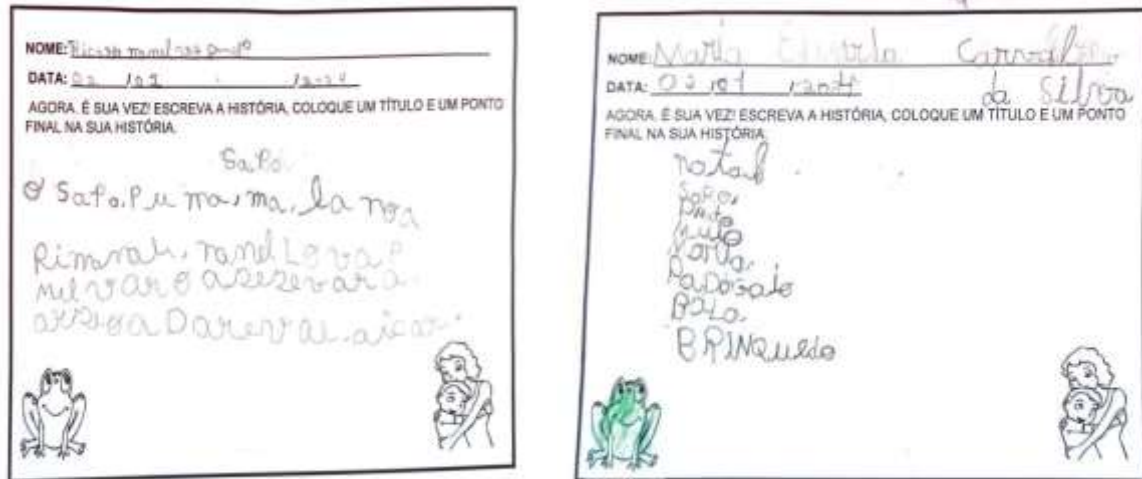
Figura 15 - Atividade de escrita final.

que eles faziam em sala de aula. Ressaltamos que problemas de ordem gramatical também foram analisadas. A Figura 15 demonstra essa análise.