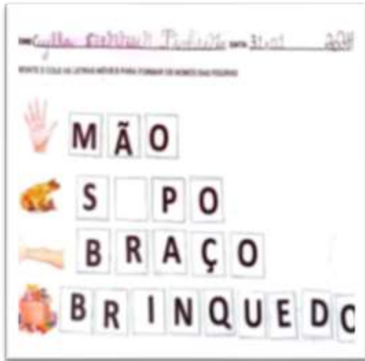
Figura 9 - Atividade colar letras móveis.