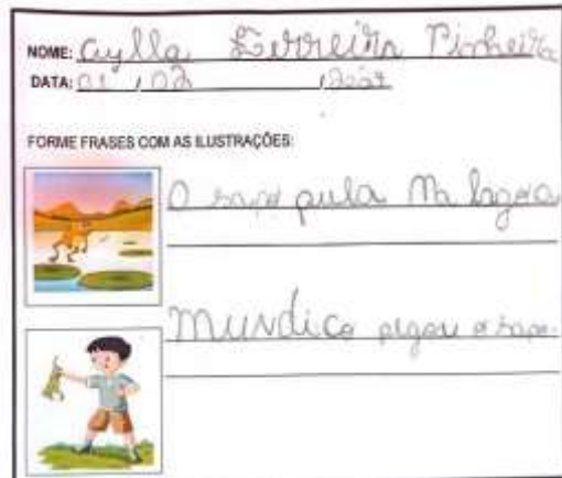
Figura 13 - Atividade criação de frases.

sorteadas. Demonstrando a primeira e segunda atividades nas figuras 13 e 14.