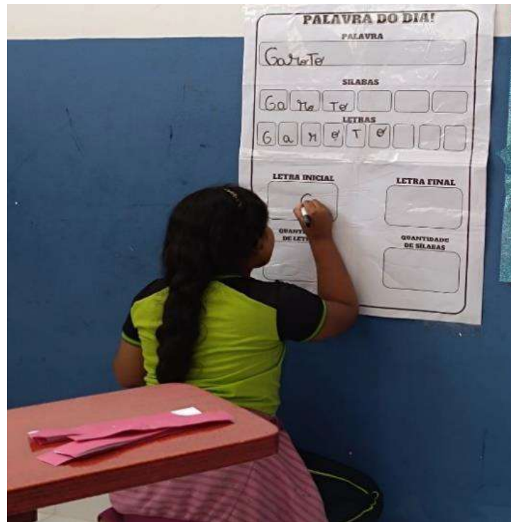
Figura 3 - Aluna desenvolvendo atividade palavra do dia