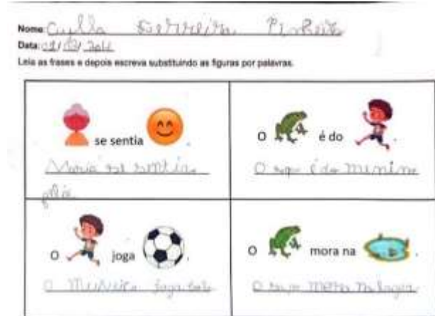
Figura 14 - Atividade trocar imagem por palavra.