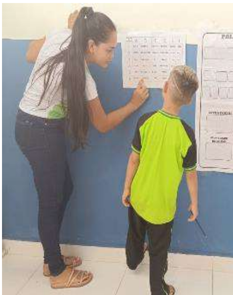
Figura 12 - Sistematização batalha de palavra