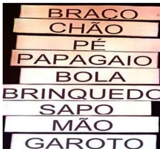
Figura 2 - Palavras tiradas do texto e impressas em letras maiúsculas.

E posteriormente, cada criança se direcionava ao quadro da “palavra do dia” e destrinchava a palavra sorteadas. Essa atividade foi feita com um material que lhes possibilitou escrever (caneta não permanente) e apagar até que conseguissem escrever a palavra ou escrever do jeito deles. Os próprios alunos mostravam interesse em querer escrever a palavra de forma correta, pensavam antes de escrevê-la e ao acertar, comemoravam. Atividades retrata nas figuras 2 e 3.