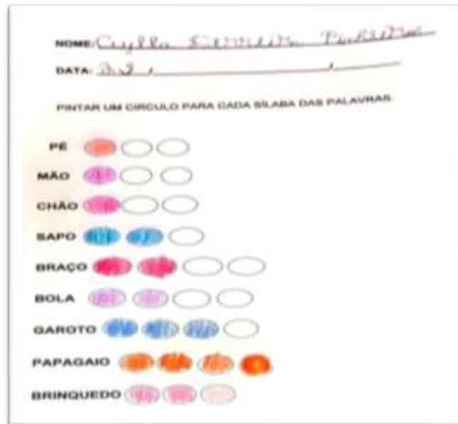
Figura 4 - Atividade de pintar o círculo do valor sonoro

valor sonoro silábico) e, no final, de forma lúdica e bem atrativa, um bingo silábico, bingo elaborado, com início das sílabas trabalhadas do texto, conforme é possível visualizar nas figuras 4 e 5.