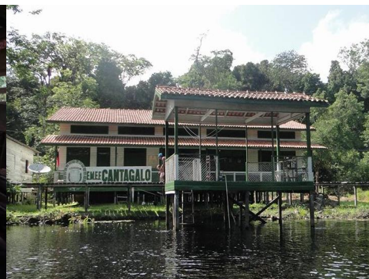
Figura 06 - Escola Canta Galo