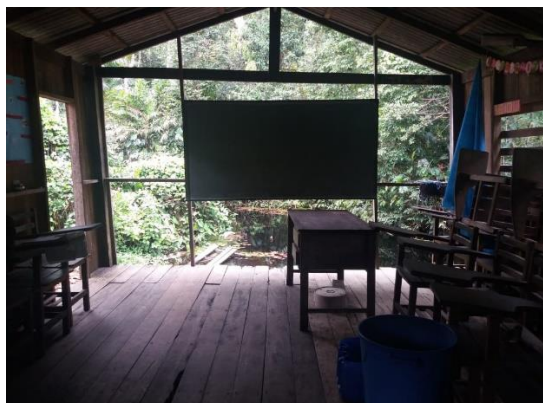
Figura 05 - Sala que funciona como anexo da escola Canta Galo