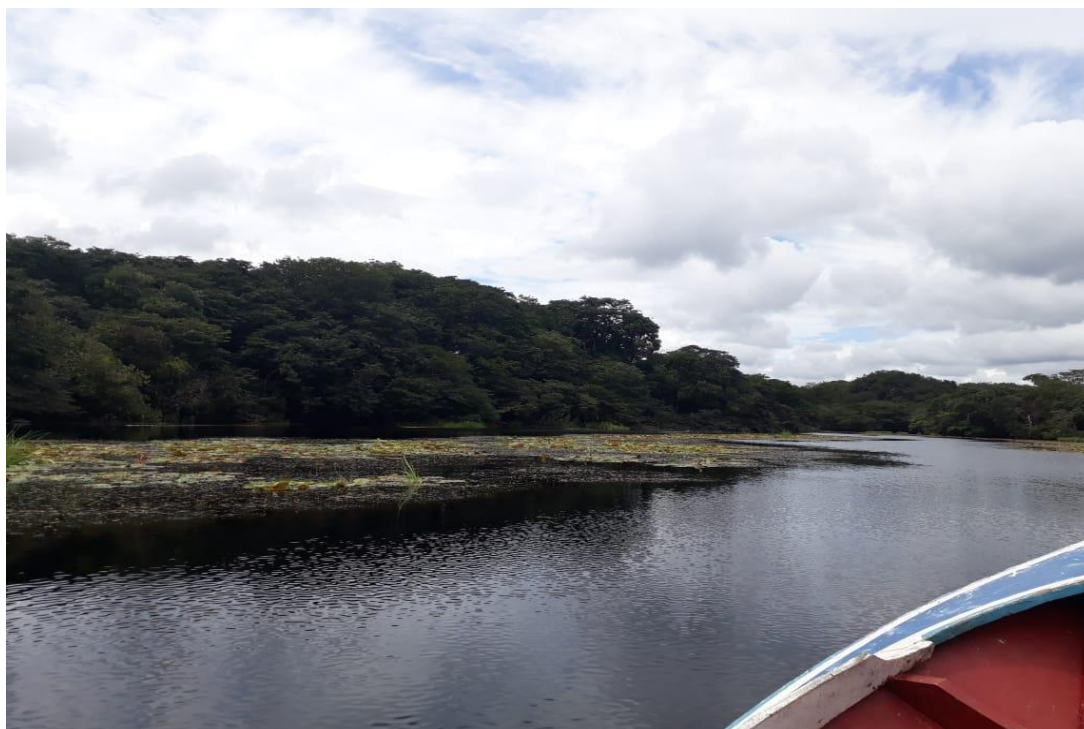
Figura 02 - Beleza natural da Resex Mapuá, Breves Pará.