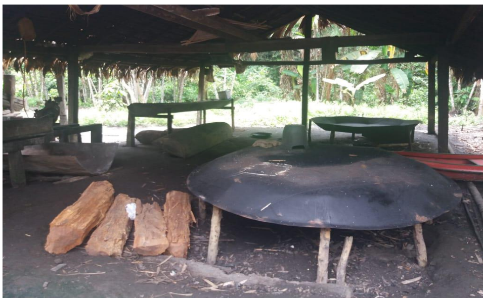
Figura 04 – Casa de farinha na localidade Canarana, comunidade Canta Galo

O Mapuá é um rio localizado na Resex Mapuá aproximadamente a 200 km da cidade de Breves. De acordo com o Associação de Moradores da Reserva Extrativista Mapuá (AMOREMA 2014), a população é de 632 famílias totalizando 5.400 pessoas, distribuídas em 17 comunidades, a maioria trabalhando com a extração de produtos da floresta, como açaí, madeira, palmito e cultivo da mandioca e sus derivados como ilustra a figura a seguir, em suas respectivas áreas de uso familiar, conforme estabelece o plano de uso da Unidade de Conservação (UC).