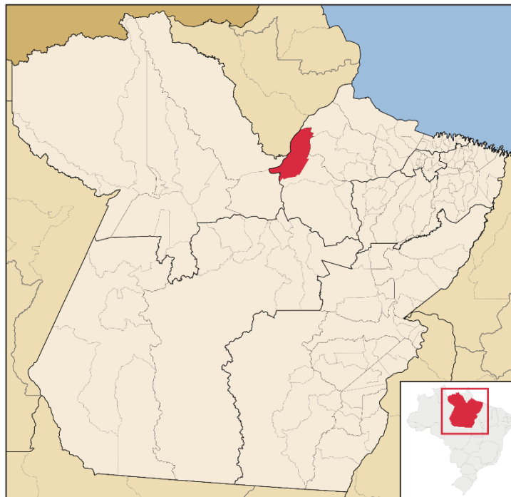
Figura 1: Localização de Gurupá.