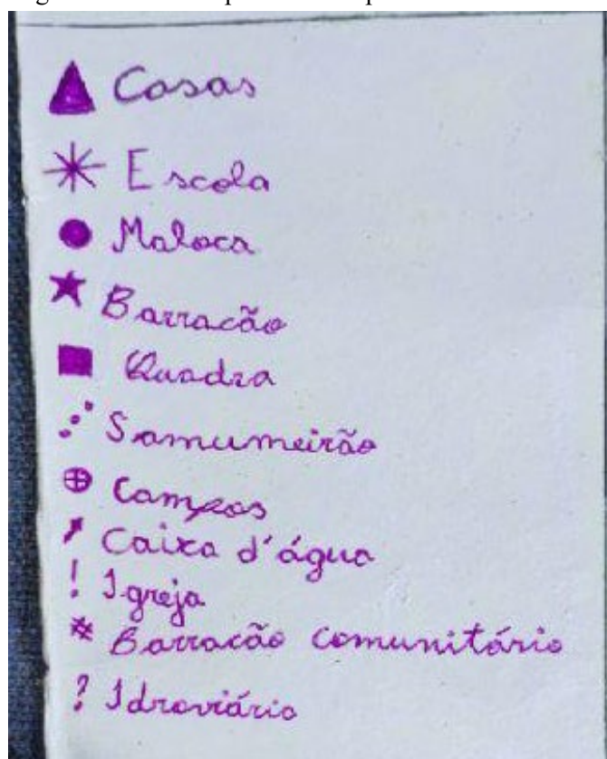
Figura 4: Locais dispostos do mapa.