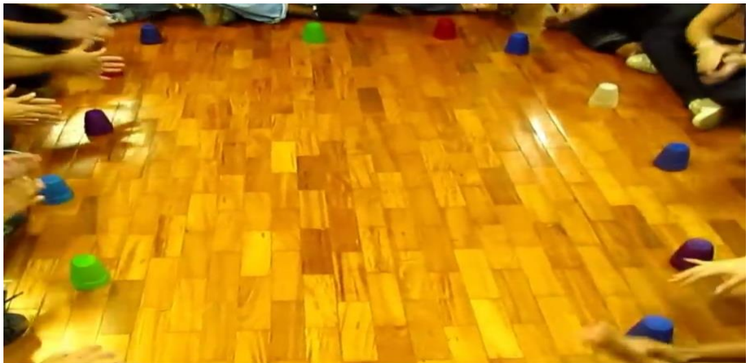
Figura 6: atividade “Passa copo” em grupo