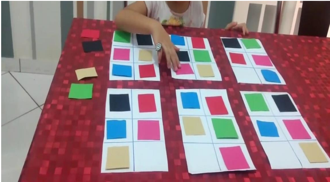
Figura 3: Montagem do jogo

Fonte: Youtube.com.br. Sequência lógica com a professora Cássia. Disponível em: https://www.youtube.com/watch?v=xnsjwBolAE0