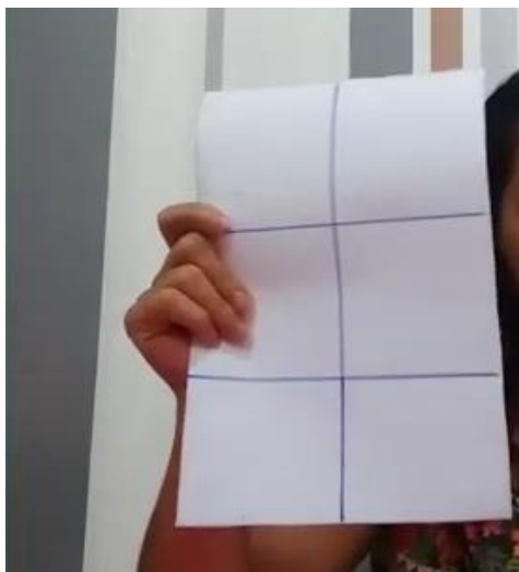
Figura 1: Papel A4 branco traçado com a caneta marcadora.