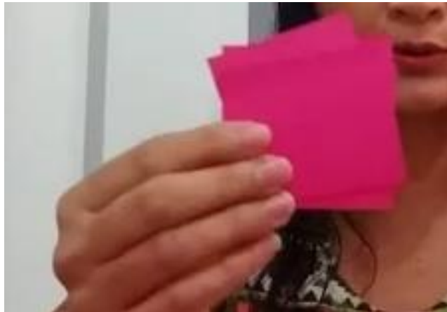
Figura 2: Plaquinhas de papel A4 colorido, modelo do tamanho proporcional.

Fonte: Youtube.com.br. Sequência lógica com a professora Cássia. Disponível em: https://www.youtube.com/watch?v=xnsjwBolAE0