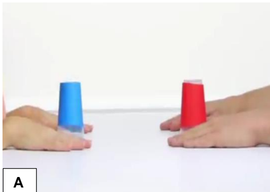
Figura 5: Simulação das orientações sobre o passo a passo da música. A) Copos e mãos na mesa; B) Pega copo; C) Ta Tum Tum; D) Vira copo; E) Representação do Vira copo; F) Vira copo; G) Passa copo; H) Representação do Passa copo.

Ao passo que o áudio da música é ligado, as crianças prosseguem utilizando o copo de acordo com as orientações do passo a passo da música (figura 5) e a velocidade que a música é apresentada. Haverá momentos em que os movimentos das crianças serão mais lentos e outros momentos serão mais rápidos. O importante é sempre orientar as crianças para que elas fiquem atentas ao ritmo da música e a letra.