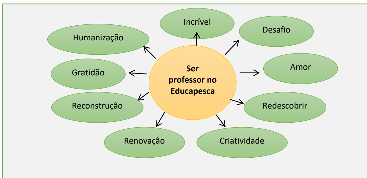
Figura 02: Quadro imagético do ser docente no Educapesca.

A figura acima traduz a objetivação do desafio encontrado no projeto por ser algo novo, não vivido anteriormente, mesmo que tenha trabalhado na EJA em outros momentos. A particularidade da pesca que configura os saberes e práticas desses alunos, trás a renovação, criatividade e redescoberta da prática docente, como reforçam os relatos dos professores abaixo: