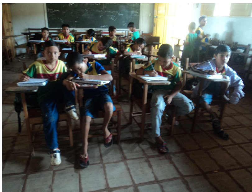
Atividade de Escrita