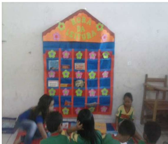
Hora da Leitura