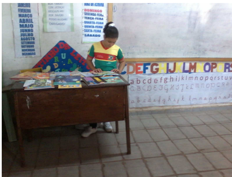
Aluna Selecionando o Livro Que Empréstará Do Cantinho Da Leitura