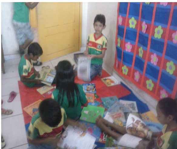
Hora da Leitura