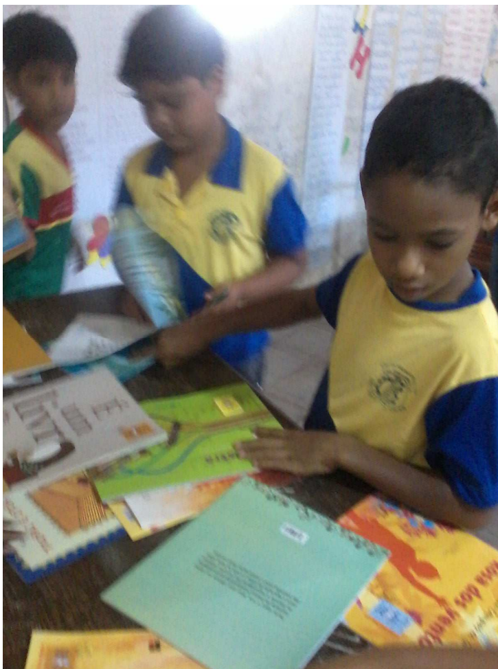
Alunos Seleccionando o Livro Que Empréstaram Do Cantinho Da Leitura