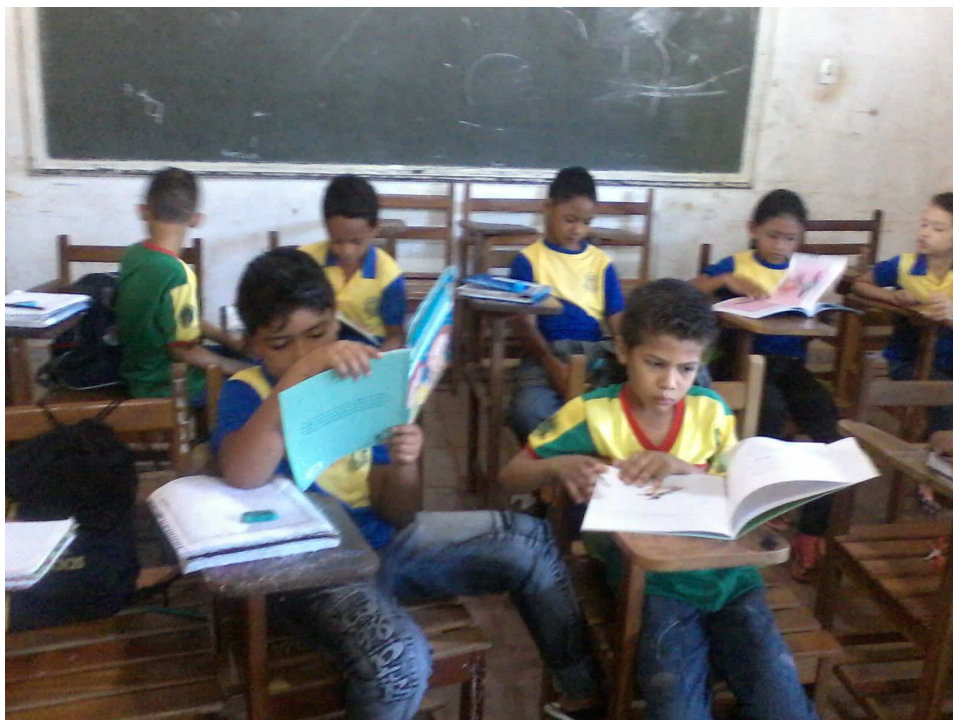
Atividade de Leitura