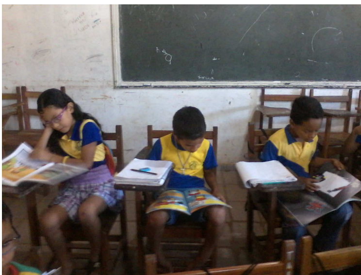
Atividade de Leitura