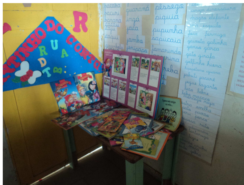
Cantinho Do Conto Confeccionado Com a Ajuda Dos Alunos