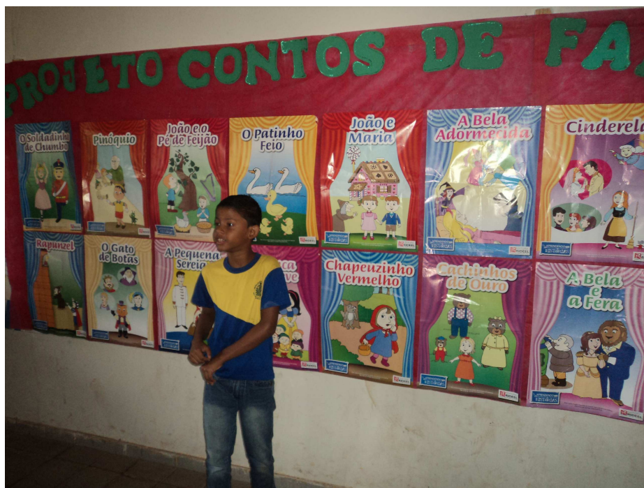
Aluno Contando A História “João e Maria” Para Os Colegas