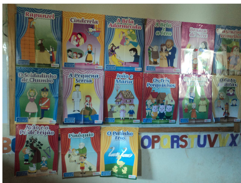
Livros De Contos Seleccionados Para O Cantinho Da Leitura