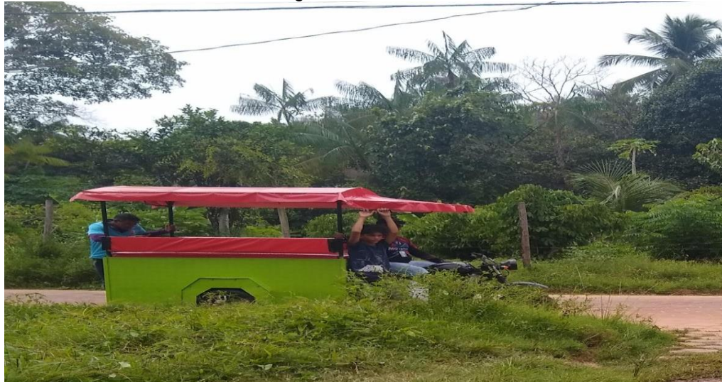
Figura 4 – Motorrete.

gestão familiar, alimentação em pequenos restaurantes que utilizam comidas regionais e o transporte dentro da ilha é feito por bondinhos que são puxados por tratores, charretes, moto táxi e motorretes (Figura 4).