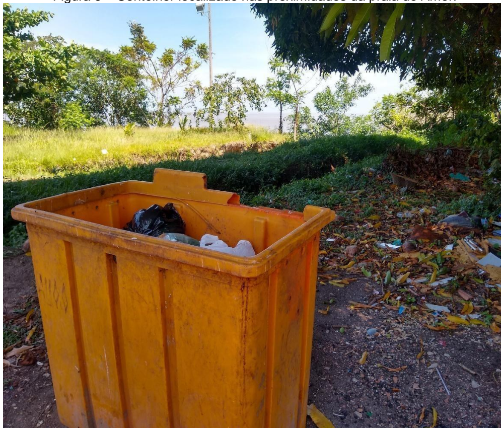
Figura 9 – Contêiner localizado nas proximidades da praia do Amor.

Na praia do Amor havia um container (Figura 9) que estava bem próximo da falésia que dá acesso à praia, ele estava quase cheio e bem perto dele havia lixo jogado em seu entorno e estava se acumulando. Um grande risco para o meio ambiente, pois a chuva pode carregar esse lixo para a praia e para o rio.