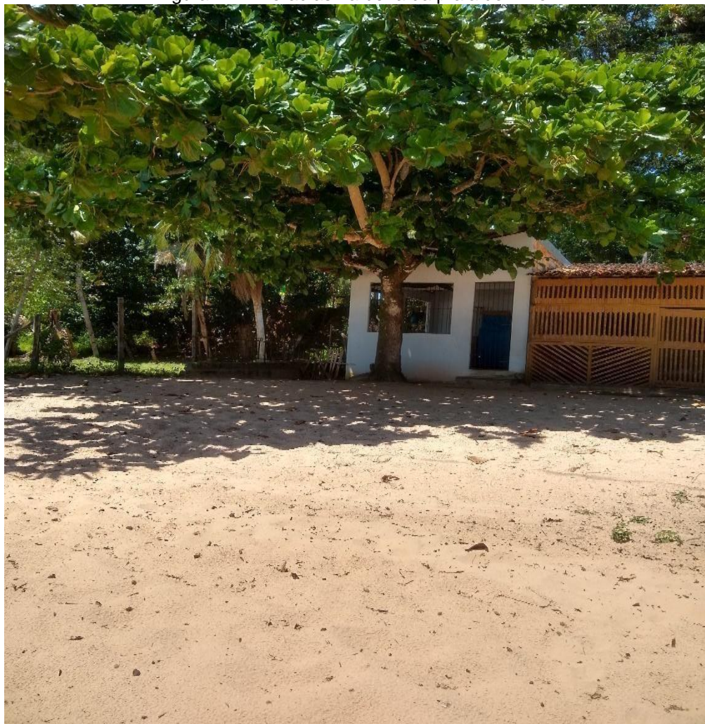
Figura 11 – Moradias na beira da praia do Amor.

proprietários. Já na praia do Farol, é nítida a retirada da vegetação natural para a construção de restaurantes e pousadas e a presença de construções às margens de um igarapé sem que haja qualquer preocupação em preservar o mesmo, visando apenas o desenvolvimento das atividades turísticas.