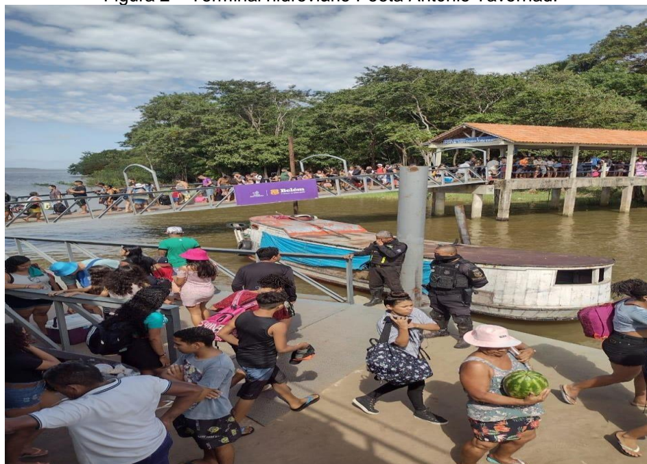
Figura 2 – Terminal hidroviário Poeta Antônio Tavernad.

Em 2000, foi construído pelo governo municipal um novo trapiche (Figura 2) que recebeu o nome do Poeta Antônio, o qual atende os fluxos que chegam à ilha, seja de pessoas ou de mercadorias. O novo terminal hidroviário, foi construído para facilitar a locomoção dos moradores para o distrito de Icoaraci.