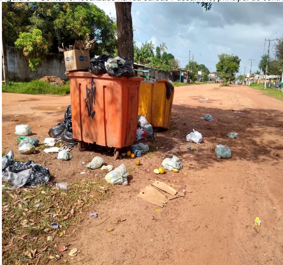
Figura 8 – Contêiner localizado na rua Jarbas Passarinho, principal do centro.

Durante a pesquisa de campo, pôde-se verificar que no caminho para a praia a questão do lixo estava em toda parte da ilha, e na principal rua Jarbas Passarinho, onde fica localizado o "centro" urbanizado da ilha, com hotéis e serviços, a situação é bem crítica em relação à coleta seletiva. E, podem ser observados vários containers (Figura 8) para ser colocado o lixo em torno, mas que durante as férias ele aumenta. Em alguns locais eles estavam transbordando e alguns deles eram bem próximos das praias.