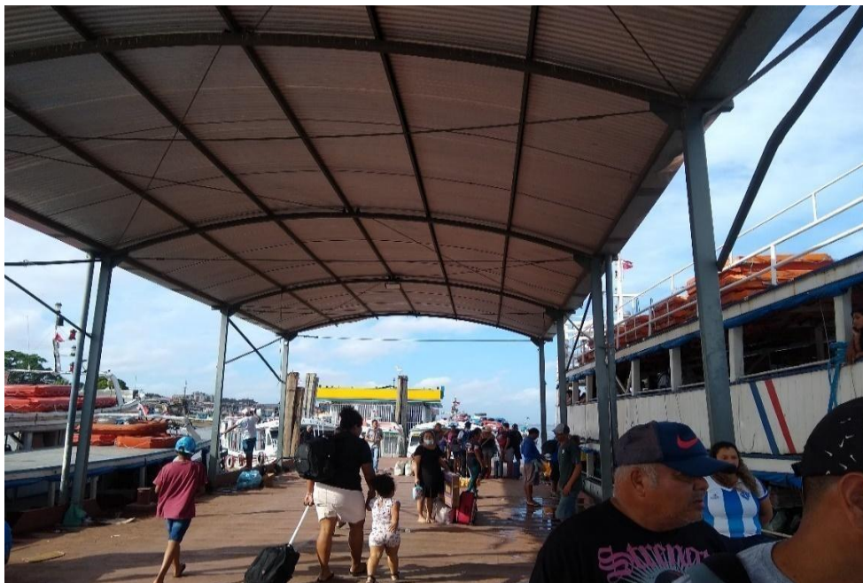
Figura 3 – Trapiche do Distrito de Icoaraci.

Há também embarcações menores da Cooperativa de Barqueiros da Ilha de Cotijuba (Corperbic) que partem de Icoaraci de Segunda à Sexta a partir das 7 horas, com viagens de hora em hora, nos finais de semana e feriados ou nas férias os barcos saem com lotação máxima, o valor da tarifa é um valor fixo de 8,00 reais. (INVENTÁRIO DA OFERTA TURÍSTICA DE BELÉM, 2019)