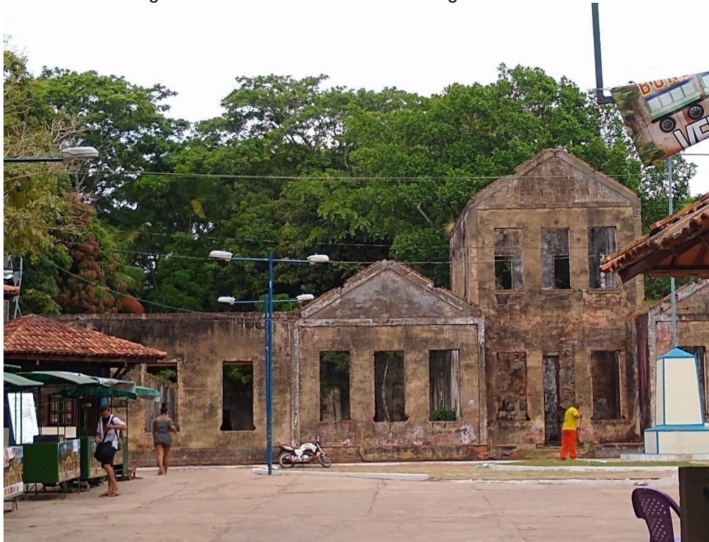
Figura 7 – Ruínas do Educandário Nogueira de Farias.

delinquentes. Tal período fez com que Cotijuba povoasse o imaginário dos habitantes da capital, onde os rumores sobre torturas, fugas a nado e perseguições na mata de jovens infratores lhe renderam o apelido de “ilha do diabo” (BELEMTUR, 2019).