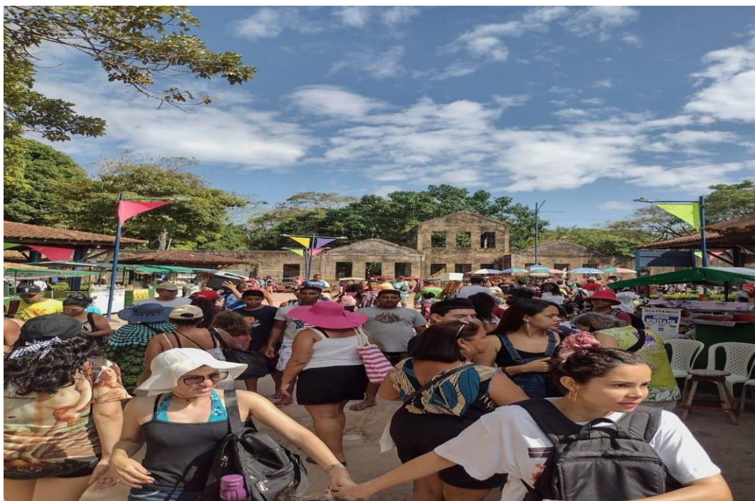
Figura 6 – Praça Poeta Antônio Tavernad no período do veraneio.

Conta também com uma população em torno de 10 mil habitantes, mas nos períodos de feriados e férias escolares chega a alcançar cerca de 20 mil visitantes por fim de semana (Figura 6), assim, caracterizando um turismo massificado apesar do potencial para o ecoturismo 2 e o turismo de base comunitária. (PLANO MUNICIPAL DE TURISMO DE BELÉM, 2020).