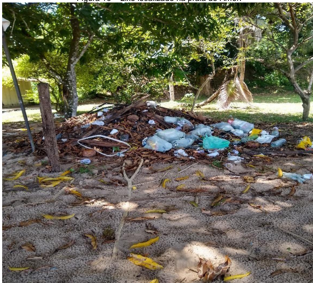
Figura 10 – Lixo localizado na praia do Amor.

“Quando os donos dos bares vão fazer a limpeza, eles fazem aquela queimada lá na praia, isso prejudica a erosão, né? Por exemplo, lá naPraia da Pedra Branca, tá caindo os barrancos pra lá por causa disso, do desmatamento, que tem muito desmatamento, o que causou muito aqui na ilha o impacto ambiental maior foram muitas casas, muitos moradores novos”. (Morador)