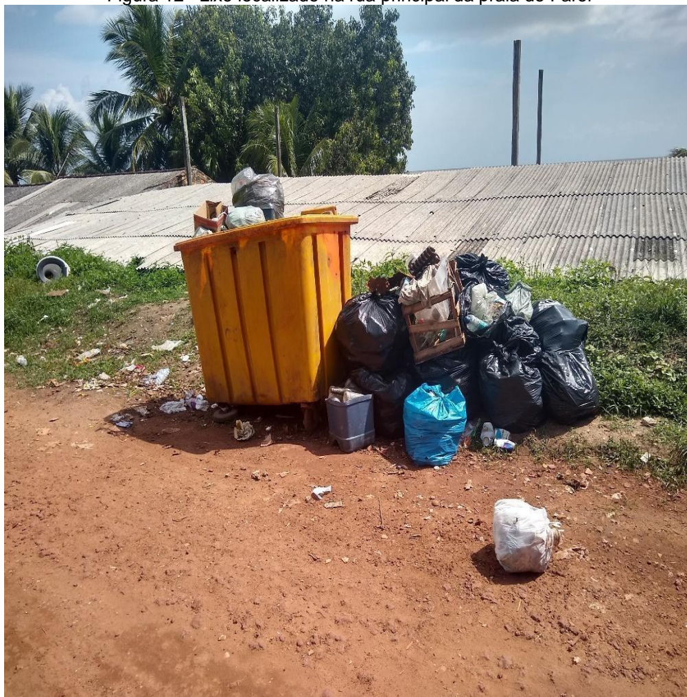
Figura 12– Lixo localizado na rua principal da praia do Farol