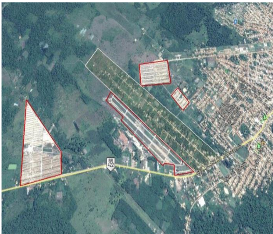
Figura 7: Bairro Cinturão Verde em 24 de junho do ano de 2017