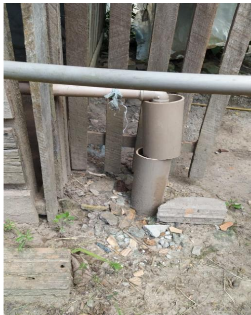
Figura 12: Poço artesiano/fechado