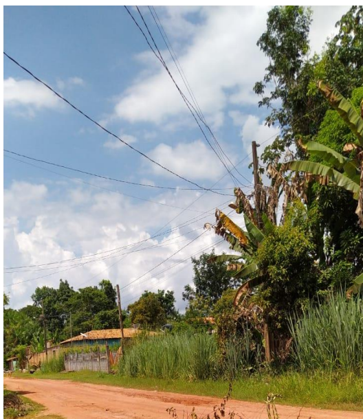
Figura 11: Rede elétrica atual no cinturão verde