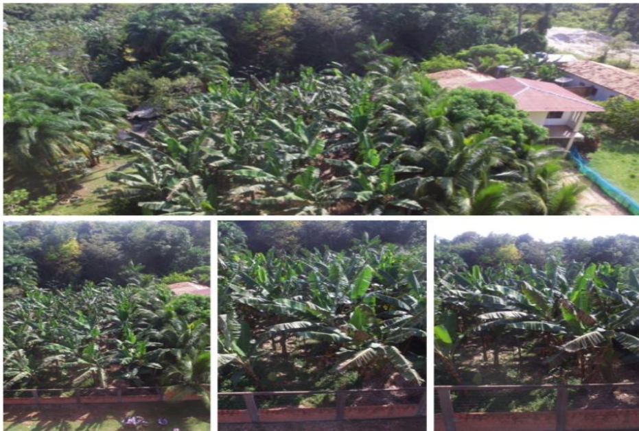
Figura 18: Imagens aéreas do desenvolvimento da produção da Banana no cinturão verde