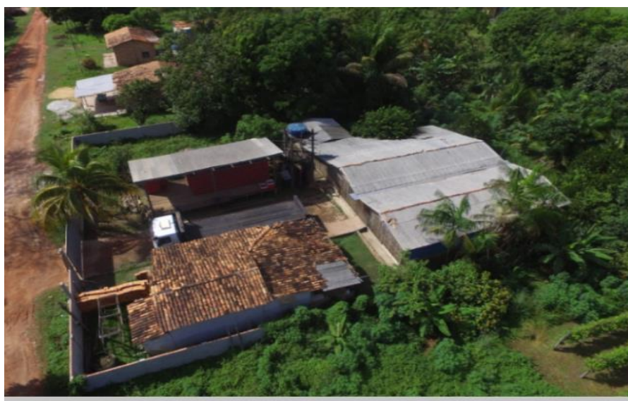
Figura 19: Imagens aéreas do Granjeiro no cinturão verde