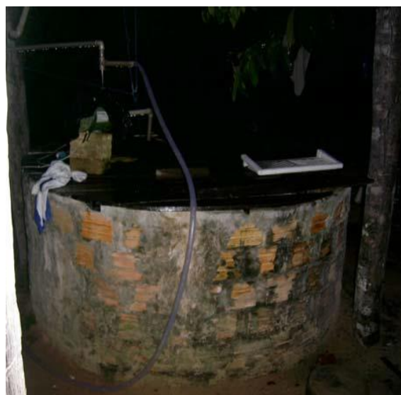
Figura 10: Poço a céu aberto