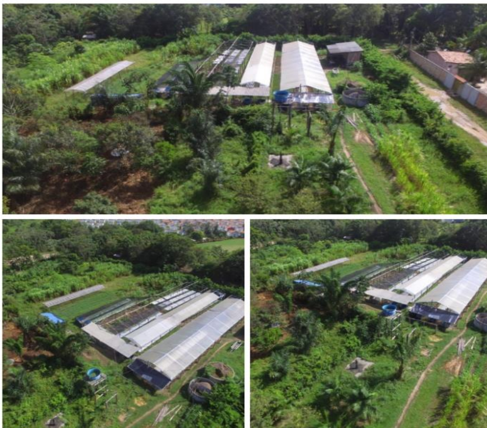
Figura 16: Imagens aéreas do desenvolvimento da produção de hortaliças/ Bairro Cinturão verde