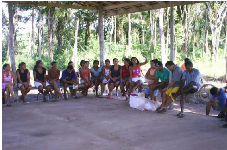
Figura 01: Cametá - Cinturão Verde - Reunião de estratégias para permanência do assentamento