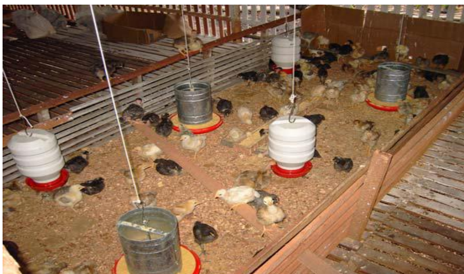
Figura 4: Cametá – Bairro Cinturão Verde - Criação de Frangos no assentamento Cinturão Verde