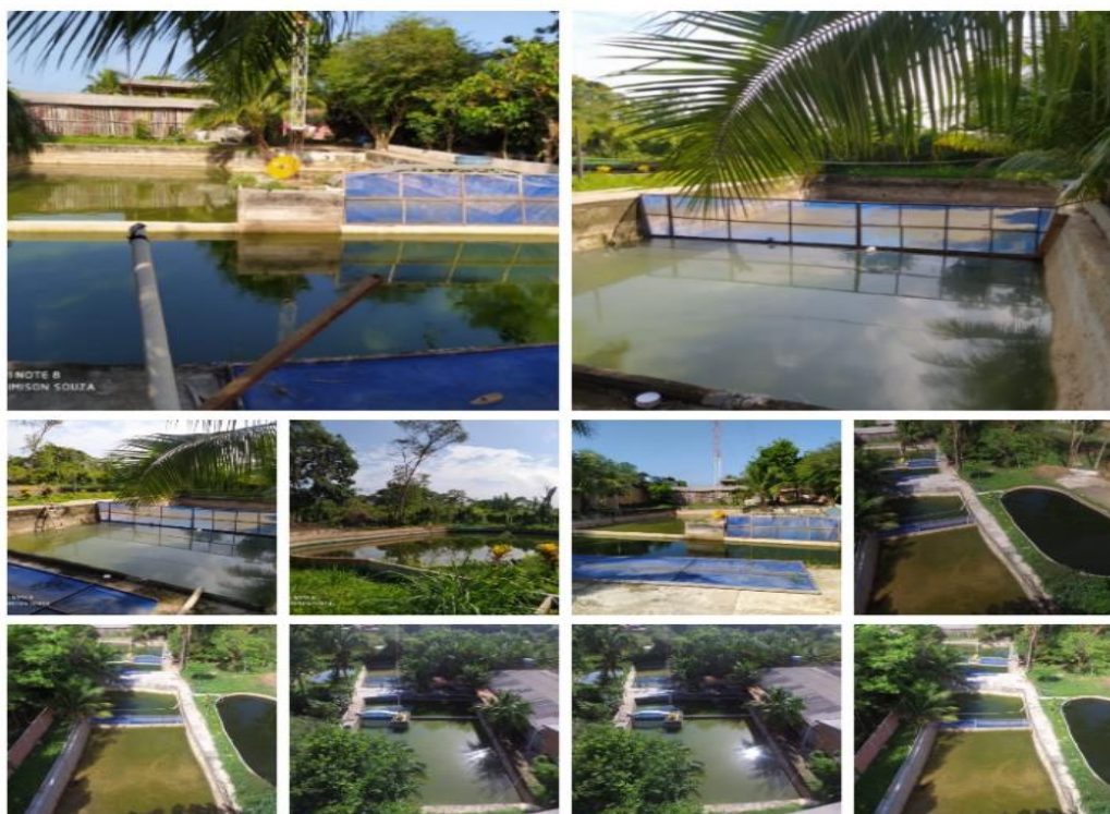
Figura 15: Imagens aéreas do desenvolvimento da Piscicultura no bairro Cinturão verde