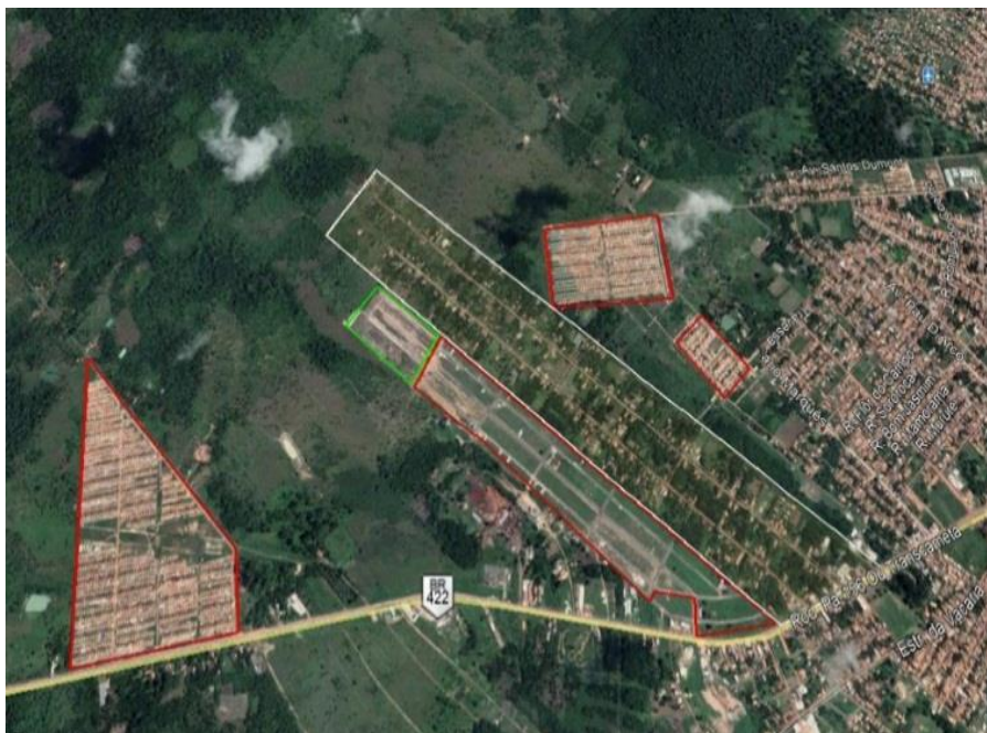
Figura 8: Cametá - Bairro Cinturão Verde em 22 de janeiro do ano de 2021