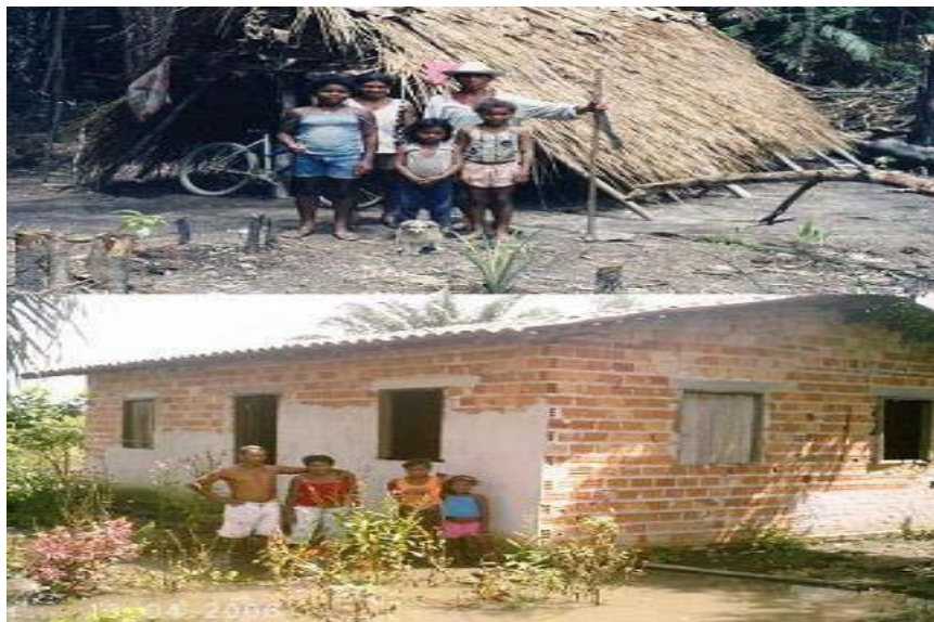
Figura 3: Cametá – Bairro Cinturão Verde - Contrates: antes e depois do assentamento